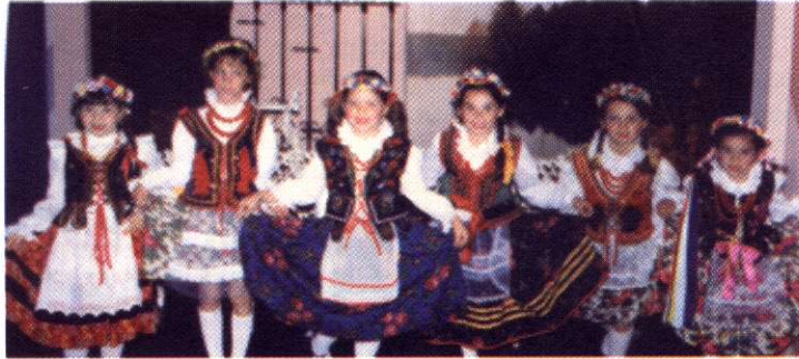
Grupo pionero de hijas de polacos en trajes de baile de krakowiak .

la situación de entonces de la colonia polaca en el Perú y se acordó formar una Asociación autónoma de carácter apolítico, sin discriminación de orden religioso, social o racial, sin fines de lucro, que acogería a todos los polacos y los descendientes de los polacos con sus cónyuges e hijos residentes en el Perú.