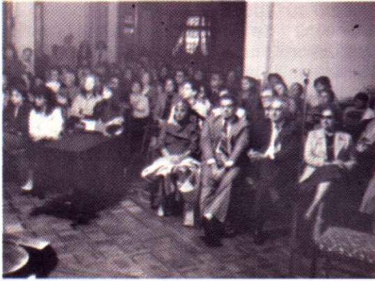
Concierto con música de Chopin organizado por Dom Polski, en 1984.