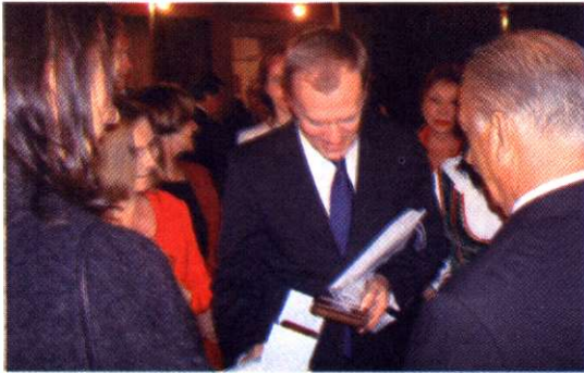
Momento en que el Premier recibe el presente de Dom Polski.

una entrevista privada de casi una hora con el Presidente Alan García. Luego de dicha entrevista, el Perú y Polonia sellaron los 85 años de relaciones bilaterales con la suscripción de tres documentos de cooperación en materia de defensa y de turismo, así como el protocolo ejecutivo del convenio de colaboración cultural y científica para los años 2008-2011.