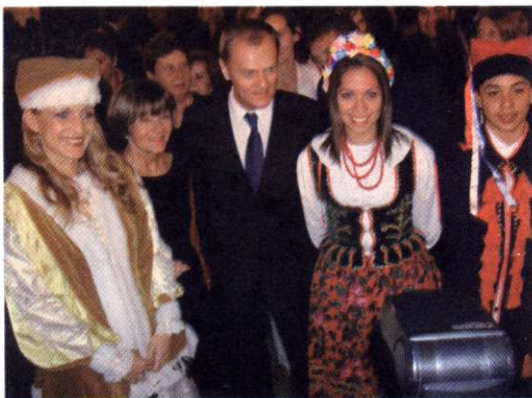
El Premier polaco Donald Tusk junto a su señora esposa e integrantes de la comunidad polaca en Lima.