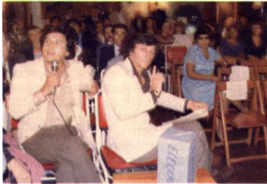
Primera Asamblea de Dom Polski, hace ya 25 años.