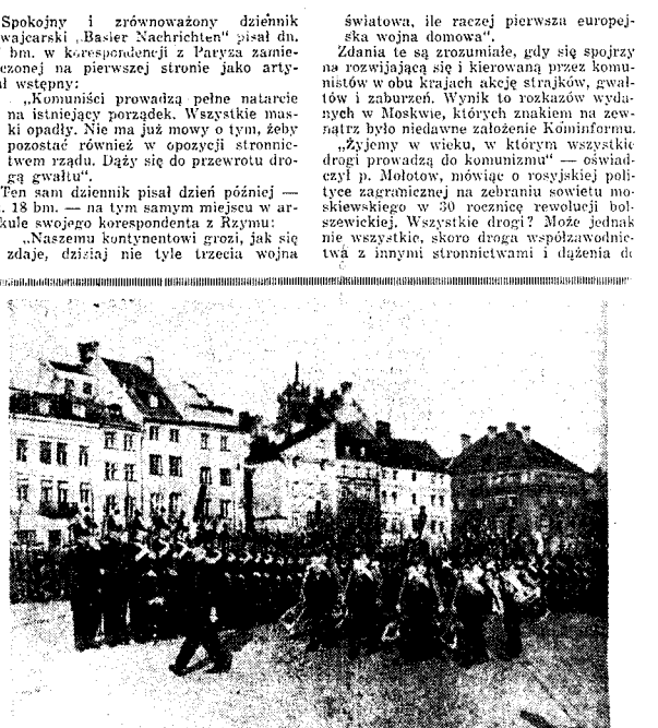
Apel kompanii honorowej podchorążych w historycznych mundurach z r. 1830 odbywał się co roku 29 listopada przed wojną w Warszawie

— Dzień ten przyszedł z Moskwy? — pytanie, na które Karboński nie odpowiedział. Był to jednak dzień, który przyniósł nadzieję, dzień, który dał poczucie, że walka jest warta, że życie jest możliwe.