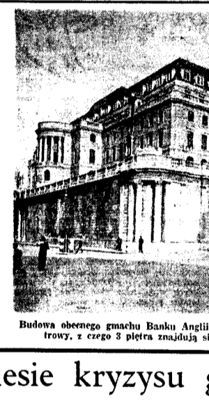
Budowa obecnego gmachu Banku Anglii...