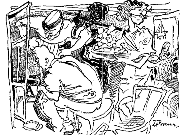
Reżyser? Władnie aranzują niooty nad naszymi głowami. O! — druga bomba wałowa...