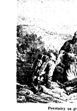
Powstania na granicy tureckiej