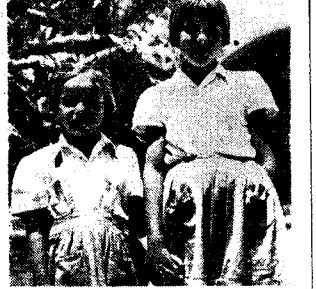
Dziewczęta polskie w Santa Rosa