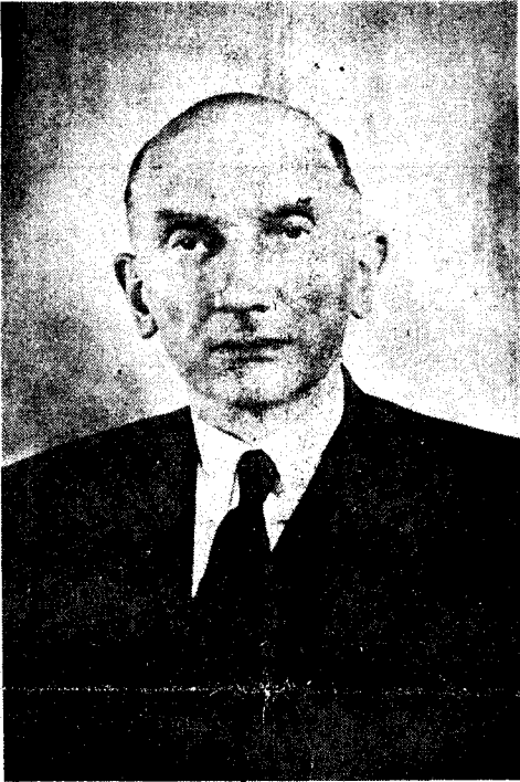
Prezydent R. P. August Zaleski

Kraj, który ma zakwestionowane usta, może być przeświadczone, że w walce o najwyższe wartości Narodu i Państwa Polskiego nie ulegniemy się.