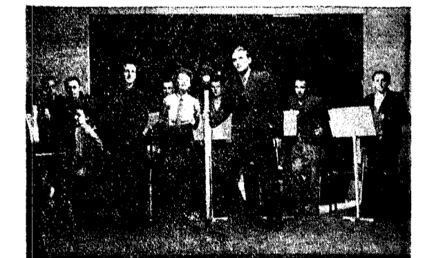
„Podwieczorek przy mikrofonie” w Maczkowie