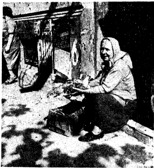
Tak żyje się i handluje w Warszawie

Jeżeli chodzi o stosunki polityczne, korespondent określa Polskę jako „kraj katolicki, który przez komunistów”.