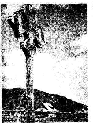
Krzyż przydrożny w Karpatach