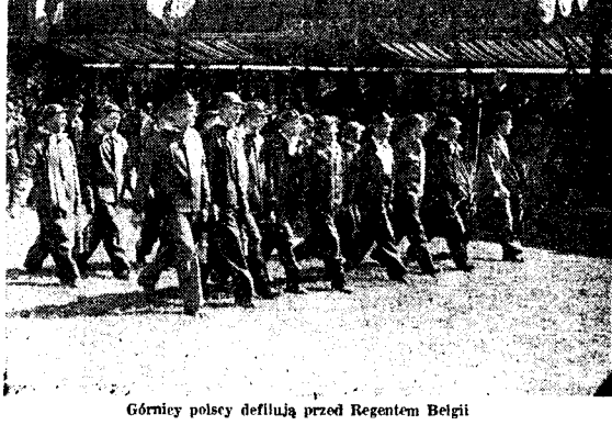
Górnicy polscy defilują przed Regentem Belgii