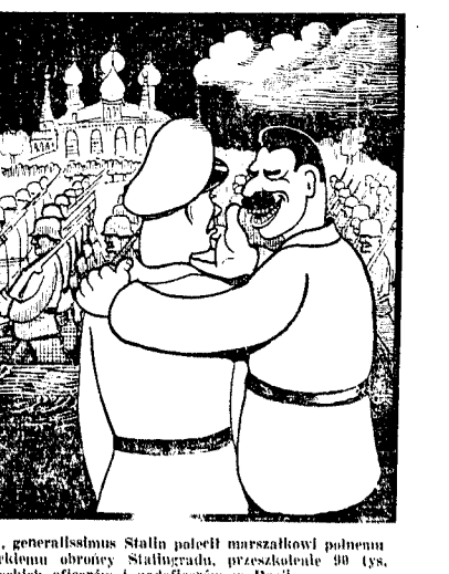
Jak domossa prasa, generalissimo Stalin polecił marszałkowi państwa Paulusowi...