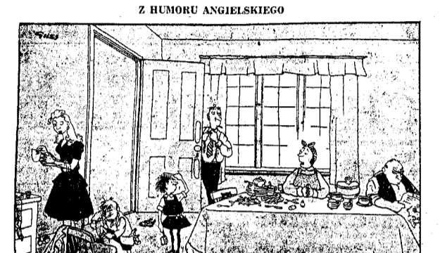
Z HUMORU ANGLIJSKIEGO