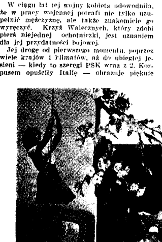
Stronice z albumu pamiątkowego PSK