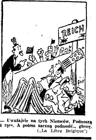
Uważacie na tych Niemców. Podnoszą już...