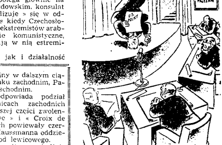
Specjalne zgromadzenie O.N.Z. w sprawie Palestyny. Delegat St. Zjednoczonych: «Chemy, by nasza postawa była dla wszystkich kalkulem jasną».