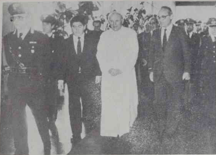
Przed wyjazdem z Rzymu

w świecie współczesnym, a zwłaszcza w naszej Ojczyźnie.