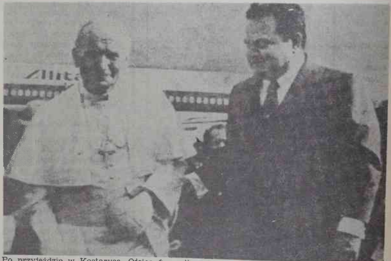
Po przyjeździe w Kostaryce, Ojciec Św. witany jest przez prezydenta Alberta Luis Moya.

Powierzchnia : 112.088 km kw. Ludność : 4.545.223.