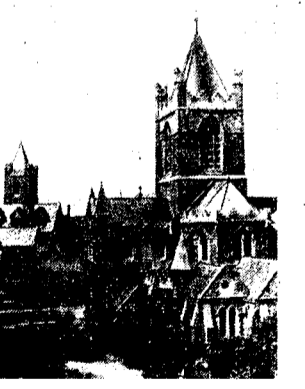
Katedra w Dublinie, zbudowana w wieku XII. (odnowiona w r. 1871).