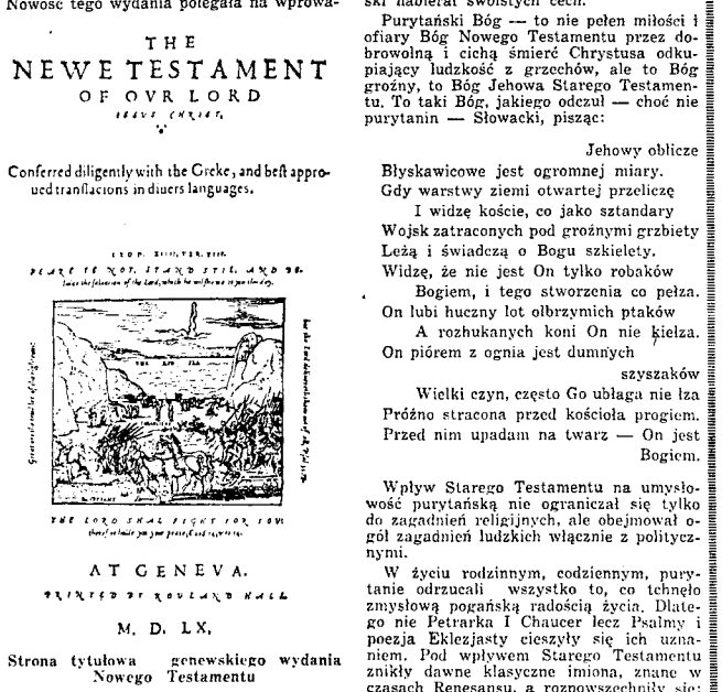
Strona tytułowa genewskiego wydania Nowego Testamentu

na myśli The New Testament in Basic English (1941), gdzie zamiast 860 słów słownika The Basic English użyciu 1000 słów. Dla porównania dodać trzeba za Dixonem, że angielskie przekłady Nowego Testamentu liczą średnio około 6000 słów.