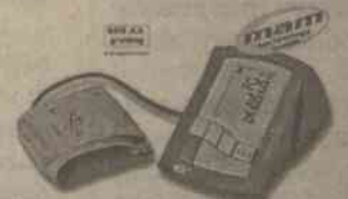
Automatyczny aparat do mierzenia ciśnienia krwi BP 3ACI-1