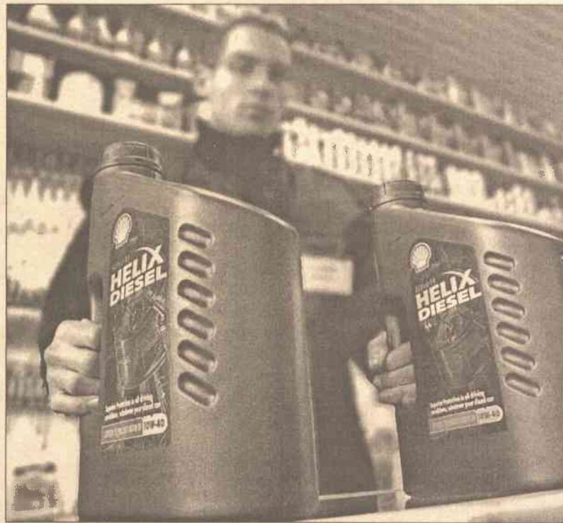
Czasami odróżnić falsyfikat od oryginału może tylko fachowiec

Skoro więc takie produkty się tworzy, ktoś powinien je użytkować. Podrobki przyciągają przede wszystkim niewygodną ceną, często dwukrotnie niższą niż rzeczy oryginalnych. Tak więc cena