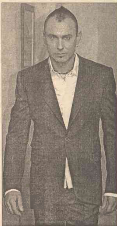
Dziś biała koszula pozostając podstawowym standardem elegancji, stała się też robotem wieloczynnościowym.

Elegancki mężczyzna nie może w tym sezonie obejść się bez swetra, chociaż do XIX wieku nosili go tylko chłopcy. Klasa wyższa ubierała się w rzeczy szyte, nie dziergane. Upowszechniło je dopiero odkrycie dobroczynnego wpływu sportów. Pulower z wycięciem w kształcie V jest po prostu wełnianą adaptacją kamizelki. Można go nosić pod marynarkę z krawatem i koszulą lub muszką, można wkładać pod kurtkę dżinsową, można dekoracyjnie zarzucić na ramiona, jak robią to Włosi i Francuzi. Obowiązkowo z jagnięcej wełny, w kolorach, które pasują do temperamentu. Angolicy lubią beże i odcienie zieleni, Francuzi czerwienie, granaty i szarości. Pulower w serek ze sportową koszulą i dżin-