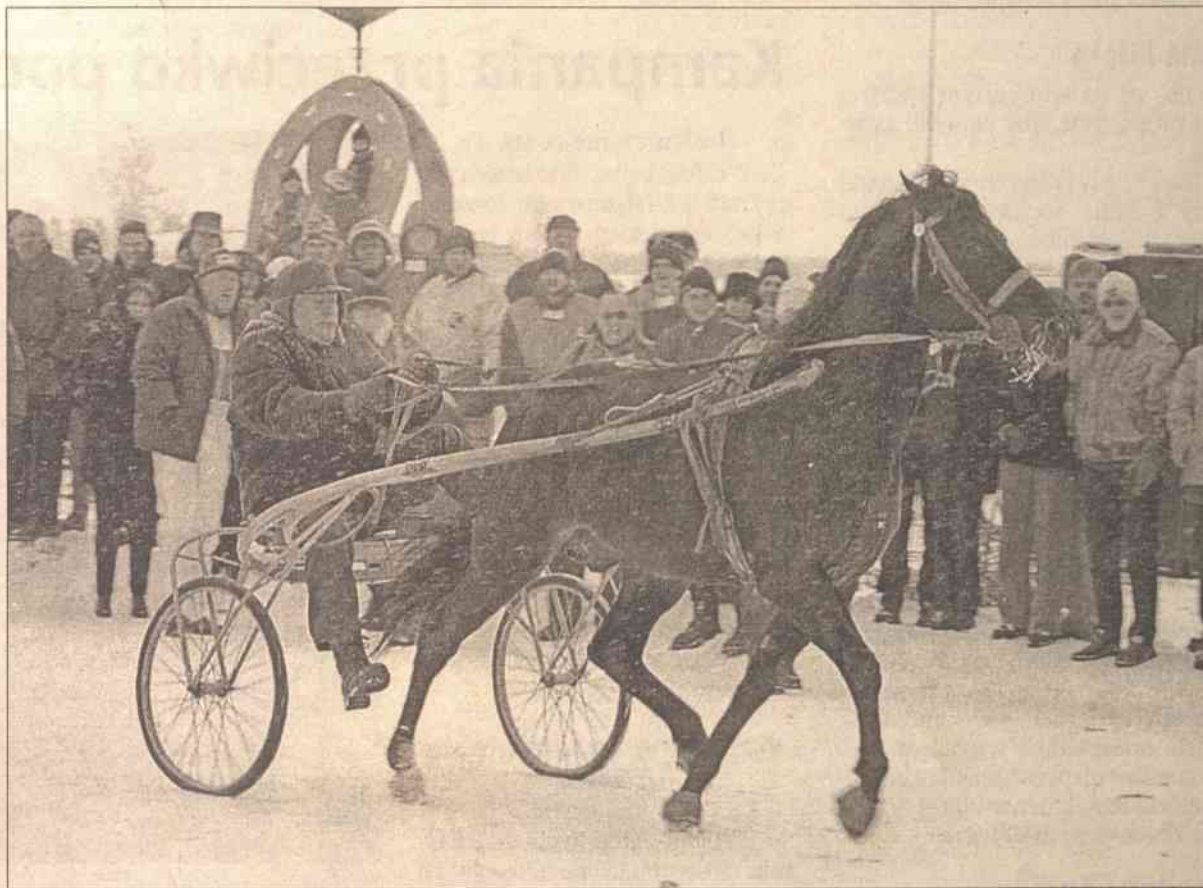
Kierując swym drugim rządem Algirdas Brazauskas będzie miał znacznie trudniejsze zadanie niż podczas kierowania pierwszym gabinetem

Podstawowym celem nowego gabinetu będzie „formowanie socjalnie ukierunkowanej gospodarki rynkowej”. Dowodem na to ma być podniesienie płac zarobkowych i emerytur, zmniejszenie bezrobocia, zwrot wkładów rublowych, wypłata rekompensat za ziemię i nieruchomości, wspieranie wielodzietnych rodzin i młodych małżeństw. Zgodnie z programem do końca kadencji tego parlamentu i rządu w roku 2008 średnia miesięczna płaca mieszkańców Litwy ma wynieść 1 800 Lt, minimal-