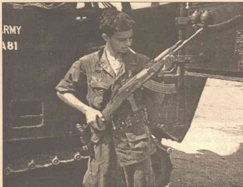
W październiku 2003 roku bułgarskie zakłady „Arsenal” wygrały przetarg na dostawę 40 tys. arsenałów dla irackiej armii

Władze rosyjskie domagają się uregulowania sprawy na szczeblu międzyrządowym i uzyskania państwowych gwarancji dla porozumień licencyjnych, podczas gdy według władz w Sofii rozwiązania należy szukać w porozumieniach między zainteresowanymi firmami. Propozycja bułgarska wynika z faktu, że większość zakładów,