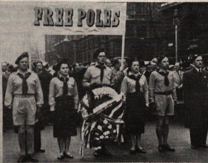
Orzeł Biały, październik 1966