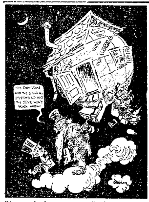
Stary rok do nowego: Synku, ten stary świat warto by trochę naprawić!

...o wroście narodowego dobrobytu punktu najwyższej koniunktury w 1929 r.