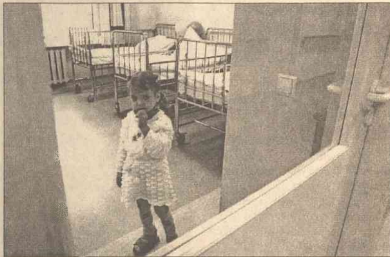
Jeśli dziecko nie odpowiada na pytania, nie wyjaśnia, co robi i dlaczego, wprowadza zamęt i pogłębia stres — poszukaj innego lekarza

Ostatnie tygodnie przed 6 grudnia i przed Bożym Narodzeniem to dla rodziców czas gorączkowych poszukiwań zabawek, o których