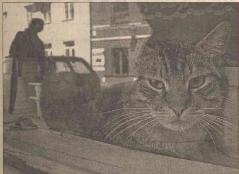
Zaostrza się tryb wywozu zwierząt domowych do krajów Unii Europejskiej w celach niekomercyjnych. Na mocy rozporządzenia rządowego Państwa Służba Żywności i Weterynarii wkrótce zatwierdzi przepisy dotyczące znakowania i identyfikowania agresywnych psów oraz warunki przygotowania domowych zwierząt do podróży razem z gospodarzem do krajów członkowskich

Była nim... mysz — podała austriacka telewizja. Z kasy sklepu w Villach w Karyntii zniknęły dwa banknoty po 50 euro. Jak się okazało, były one potrzebne myszy, która budowała gniazdo. Przystępczynię na gorącym uczynku uchwyciła kamera wideo, kiedy zwierzątko skrobało w szufladce kasy — podała telewizja. onet.pl