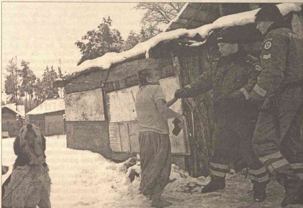
„Niestety, ci ludzie w ostatnim czasie nauczyli się urządzać show przed dziennikarzami” — mówi kierownik wydziału utrzymania porządku publicznego wileńskiego samorządu Dariusz Saluga

Samorząd zawczasu uprzedził mieszkańców taboru, że 2 grudnia rozpoczyna akcję burzenia nielegalnych budowli. „Przed rozpoczęciem naszej akcji zaproponowaliśmy samym mieszkańcom taboru zburzyć to, co bezprawnie zbudowali. Zignorowali nasze uprzedzenia i propozycję” — powiedział nam Dariusz Saluga. Sami mieszkańcy taboru, al-