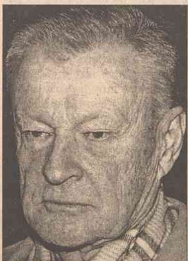
Wśród „Gwiazd” konferencji będzie wpływowy polityk USA Zbigniew Brzezinski, były doradca prezydenta Jimmy'ego Cartera ds. bezpieczeństwa narodowego

Wśród „Gwiazd” konferencji będą dyplomata niemiecki, były szef misji OBWE, którą z kraju wypędził autorytarny prezydent Alek-