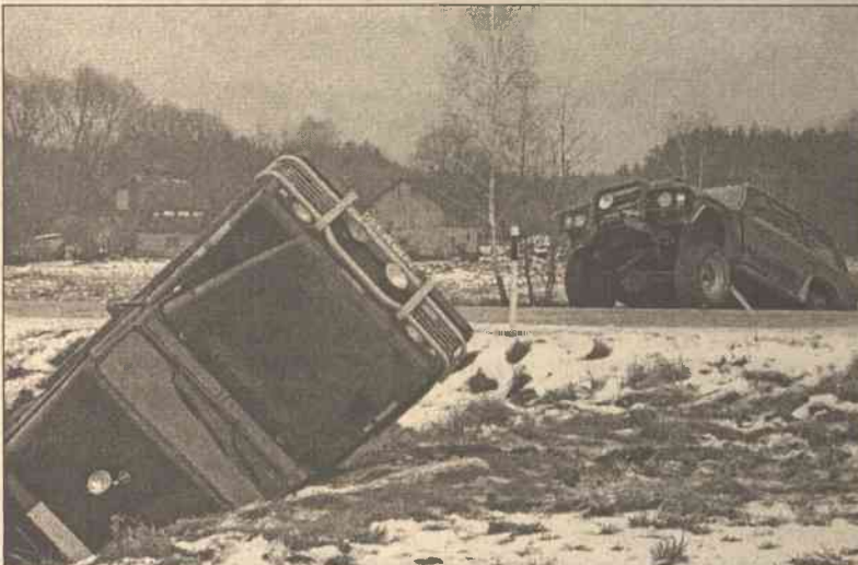
W środę nad ranem na terenie samorządu Pojeji, nietrzeźwy mieszkaniec Taurogów spowodował najbardziej beczelny incydent, jaki dotąd notowali pogranicznicy. Wóz terenowy Toyota prowadzony przez mężczyznę, który towarzyszył ładunkowi przemytniczemu, staranował samochód służbowy z czterema pogranicznikami. Samochód funkcjonariuszy ześlizgnął się na pobocze i przewrócił. Jeep taurożanina również zjechał z drogi. Na szczęście, rany pograniczników nie są poważne, świadczy o tym fakt, że oni sami zatrzymali winowajcę tego zajścia