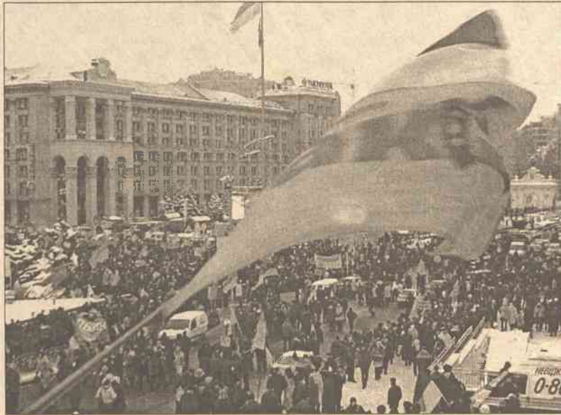
Uczestnicy wieców w Kijowie i popierający ich w całej Ukrainie mają nadzieję, że sytuacja w kraju zmieni się na lepsze

Pod wieloma względami odpowiedź jest zbieżna z tą dotyczącą Polski. Dziękujemy za udział, za to, że negocjacje się rozpoczęły. Zresztą skończyły się równie prędko. Władze (Kuczma and Co.) chcą pozostać na placu boju same. Nie potrzebują nikogo