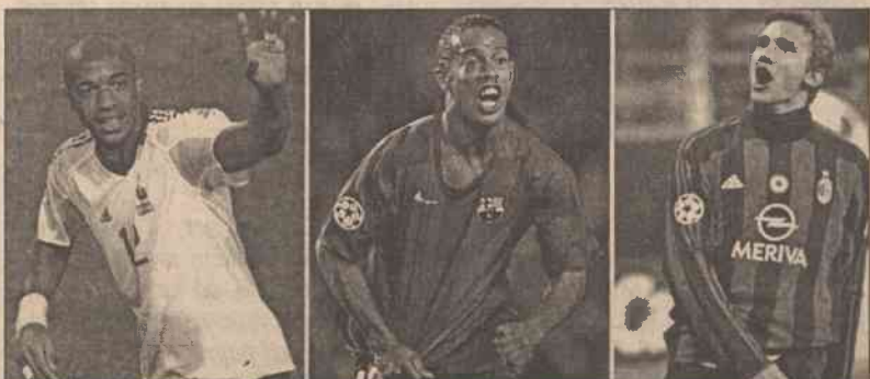
Francuz Thierry Henry (Arsenal Londyn), Brazylijczyk Ronaldinho (Barcelona) i Ukrainiec Andriy Szewczenko (AC Milan) są kandydatami do tegorocznej nagrody Piłkarza Roku FIFA