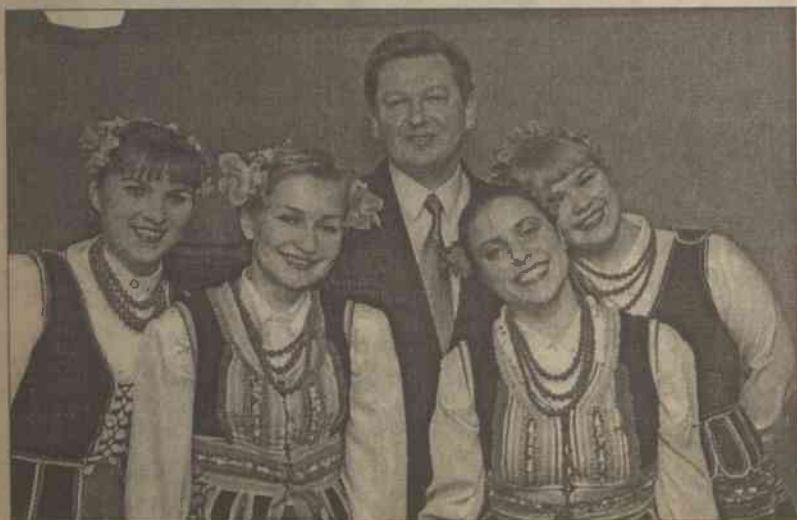
Kierownik „Zgody” po koncercie staje się kolegą zespolaaków