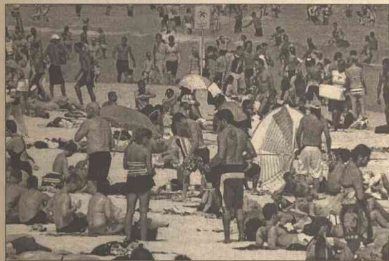
Na Litwie zapanowała zima, a tymczasem na kontynencie australijskim gorąco, że aż strach. W ostatnich dniach temperatura na południu Australii skoczyła do 34,7 stopni ciepła i tysiące mieszkańców Sydney okupowało okolice plaży szukając ochłody w wodzie...