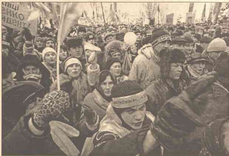
Na Ukrainie już ponad tydzień trwają wielotysięczne manifestacje opozycji, która uważa, że wyniki wyborów prezydenckich 21 listopada zostały sfałszowane na rzecz Janukowycza.

opozycji dokonał wczoraj próby wdarcia się do budynku parlamentu; deputowani opozycji nazywają to prowokacją. Do zamieszania pod budynkiem Rady Najwyższej doszło tuż po zamknięciu debaty. Opozycja usiłowała doprowadzić w jej trakcie do ogłoszenia wotum nieufności wobec rządu Wiktora Janukowycza i przeforsować uchwałę przeciwko wschodnioukraińskim separatystom. Gdy przewodniczący Rady Najwyższej Wołodymyr Łytwyn przełożył posiedzenie na dzisiaj, otaczający parlament tłum zwolenników lidera opozycji Wiktora Juszczuki napał na wejście. Kilku osobom udało się wejść do gmachu, zanim wejście zatarasowali posłowie opozycji. „To prowokacja - na początku podburzali salę, a