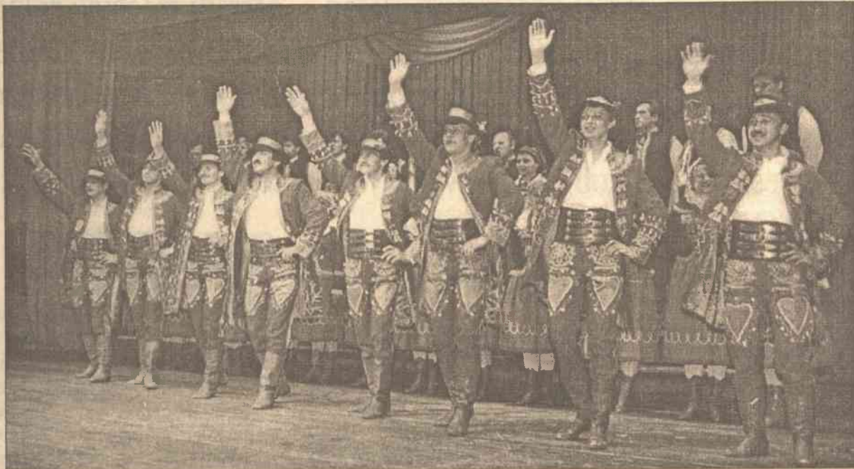
Taka to była paczka kolegów w trzeciej generacji tancerzy „Wili”. Występ na scenie Teatru Polskiego w Warszawie