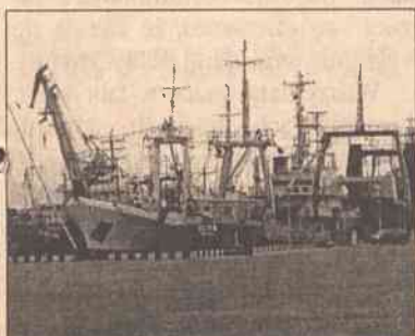
Wczoraj podpisana została umowa o kupnie-sprzedaży 70,01 proc. akcji spółki „Klaipėdos laivų remontas” (KLR). Konsorcjum „Jūros vartai”, założone przez spółki „Eika” i „Achema” za kontrolny pakiet akcji KLR zapłaci 5,2 mln Lt, informuje Fundusz Majątku Państwowego. „Pieniądze za akcje zapłacimy jeszcze we wtorek”, powiedział dyrektor „Jūros vartai” Arūnas Štaras.