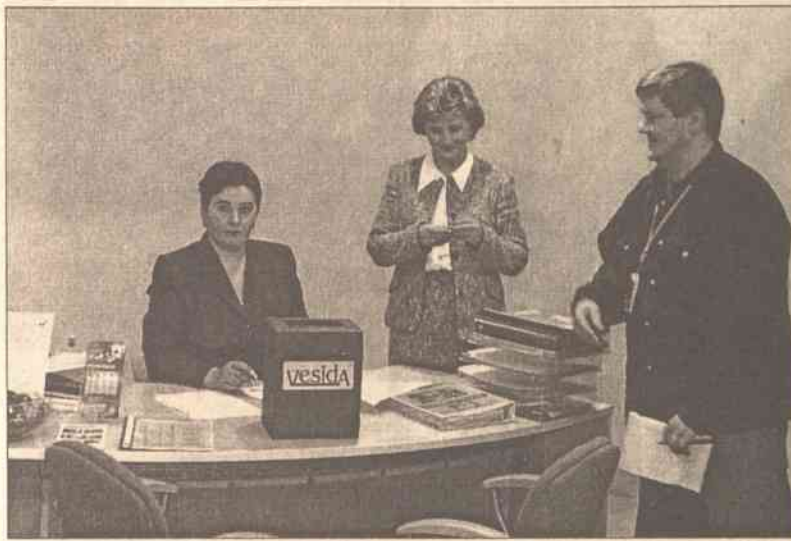
Sprawiedliwości stało się zadość, ponieważ po wyciągnięciu szczęśliwych losów okazało się, że zniżki powędrują do pięciu różnych zakątków Litwy

— Mielśmy nieduży warsztat stolarski, który pomagał nam wykonywać pewne detale, materiały potrzebne do prac wykończeniowych. I wtedy właśnie zauważyliśmy, jakie są najbardziej pilne potrzeby klientów. Wówczas akurat dosyć modne było wstawianie przesuwanych drzwi, rozmaitych szaf wnękowych, które zaczęły się dopiero pojawiać na rynku. Pierwsze próby z wykorzystaniem angielskich systemów marki „Handerson” dały nam dobre rozpoznanie zapotrzebowań klientów. To nie były systemy precyzyjne, toteż nasze poszukiwania