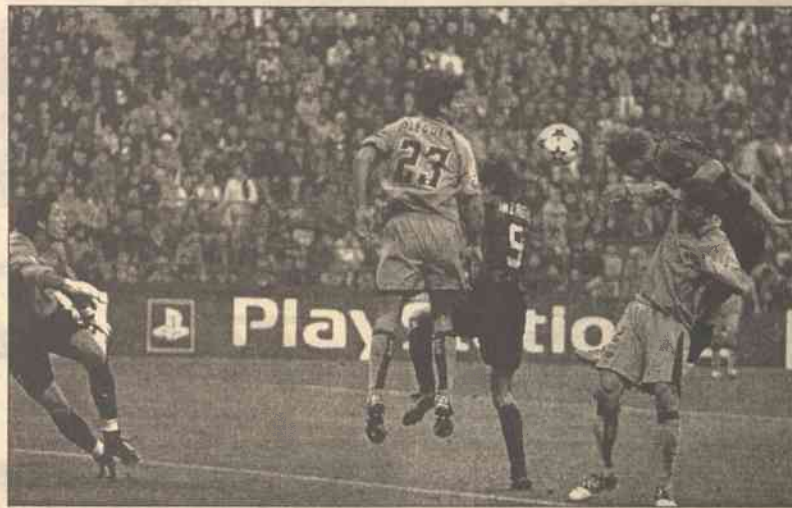
Jedyną bramkę dla Milanu strzelił niezawodny napastnik ukraiński Andrij Szewczenko (na zdjęciu w prawym roku w górze), który popisał się efektywną „główką” w 31. minucie spotkania

Także w drugim środowym pojedynku włosko-hiszpańskim górą byli piłkarze z Półwyspu Apenińskiego. W grupie F Milan wygrał u siebie z Barceloną i podobnie jak Inter bez straty punktu prowadzi w tabeli. Jedyną bramkę strzelił w 31. minucie niezawodny Andrij Szewczenko. W końcówce Barcelona zdecydowanie zaatakowała, ale nie zdołała zmienić wyniku. W innym meczu Szachtar Donieck niespodziewanie