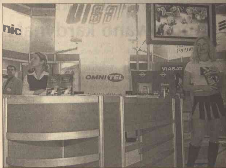
Na wystawie były komputery szybciej wykonujące operacje, ich obudowy ładniejsze, obsługa miłsza, panienki przy stoiskach ładniejsze, a ich spółniczki krótsze

Przyjemną wiadomością jest także to, że na wystawę przybyli organizatorzy światowej wystawy technologii informacyjnych CeBIT.