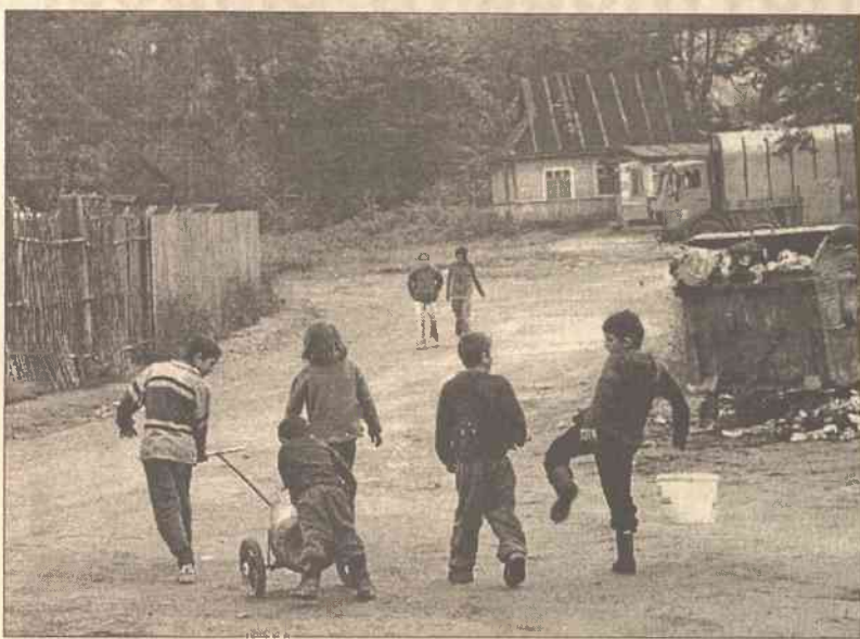
Ogółem w wileńskim taborze mieszka 354 osoby, z nich 51 posiada zezwolenie na stałe zamieszkanie na Litwie. 127 mieszkańców — to osoby w wieku poniżej 16 lat.

W rajdach brało udział 219 policjantów i 24 żołnierzy z pułku służby wewnętrznej Ministerstwa Spraw Wewnętrznych. Do komisariatu policji nr 3, kontrolującego teren taboru, przywieziono 37 osób: za posiadanie środków narkotykowych — 7; za nabycie lub realizację mienia pochodzącego z przestępczej działalności — 6, za używanie narkotyków — 10, za drobne chuligaństwo — 1, poszu-