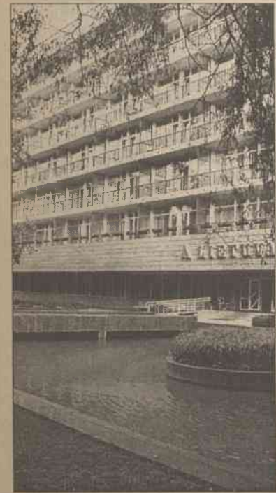
Widok sanatorium od frontu. Dziś ten blok mieszkalny zwany jest hotelem

W roku ubiegłym osoby, które skorzystały ze skierowań Kasy Chorych stanowiły 25 proc. z 4,5 tys. kuracjuszy. Nie jest to mało, jeśli się uwzględni, że kuracjusze z zagranicy stanowią bardzo poważny wyżej wymieniony procent.