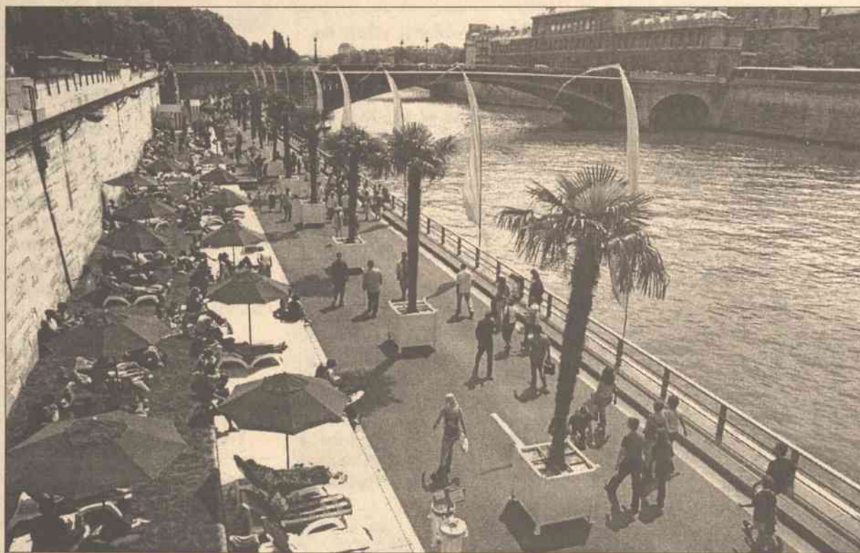
3,5 km nadbrzeżnych bulwarów nad Sekwaną w Paryżu już po raz trzeci zmieniło się w plażę, z prawdziwymi palmami, piaskiem, kawiarniami, leżakami do opalania i basenem. Władze miasta liczą, że miejsce to — do 20 sierpnia — odwiedzą co dzień tysiące turystów oraz paryżan, którzy nie wyjechali na wakacje. Położona w samym centrum miasta paryska plaża — o 3,5 km długości i kilku metrach szerokości — ma początek na wysokości ogrodów Tuileries i rozciąga się aż do mostu Sully. Od rzeki dzieli ją niewysoka metalowa bariera.