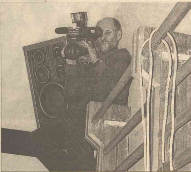
Tradycyjnie najwięcej obaw wywołuje filmowanie, ponieważ nie każdy człowiek radzi sobie ze stresem przed kamerą

— Nasze szkolenia prowadzimy w ten sposób, aby człowiek zdobył pewną wiedzę teoretyczną oraz doświadczenie praktyczne. Organizujemy tu w biurze małe studio telewizyjne, zadajemy wiele prowokujących i kłopotliwych pytań i nagrywamy, nagrywamy. Później nagrania są przeglądane wspólnie z klientem i analizowane plusy oraz minusy wywiadu czy wystąpienia. Zdarza