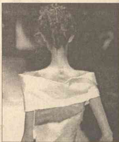
W pogoni za ideałem nastoletnie dziewczyny tracą poczucie miary

Odchudzać się zaczęła dwa lata temu. Chociaż tak naprawdę nigdy nie była grubą. Co prawda znajomi przyznają, że wtedy przydałaby się jej lekka dieta, a raczej może trochę sportu.