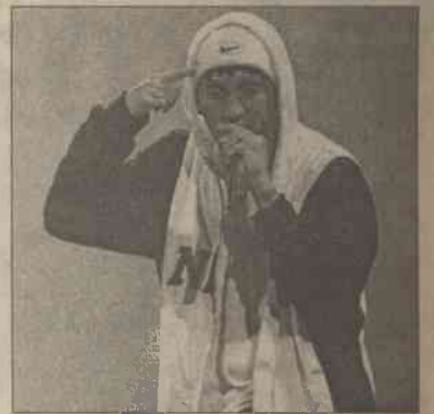
Jedynym problemem przy zatrudnieniu rapera może być... zbyt duża liczba tatuaży na jego ciele

Przygotowując się do swojej kolejnej filmowej roli Eminem korzysta z pomocy byłego trenera Lennoksa Lewisa.