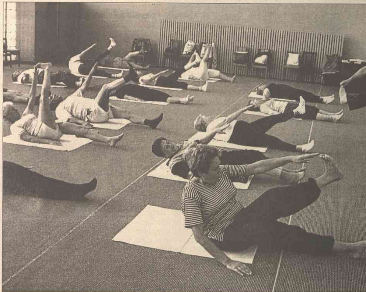
Wczasowicze w „Lietuwie” poddawani są wszechstronnej „obróbce”: nie tylko masażom i kąpielom borowinowym. Ćwiczenia gimnastyczne dobre są na każdą chorobę, o ile się je wykonuje pod bacznym okiem fachowca

Wczoraj przedstawiciele „Grupy PZU” o tym oświadczyli w Wilnie z 31 — ostatniego piętra — biurowca „Europa”. Dyrektorzy „Grupy PZU” akcentowali podczas konferencji prasowej, że takie zamierzenia nie są wyjątkiem litewskim, lecz załącznikiem nie odbiegającym od ogólnej strategii firm zajmować pierwsze pozycje na rynkach kra-