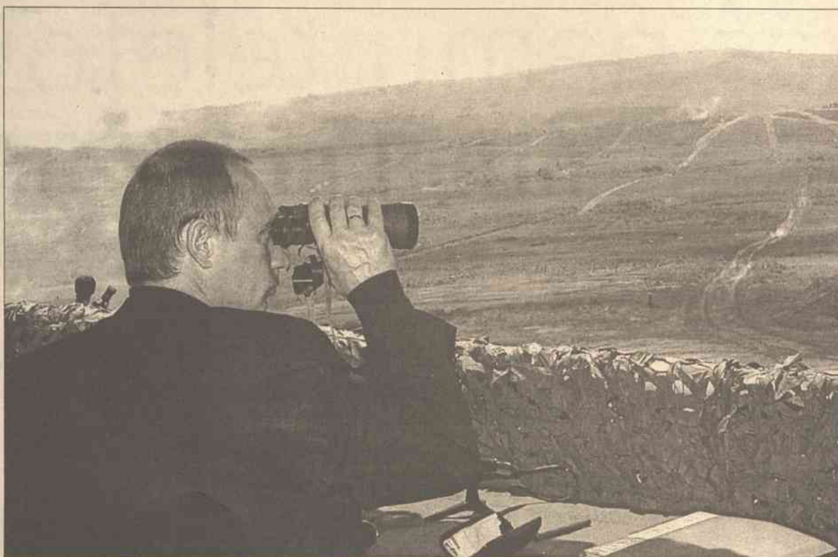
Wszechmocny prezydent Putin bacznym okiem obserwuje poczynania rosyjskich oligarchów, którzy nie zrobią nic, co mogłoby im odebrać sympatię albo przynajmniej obojętność „cara”

Borys Chodorkowski sam chyba nie bardzo rozumie, dlaczego jego syn w odpowiednim czasie nie schronił się za granicą. Michaiłowi Chodorkowskiemu grozi nawet dziesięć lat więzienia. Należący do niego największy koncern naftowy Rosji musi oddać miliardy dolarów zaległych podatków i bankrutuje. Światowe rynki reagują nerwowymi skokami cen ropy na każdy plynący z Moskwy sygnał o tym, jak potoczą się dalsze losy Jukosu. Kraj obraz po upadku korporacji wygląda alarmująco. Ale na Kremlu prezydent Władimir Putin przygląda