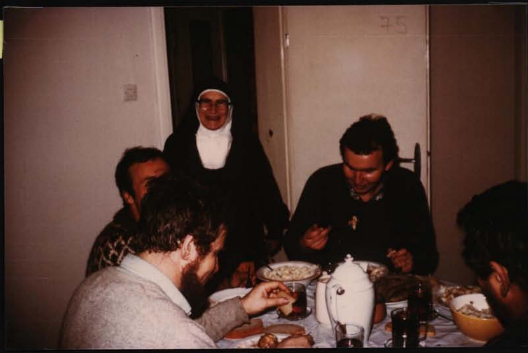
Chez les CARMÉLITES - L'Équipe de VESOUL