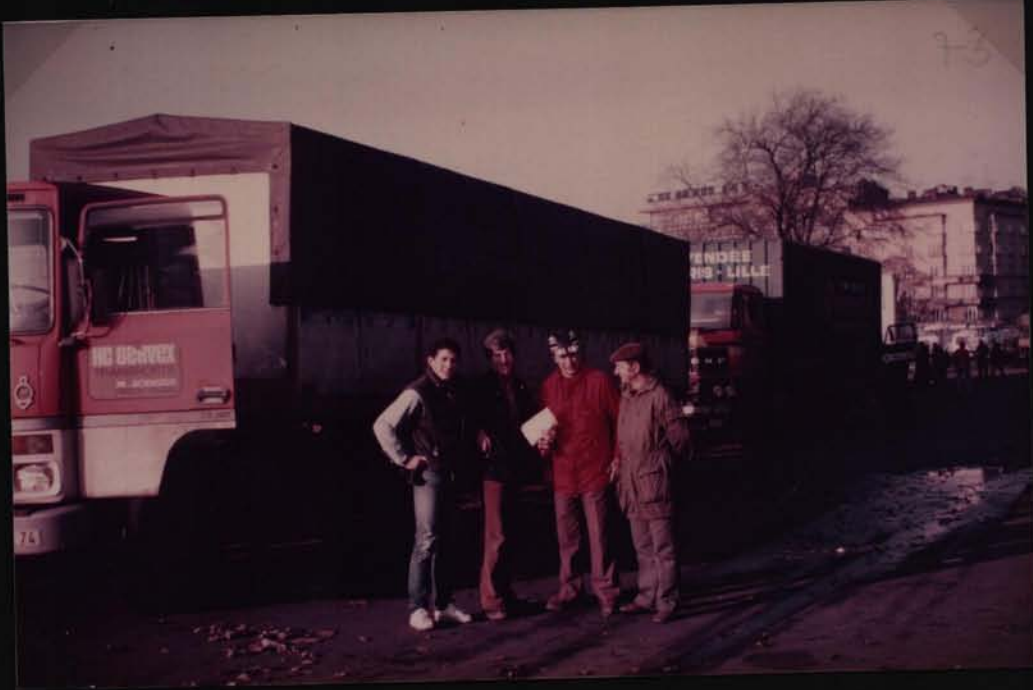
CRACOVIE sur un parking -