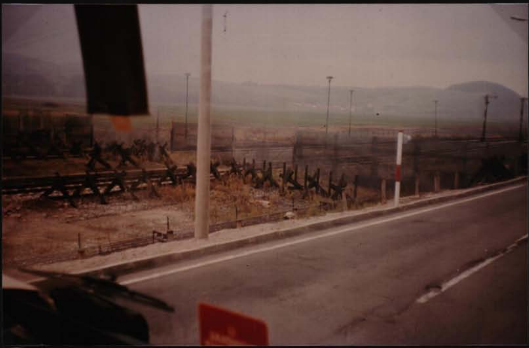
Frontière R.F.A. D.D.R.