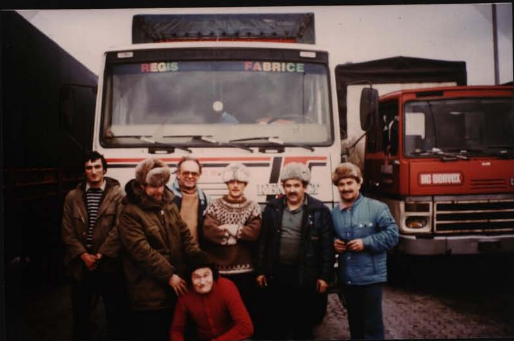
EQUIPES de VESOUL NANCY LUÇON.