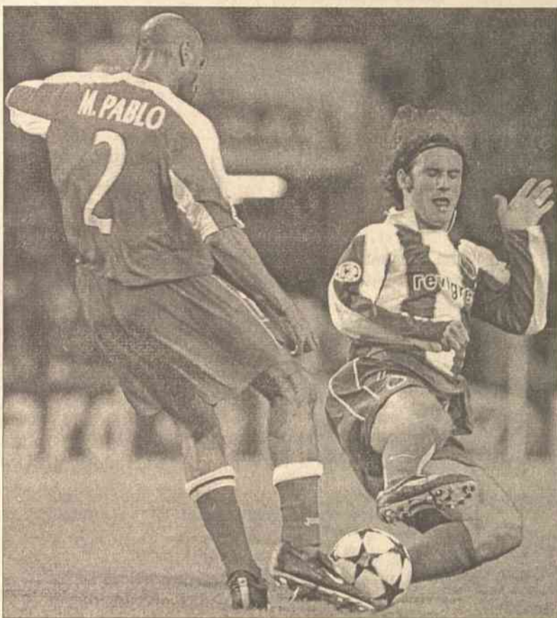
Nudna gra w wykonaniu obu zespołów rozczarowała kibiców, piłka krążyła głównie w środku pola

Warto z tego meczu zapamiętać trzy momenty. Pierwszy — gdy pomocnik Porto Maniche trafił z 25 metrów w poprzeczkę. To był nie za mocny, mierzony strzał i Maniche nie miał szczęścia. Drugi — minimalnie niecelna główka Edgarasa Jankauskasa po podaniu Deco z rzutu wolnego. Trzeci — faul byłego piłkarza Porto Jorge Andrade, obecnie ostoi defensywy Deportivo, na Deco. Gdy się podnieśli, Jorge Andrade kopnął Deco ponownie, tym razem lekko w zębra, jakby chciał go przeprosić. Niemiecki sędzia Markus Merk nie zrozumiał żartu i pokazał winowajcy czerwoną kartkę, mimo że ten bez przerwy powtarzał „To mój przyjaciel”. Może stało się tak dlatego, że Deco nie potwierdził, że też jest przyjacielem Jorge'a Andrade? Portugalczyka zabraknie w meczu rewanżowym za dwa tygodnie, podobnie jak Mauro Silvy, który wykorzystał limit żółtych kartek. Deportivo zapowiedziało jednak odwołanie do UEFA w sprawie Jorge'a Andrade. Kto wie, jak się to wszystko skończy, jeśli De-