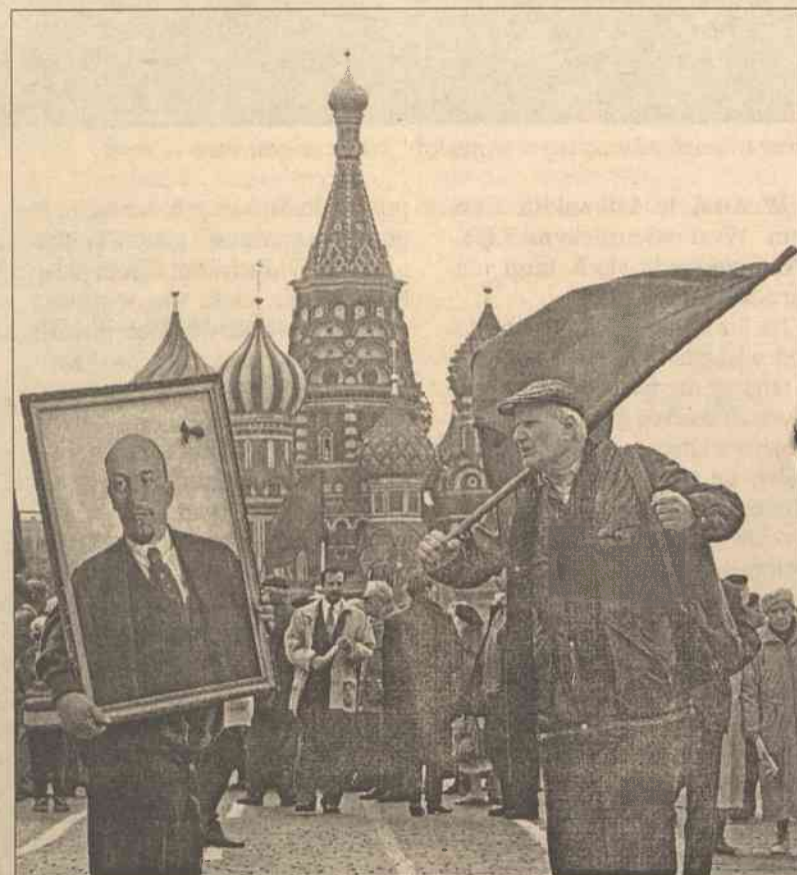
Wczoraj na Placu Czerwonym w Moskwie uczczono 134. rocznicę urodzin Włodzimierza Lenina, twórcę Rewolucji Październikowej

Bułgarzy — według najnowszych danych 440 — stacjonują w Karbali, również w polskiej strefie. Niebawem do kraju ma powrócić 23 żołnierzy. Trzynastu z nich wraca na własne życzenie, pozostali 10 — z powodu stwierdzonego przez lekarzy pourazowego zespołu pola walki lub z przyczyn dyscyplinarnych. W ostatnich dniach poinformowano, że ze strefy tej wycofają swych żołnierzy Hiszpania, Honduras i Dominikana, które wraz z Salwadorem tworzyły brygadę Plus Ultra, wchodzącą w skład dywizji wielonarodowej.