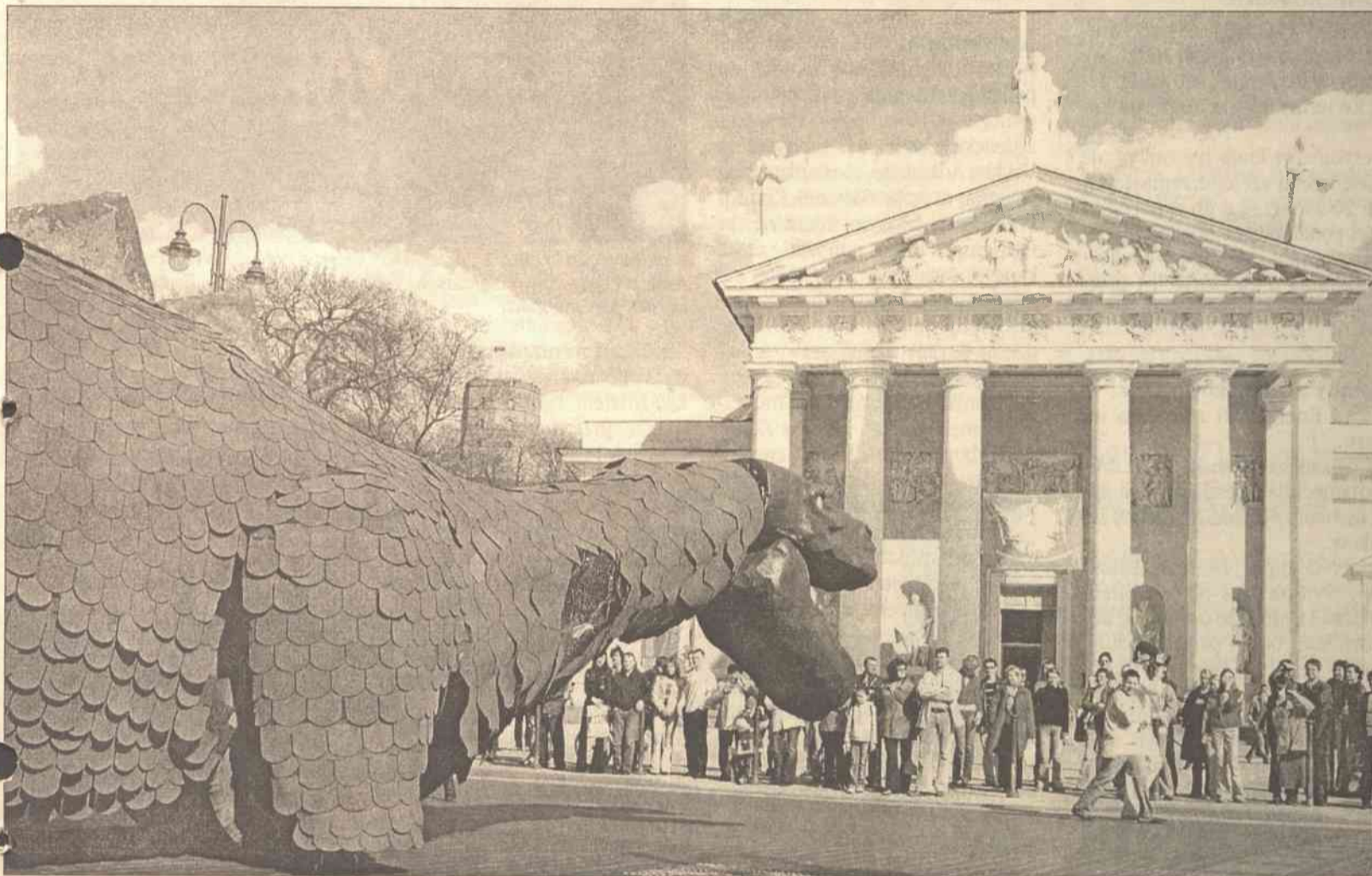
Zazwyczaj Inspekcja Podatkowa niczym żarłoczny smok „wyciąga” od obywateli — w tej liczbie studentów — pieniądze. Tym razem, zgodnie z nową redakcją Ustawy o Podatku Dochodowym Mieszkańców, żacy otrzymają z powrotem część zapłaconych za studia pieniędzy

„Pieniądze sprawiają, że świat się kręci...” — śpiewała kiedyś Lisa Minelli. Wiadomo, bez forsy nic nie da się zrobić. Czasem nawet skończyć studiów. Wyścig szczurów o bezpłatne miejsce na liście studen-