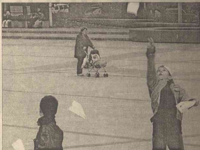
Zdaniem psychologów dziecko nie było i nigdy nie będzie lekiem na samotność

Lato już o krok, a to świetna okazja, by zająć się sobą. Zanim przystąpimy do działania, pomyśl-