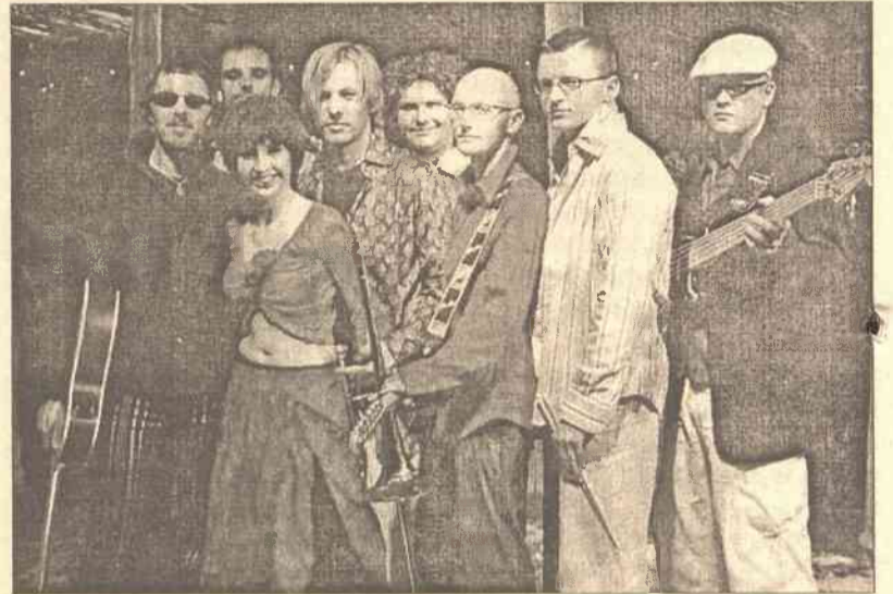
Zespół Blue Cafe to 8-osobowa grupa świetnych, profesjonalnych muzyków z wokalistką o niezwykle interesującej barwie głosu

Czy eurowizyjne piosenki Litwy i Polski mają szansę na zdobycie pierwszego miejsca? Gdyby spróbować na podstawie danych statystycznych określić, czym jest piosenka eurowizyjna, to wyszłoby na to, że to, czy ona jest eurowizyjna, czy nie, nie zależy od samej piosenki. Perfekcyjna piosenka eurowizyjna jest bowiem piosenką z kraju o nazwie Irlandia. Reprezentanci tego państewka zwyciężali w konkursie siedem razy, co stanowi absolutny rekord. Ich średnia punktów zebranych w konkursach w latach 1975-2003 jest również najwyższa i wynosi imponujące 105,7 pkt na konkurs. Perfekcyjna piosenka eurowizyjna to piosenka z kraju, który graniczy z Norwegią, bo to właśnie ten kraj najczęściej i najszczodrzej obdarza punktami piosenki z krajów sąsiednich.