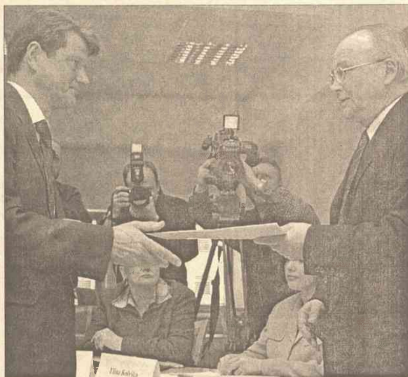
6 głosami „za” i tylko 2 „przeciwko” Główna Komisja Wyborcza pozwoliła byłemu prezydentowi Rolandasowi Paksasowi na start w przedterminowych wyborach prezydenckich

O tym, że wczorajsza druga tura negocjacji największych, tradycyjnych partii politycznych Litwy w sprawie wyłonienia wspólnego kandydata w przedterminowych wyborach prezydenckich jest skazana na niepowodzenie jeszcze przed ich rozpoczęciem, świadczyła wypowiedź premiera rządu i zarazem lidera rządzącej socjaldemokratycznej partii Algirdasa Brazauskasa o tym, że jego partia nie zmieni swej pozycji i nie odwoła swego