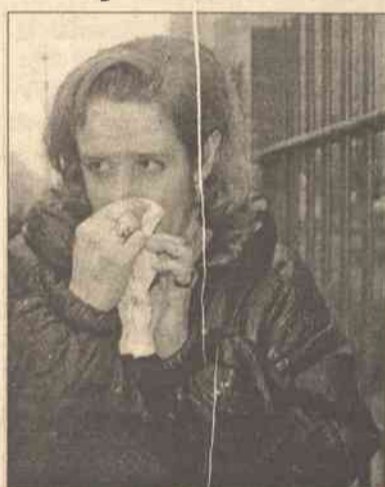
W Kłajpedzie wszczęto sprawę karną, w której 6 osób podejrzewa się o handel ludźmi, ciągnięcie zysków z nierządu, wciąganie do prostytucji nieletnich