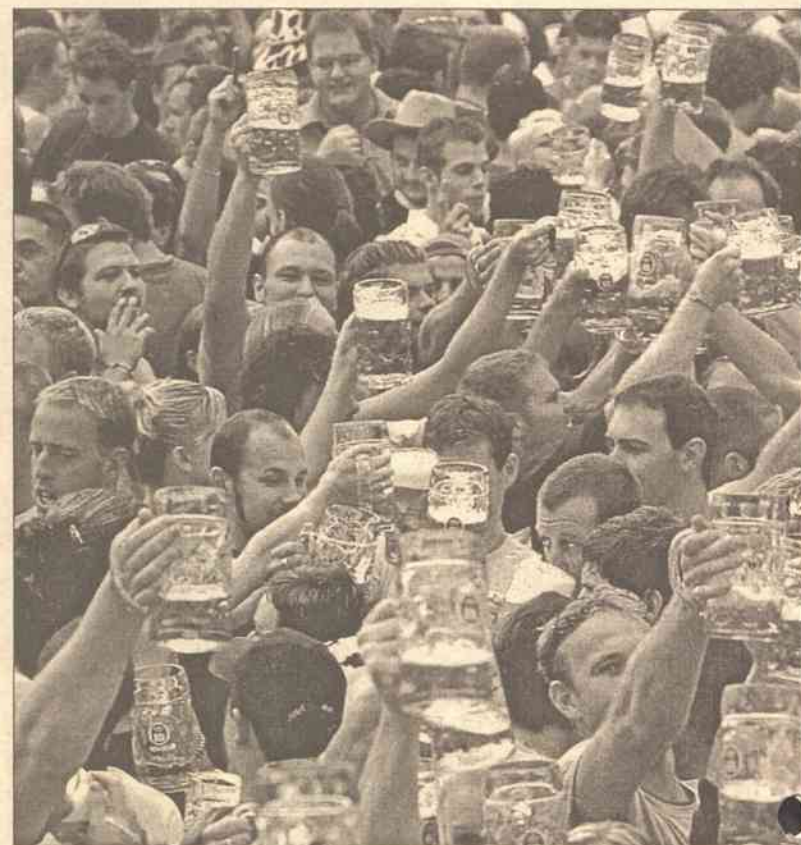
Piwo w ostatnich latach stało się niezwykle popularne na Litwie. Przyczyniły się do tego niewątpliwie organizowane co roku „święta piwa”

Nie jest to opinia tylko osób zainteresowanych i poniekąd pokrzywdzonych. Litewski Instytut Wolnego Rynku podczas analizy projektu do wyżej wymienionej ustawy również uznał ją za wadliwą. W swoich wnioskach pracownicy instytutu piszą między innymi: „Przypuszczalnym celem zakazu spożywania napojów alkoholowych w miejscach publicznych nie jest zmniejszenie spożycia alkoholu, lecz dążenie do tego, by publiczne