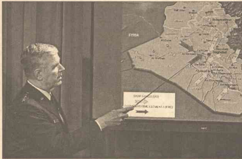
Generał Richard Myers, naczelnik Sztabu Generalnego USA, podczas konferencji prasowej w Pentagonie wskazał dziennikarzom miejsca, gdzie w ostatnich dniach nasiliły się walki z oddziałami Muktady al-Sadra

Krwawe zajścia 9 kwietnia 1989 roku wywołały potężny rezonans w całym ZSRR. Człowiek, który kierował śledztwem w tej sprawie Anatolij Sobczak — jeden z przywódców rosyjskich demokratów, a później wieloletni mer Petersburga — nie wahał się określić ich mianem „zbrodni przeciwko ludzkości”. Dzisiaj w Tbilisi zostanie otwarta ulica jego imienia. Masakra była odpowiedzią radzieckich władz na wielką demonstrację, której towarzyszyły postulaty niepodległości Gruzji. Gdy w kwietniu 1989 roku na głównej ulicy Tbilisi, prospeście Rustawelego zaczął zbierać się tłum niepodległościowych i demokratycznych demonstrantów, władza postanowiła użyć siły. Namawiał miał do tego ówczesny przywódca Gruzji Dżumber Patiaszwili. Jak twierdził