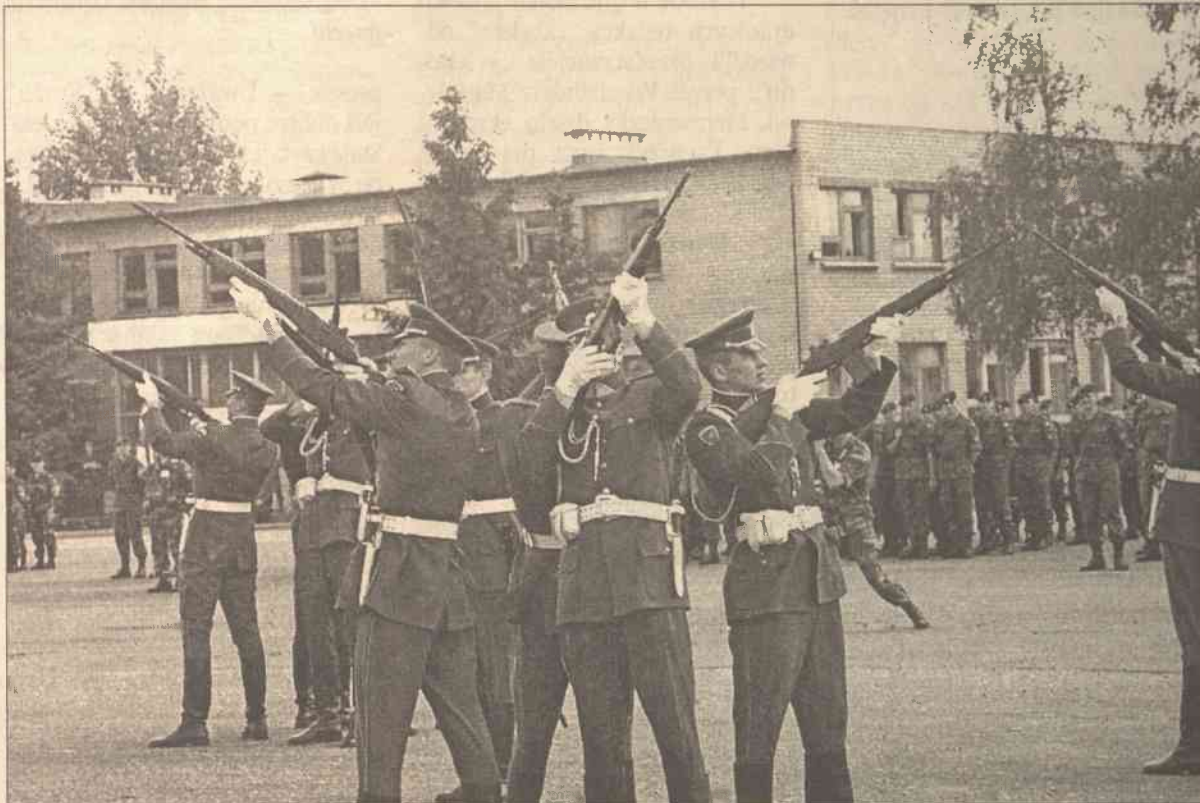
Zawarcie umowy międzypaństwowej stało się momentem przełomowym, który zapoczątkował nową epokę w stosunkach sąsiedzkich, jaką politycy obu krajów uznali za „najlepszą w wielowiekowych wspólnych dziejach Litwy i Polski”. Wygląda jednak na to, że deklaracje pozostają deklaracjami, a najgłośniejszym echem odbijają się zazwyczaj uroczyste salwy

— Jedyne, co się Zgromadzeniu niezmiennie udaje, to wystawne bankiety w atrakcyjnych lokalach