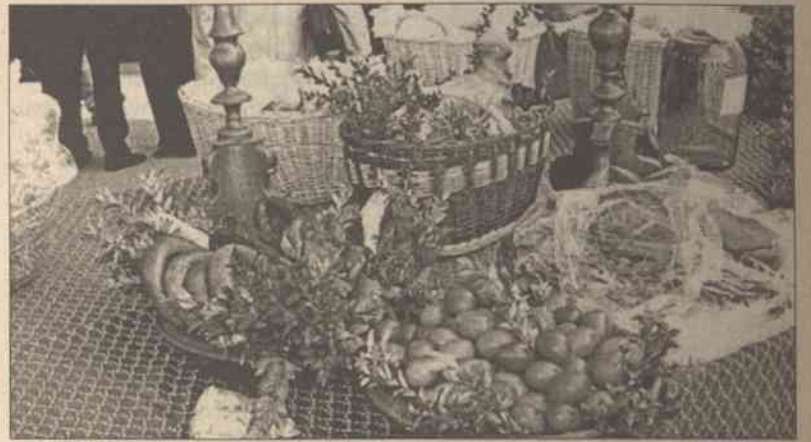
Starannie przystrojony świąteczny stół po prostu pięknie ozdobi nasze mieszkanie

W czasie każdego świąt — również podczas Wielkanocy — życie rodzinne koncentruje się wokół stołu. Nierzadko zasiadamy przy nim na długie godziny. Zadbajmy więc o to, by nasze spotkania przy wielkanocnym stole stały się dla wszystkich wyjątkowym i bardzo uroczystym przeżyciem. Poza tym starannie przystrojony świąteczny stół po prostu pięknie ozdobi nasze mieszkanie. Nakryty śnieżnobiałym obrusem świąteczny stół upiększymy ustawiając na nim kolorową zastawę. Z białym obrusem efektywnie kontrastują jednobarwne talerze (np. wdzięcznie przypominająca o wiosnie zastawa w trawiastozielonym kolorze) i pasujące do nich dodatki: sztuczce, serwetki, podkładki pod talerze. Nie zapomnijmy, oczywiście, o jajkach i młodych roślinach. Pięknie na świątecznym stole wyglądają również kraciaste serwetki. Kolorystycznie z nimi dobrze współgrają wiosenne kwiaty i pisan-