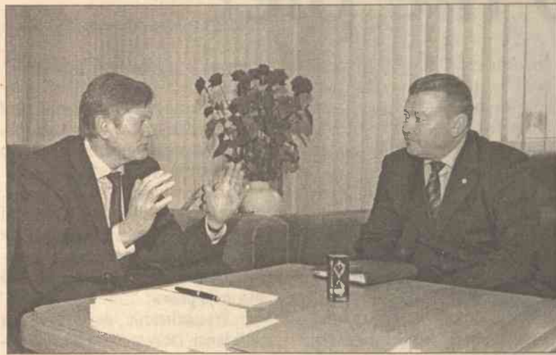
Komisarz generalny zapewnił p. o. prezydenta, że litewska policja zrobi wszystko, aby zapewnić bezpieczeństwo żołnierzom NATO

Zainteresowanie świata przestępczego NATO-wskimi żołnierzami dyslokującymi w Szawlach było jednym z tematów spotkania tymczasowo p. o. prezydenta Litwy Artūrasa Paulauskasa z generalnym komisarzem litewskiej policji Vytautasem Grigaravičiusem.