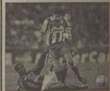
AC Milan poniósł jedną z największych klęsk w swojej historii, przegrywając z Deportivo 0:4.