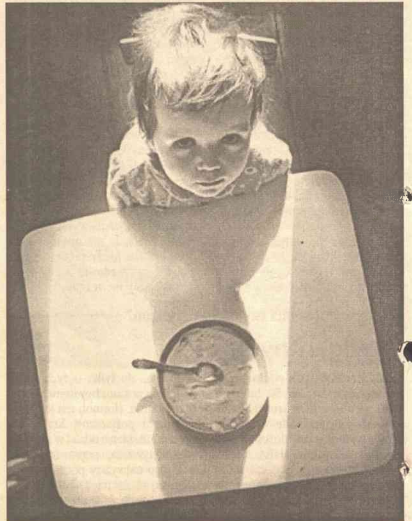
W miarę upływu czasu maluchy wyrabiają sobie bardzo wyraźną opinię na temat tego, co znajdują na swoim talerzu

Dziecko może jeść wiele dań, które spożywa reszta jego rodziny. Pamiętajcie jednak, aby odłożyć dla niego małą porcję, zanim dodacie do jedzenia sól i ostre przyprawy. Nie oznacza to oczywiście, że maluch na pewno będzie chciał jeść to co Wy. Dzieci w tym wieku mają tendencję do preferowania jednej potrawy, którą potrafią jeść przez wiele dni. Jest to objaw całkowicie normalny, którym nie musicie się przejmować. To jak często Wasza pociecha je daną potrawę nie ma znaczenia, pod warunkiem oczywiście, że danie zawiera odpo-