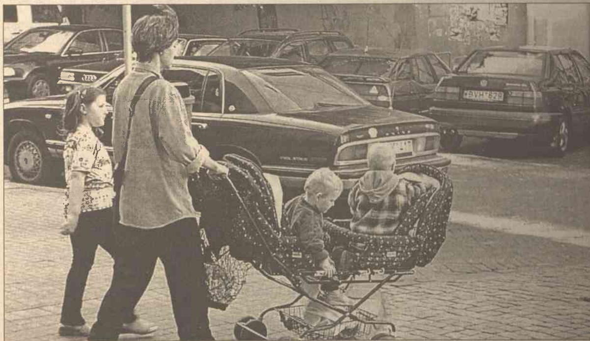
Według danych za ubiegły rok, na Litwie może być ok. 802,3 tys. dzieci do 18 lat, które pretendują do uzyskania zapomogi dla dzieci

Na 1 stycznia 2003 roku na Litwie zamieszkiwało 802,3 tys. dzieci