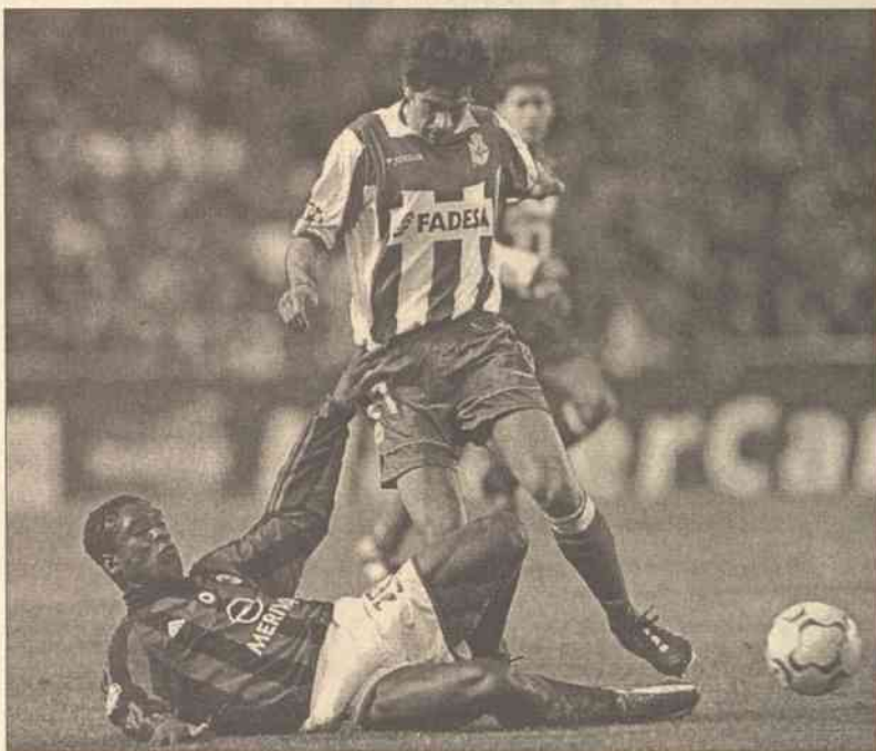
"Upadek bogów" — taki tytuł umieściła na pierwszej stronie "La Gazzetta dello Sport" określając porażkę AC Milan z Deportivo La Coruna w ćwierćfinale Ligi Mistrzów

Cały mecz wyglądał przedziwnie. O ile o zwycięstwie Milanu