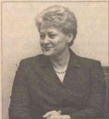
Uważam, że byłam dobrym ministrem finansów i dobrym członkiem rządu — powiedziała Grybauskaitė

I chociaż minister stwierdziła, że nie może kategorycznie powiedzieć „nie”, jeśli chodzi o kandydowanie na stanowisko prezydenta, zaznaczyła jednak, że funkcje we władzy wykonawczej interesują ją bardziej. Minister zapewniła, że oficjalnie żadna partia nie proponowała jej kandydowania na stanowisko prezydenta podczas wcześniejszych wyborów, a nieoficjalnych informacji nie zechciała komentować i przypomniała, że już 2 miesiące wcześniej czytała o tym w prasie zagranicznej.