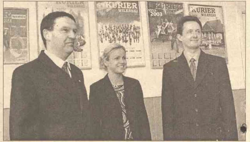
Przedstawiciele „Wieltonu” stwierdzili, że „Kurier” jest dobrze poinformowaną gazetą

— Pierwsze kroki w Wilnie stawialiśmy, korzystając z informacji Waszego dziennika, ogłaszając w nim nasze oferty o zatrudnieniu pracowników, dowiadując się o sytuacji w handlu, polityce i ekonomice — powiedział na wstępie pan