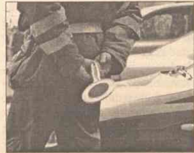
W akcji promowania zasad bezpieczeństwa ruchu drogowego wzięło udział 28 policjantów, którzy zatrzymali w celu sprawdzenia 160 środków transportowych

W areszcie śledczym-więzieniu na Łukiszkach karę odbywają skazani na dożywocie, reżim więzienny i areszt mężczyźni, jak też osoby aresztowane na decyzję sądu. Obecnie przebywa tu ponad 1200 takich osób.