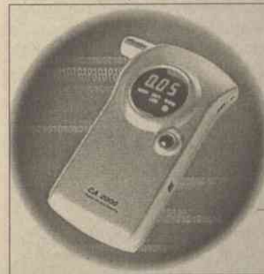
Policjanci z drogówki za pieniądze proponowali pijanemu kierowcy zniszczyć dane alkometru

Na miejsce wypadku przybył patrol policji drogowej z Głównego Komisariatu Policji Wilna. Funkcjonariusze ustalili, że kierowca Renault, winny spowodowania tego wypadku, jest w stanie zamroczenia alkoholowego. Policjanci zaproponowali pijanemu kierowcy sposób na „polubowne uregulowanie” przykrych sytuacji. Aby patrol