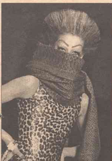
Zostań afrykańską królową. Wzory imitujące skórę dzikich zwierząt są absolutnym hitem. Lamparcie ćetki, tygrysie pręgi, paski zebry, lamy żyrafy. Wybieraj! Zwiewny szal w tygrysie pręgi ożywi każdą kreację. Torebka, pasek czy futerał na komórkę będzie idealnym prezentem koleżance. Puchate futerko takie na wzór z lat 80-tych, sprawi, że będziesz wyglądała czarująco.