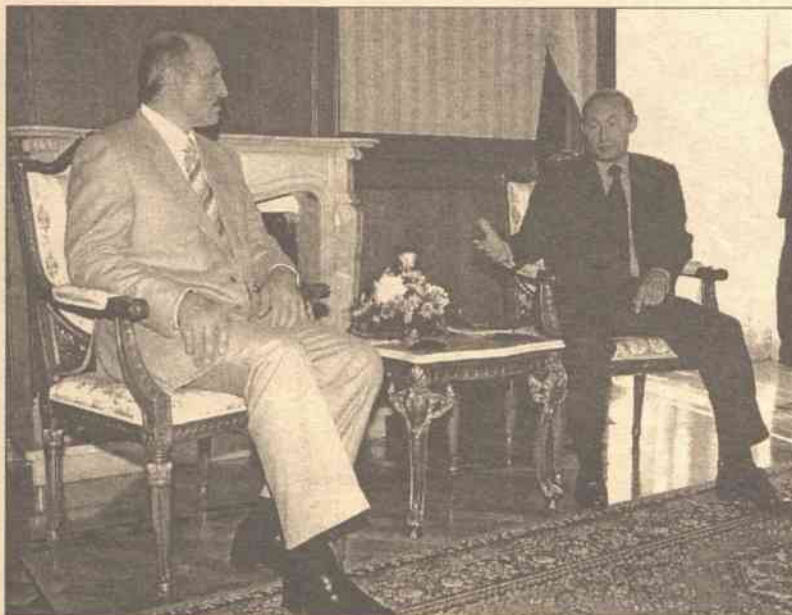
Przerwanie dostaw rosyjskiego gazu białoruski prezydent nazwał aktem terroryzmu. Na zdjęciu z prezydentem Rosji podczas wrześniowego spotkania w Soczi, gdzie rozmawiano o pogarszających się stosunkach między tymi krajami

Łukaszenka, który w swoim wystąpieniu nie szczędził ostrych słów Moskwie i rosyjskiemu prezydentowi Władimirowi Putinowi zapowiedział jednak, że jego kraj