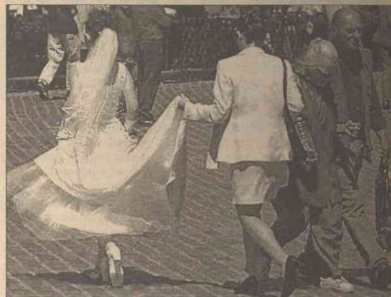
Greenwald zaleca, aby kobiety poszukiwały męża, przebiegle stosując twarde reguły marketingu

"Ta książka nie jest piękną bajką. Dzięki niej uświadomisz sobie,