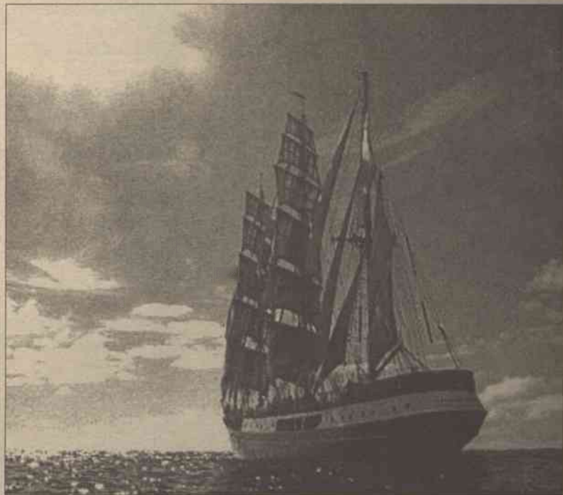
Kłajpeda zabiega o to, aby w następnym roku odbył się w tym mieście jeden z etapów Baltic Sail — międzynarodowego zlotu żeglarskiego propagującego turystykę żeglarską pomiędzy miastami Morza Bałtyckiego. Baltic Sail to wielkie spotkanie bałtyckich żeglarzy, natomiast dla zwykłych wyjadaczy chleba to niepowtarzalna okazja do zwiedzania jachtów, kontaktu z żeglarzami, przyjrzenia się z bliska zwyczajom i bogatym tradycjom od wieków rządzącym surowym życiem pod żaglami