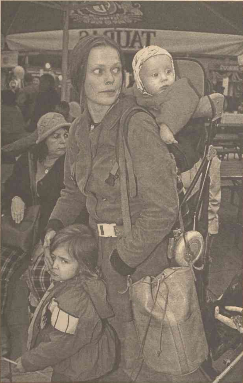
Im dziecko jest starsze, tym bardziej lubi się rozglądać wokół, dlatego nosidelka na plecy świetnie się nadają na rodzinne wycieczki.

Coraz częściej widzimy na ulicy maluchy w nosidełkach na brzuchu mamy lub taty. Ten rodzaj transportu nadaje się dla dzieci do 6. miesiąca życia i przydaje się wtedy, kiedy dziecko jest malutkie (a więc lekkie), a ty wybierasz się z nim np. do sklepu. Albo kiedy chcesz ugotować obiad, a dziecko leży w łóżeczku i płacze. Ważną jest to, że kiedy zaśnie, trudno jest je zdjąć, nie budząc malucha.