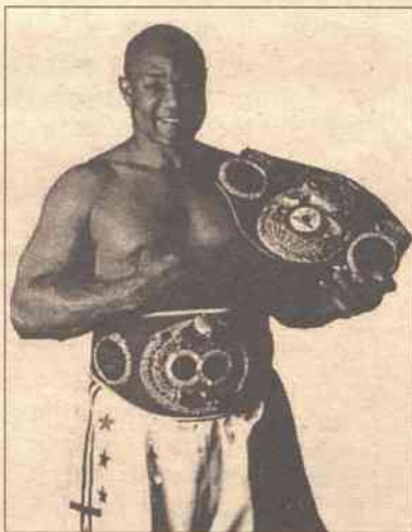
W 1994 roku, dwadzieścia lat po porażce w walce o pas z Alim, Foreman został ponownie mistrzem świata organizacji WBA i IBF