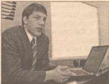
Jak powiedział Pranskevičius, spółka jeszcze nie zdecydowała, czy klienci po wybraniu usługi „InterCall” będą płacili abonament, ale takiej możliwości nie neguje

„Dla każdego korzystającego z tej usługi klienta należy stworzyć dodatkowy kanał przekazywania danych głosowych, w związku z czym pewna opłata abonamentowa może być wprowadzona. Sądzę, że miesięcznie wynosiłaby ona 50-60 Lt” — powiedział Pranskevičius. Zazaczył on, że techniczna możliwość rozpoczęcia świadczenia nowej usługi „Baltnetos