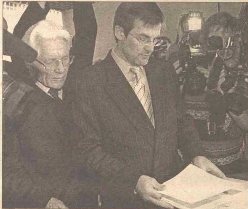
Składająca się po połowie z posłów na Sejm i zawodowych prawników wybranych z sądów i prokuratury, komisja śledcza stwierdziła, że prezydent Paksas swymi konkretnymi działaniami złamał przysięgę i naruszył konstytucję

W rozpowszechnionym wczoraj komunikacie jest mowa o tym, że gaz ziemny dla Litwy zaczęto do-