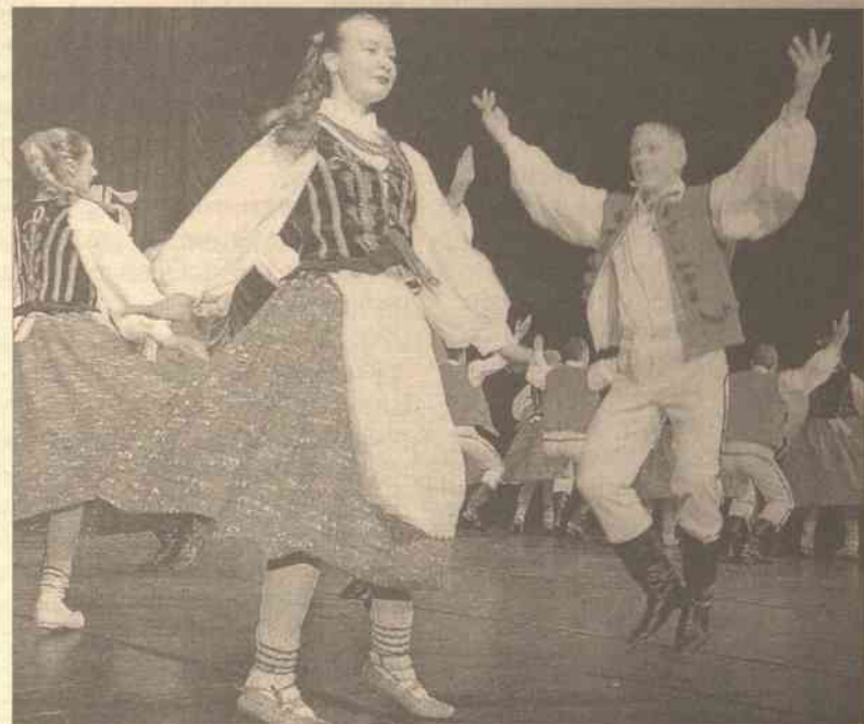
Tańcerze zaprezentowali tańce: opoczyńskie, łowickie, góralskie