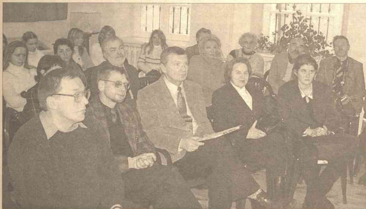
Impreza w Muzeum Mickiewicza zgromadziła nauczycieli i uczniów wileńskich szkół, liczne grono naszych poetów i pilotów wycieczek