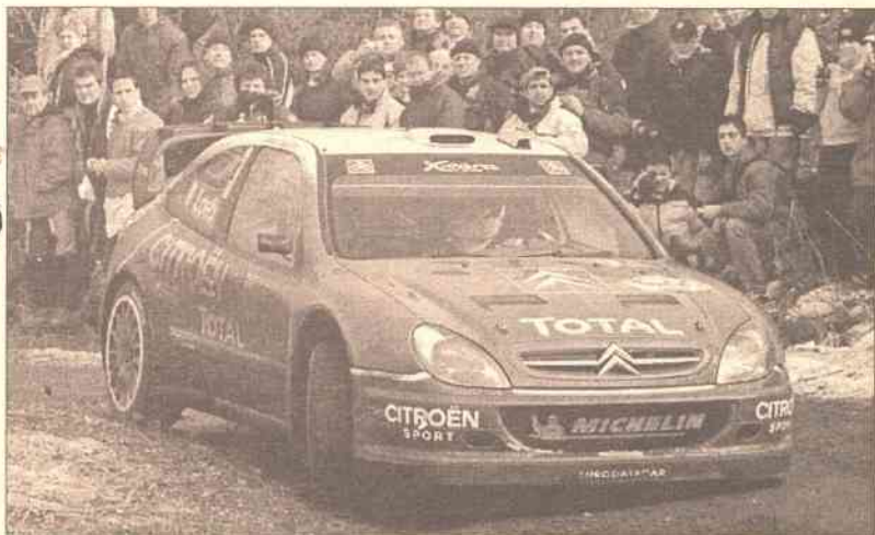
Francuski kierowca Citroena Sebastien Loeb (Citroen Xsara WRC) wygrał w niedzielę samochodowy Rajd Monte Carlo