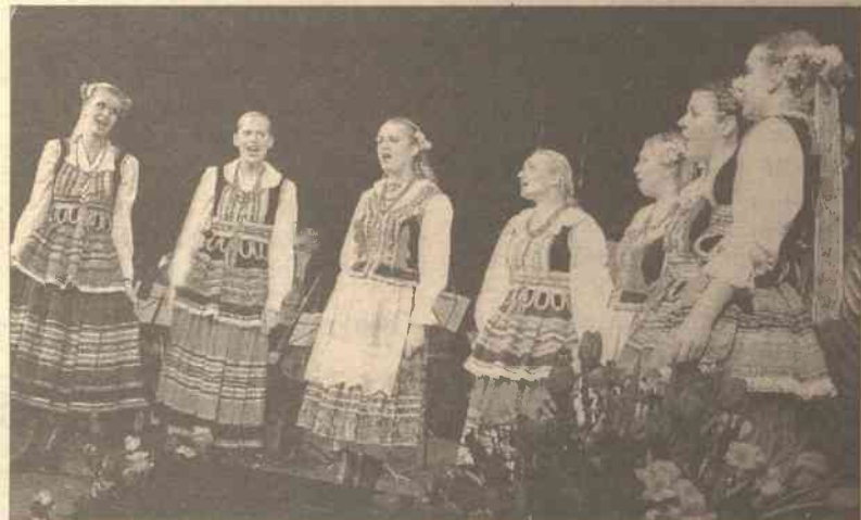
Premierę, ale udaną, miała grupa wokalna