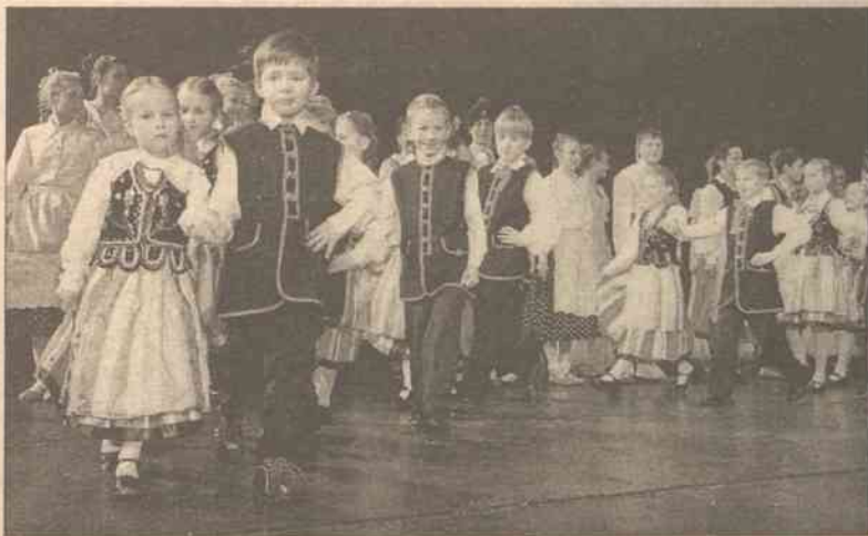
Najmłodsza grupa taneczna wrzuciła do tańca