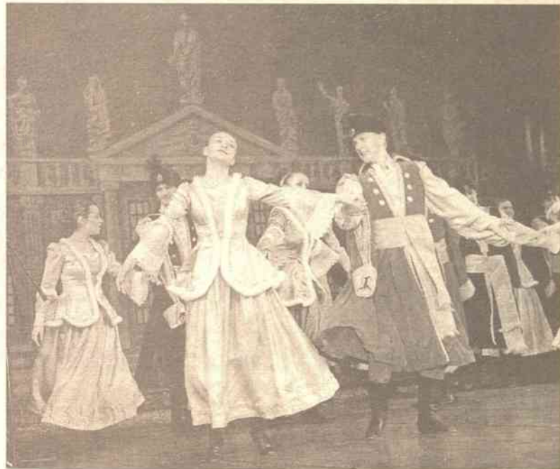
Mazur ze „Strasznego dworu” St. Moniuszki

Czy mogą nie utkwić w pamięci takie oto słowa przedstawicieli Do-