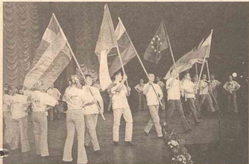
Zespół tańca ludowego „Zgoda” zaskoczył tańcem współczesnym