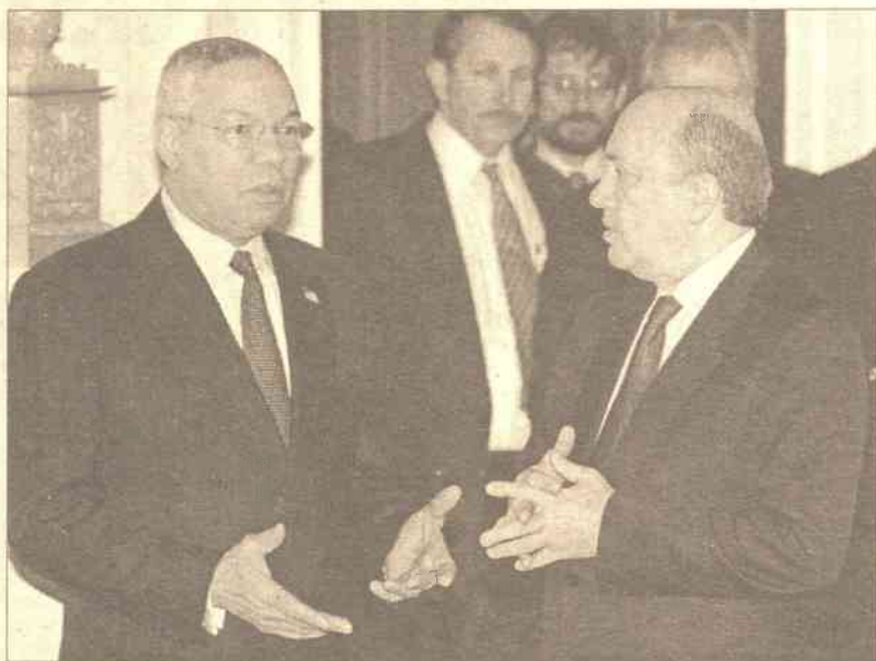
Powell chwalił „elastyczność”, z jaką Putin i Iwanow podchodzili do kwestii dwóch istniejących na terenie Gruzji rosyjskich baz wojskowych.

Z kolei Powell podkreślił, że „w tych dziedzinach, w których występuje brak zgody i różnice, trwałość naszych stosunków pozwoli te przeszkody przewyciężyć w sposób otwarty i uczciwy". Przekazał też, że prezydent George W. Bush jest bardzo zadowolony ze stanu stosunków pomiędzy obydwojema krajami. Putin przypomniał, że „niezłe rozwijają się amerykańsko-rosyjskie stosunki handlowe, umacnia się też współpraca w walce z terroryzmem". Dodał, że w Afganistanie