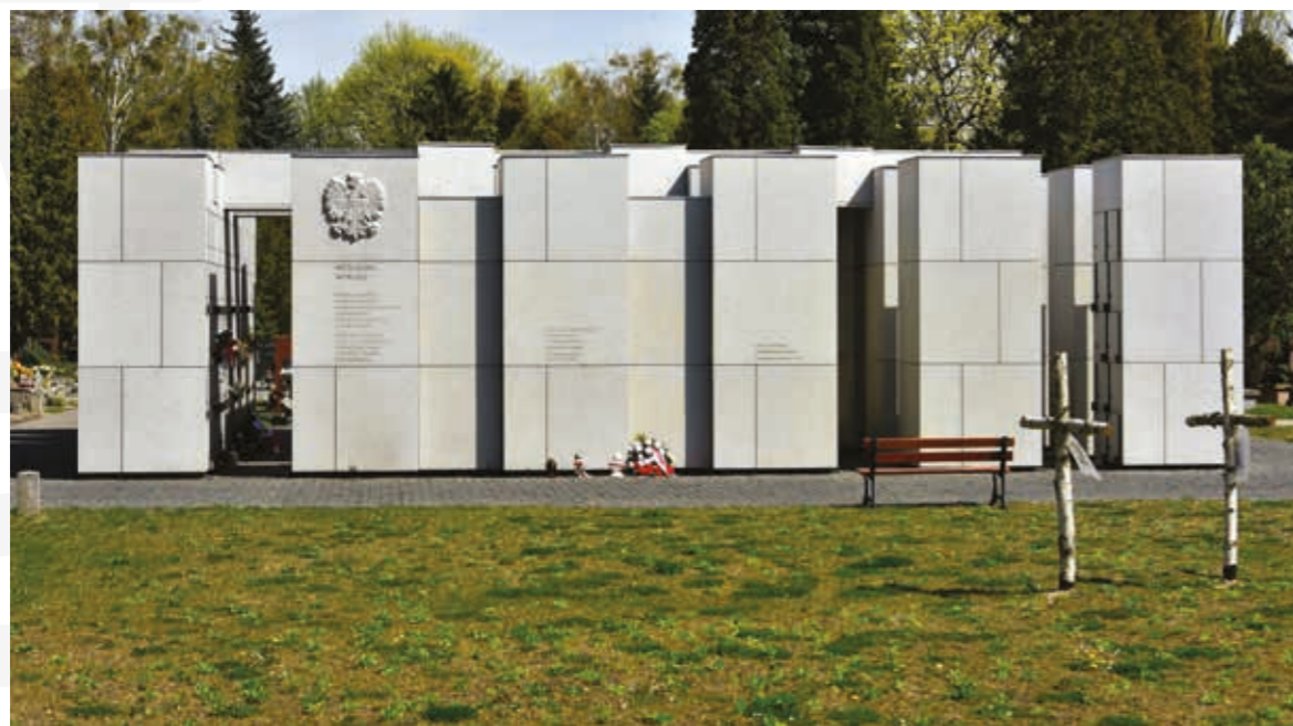
Panteon – Mauzoleum Wyklętych-Niezłomnych

Napisz pracę na temat: „Znając historię Żołnierzy Wyklętych, napisz, czy mógłbyś być jednym z nich? Uzasadnij swoją wypowiedź”.