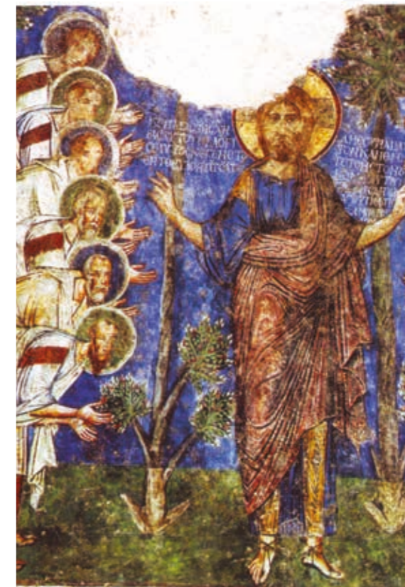
Fresk: Jezus nauczający Apostołów, ok. XII w., źródło: wikipedia.pl