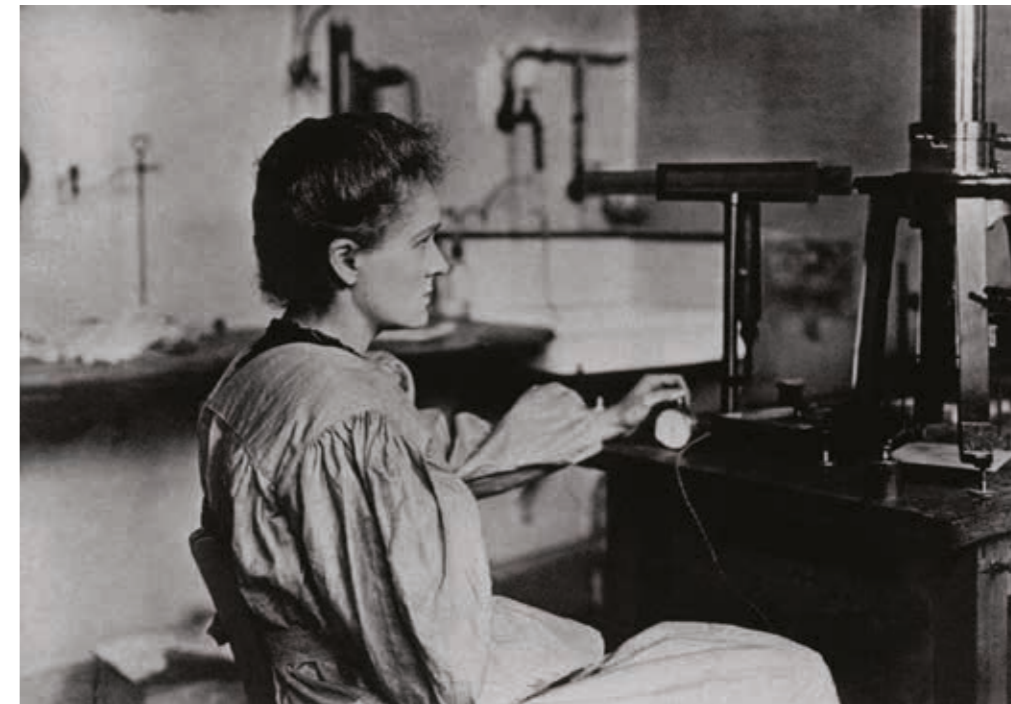
Maria Skłodowska-Curie w laboratorium