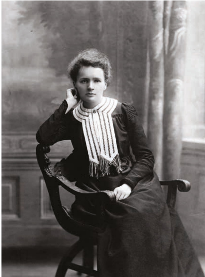
Maria Skłodowska-Curie w 1903 roku

Wreszcie nadszedł ten dzień. Gdy moja nauczycielka od chemii powiedziała klasie, że będziemy rozmawiać o układzie okresowym pierwiastków, od razu pomyślałam o radzie i polonie oraz o osobie, która je odkryła. Cieszyłam się jak dziecko czekające na Boże Narodzenie! Chciałam opowiedzieć swoim kolegom i koleżankom wszystko, co wiem na temat Marii Skłodowskiej-Curie. W tym momencie byłam tak szczęśliwa i wdzięczna mojej polskiej szkole i nauczycielom, że nauczyli mnie tak wiele o polskiej historii, kulturze i geografii, że chciałam skakać z radości. Nikt inny nie wiedział tyle co ja o noblistce! Chciałbym się tą wiedzą i radością podzielić z całym światem. Zawsze kiedy w rozmowach pojawia się temat Marii Skłodowskiej-Curie jestem dumny, ale nie tylko z niej, lecz także z faktu, że jestem Polakiem, a ona jest moją rodaczką. To wspaniale, że osiągnęła tak wiele w dziedzinie nauk ścisłych,