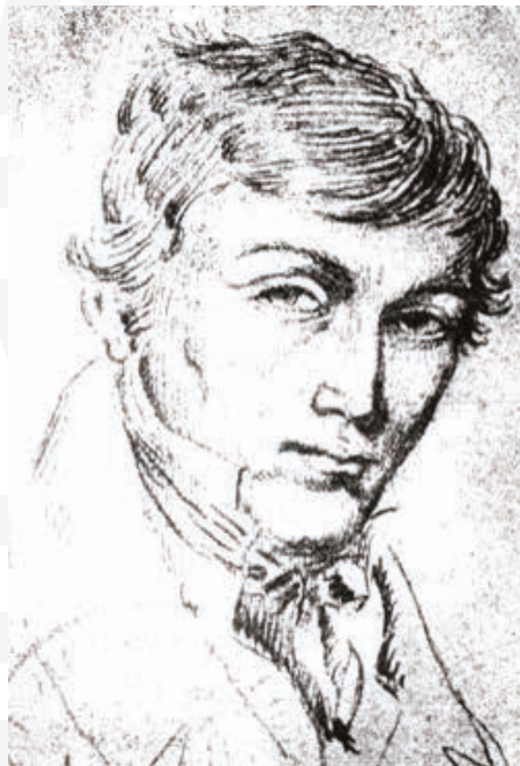
Portret Mickiewicza autorstwa Joachima Lelewela