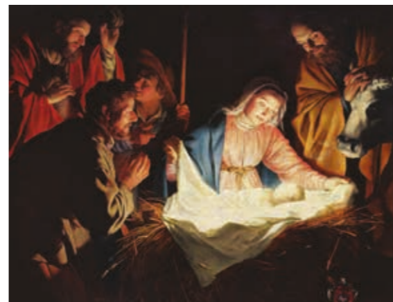
Gerrit van Honthorst, Pokłon pasterzy, 1621