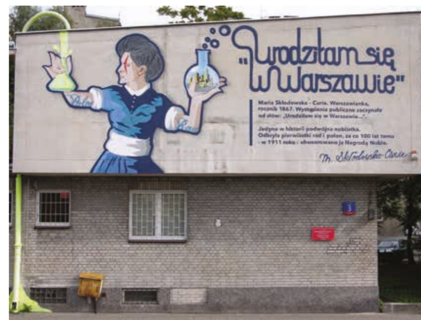
Mural Maria Skłodowska-Curie, Warszawa

Kiedy byłem małym chłopcem, zawsze oglądałem programy telewizyjne, w których poważni panowie w fartuchach robili bardzo zabawne rzeczy. Na początku myślałem, że są magikami. Dopiero kiedy poszedłem do szkoły, zrozumiałem, że to byli chemicy, którzy robili doświadczenia. Od tego momentu wiedziałem, kim chcę zostać. Chciałem być takim panem w białym fartuchu. Gdy w końcu nadszedł czas na naukę chemii, byłem bardzo podekscytowany. Tym bardziej że zanim zacząłem uczyć się chemii, usłyszałem o Marii Skłodowskiej-Curie w polskiej szkole. Byłem bardzo ciekawy, kiedy zaczniemy o niej mówić w amerykańskiej szkole.