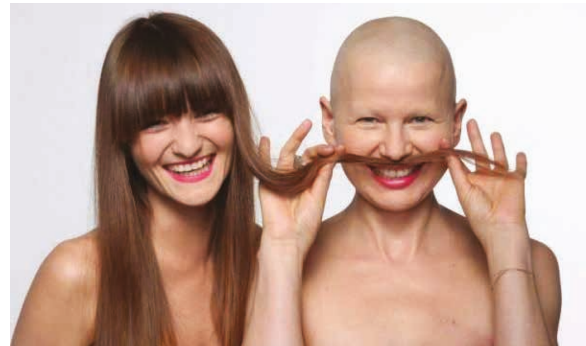
Grafika z plakatu promującego akcję "Daj włos!" Fundacji Rak'n'Roll Wygraj Życie