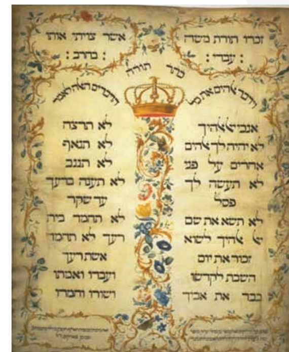
Pergamin z 1768 r. wykonany przez Jekuthiela Sofera wzorowany na Dekalogu z 1675 r. z Synagogi w Amsterdamie