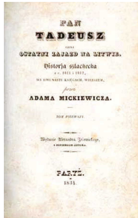
Pan Tadeusz, 1834, tom I, strona tytułowa