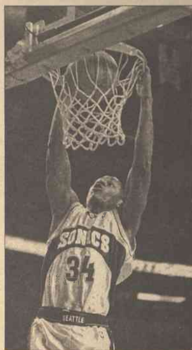
Po wyleczeniu kontuzji na parkiet powrócił koszykarz klubu "Seattle SuperSonics" Ray Allen, który w meczu ligi NBA z zespołem "Minnesota Timberwolves" spisywał się bardzo dobrze i niejednokrotnie popisywał się efektywnymi wsadami.

Drużyna Cezarego Trybańskiego — Phoenix Suns podejmowała w America West Arena ekipę Philadelphia 76ers. W obecności 17 tys. widzów "Słońca" zwyciężyły 100:92, a sukces zawdzięczają Joe Johnsonowi. Trybański znalazł się wprawdzie w składzie Suns, ale nie wybiegł na parkiet. Johnson był w niedzielę w rewelacyjnej formie. Pobił swój rekord sezonu z dorobkiem 23 pkt, w kluczowym momencie czwartej