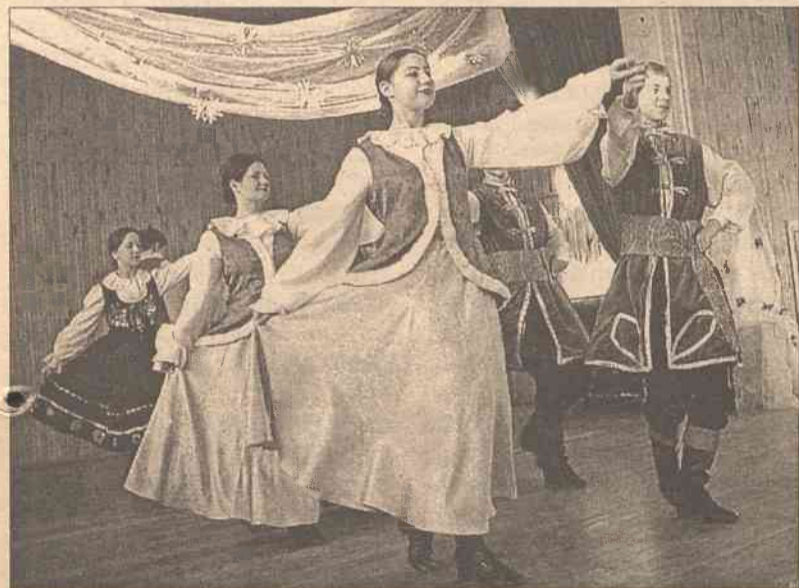
Spotkania zespołu „Kotwica” z kowieńską publicznością stały się tradycją

28 grudnia polski zespół folklorystyczny „Kotwica” zaprosił wszystkich swoich sympatyków i przyjaciół na świąteczny koncert bożonarodzeniowy. Spotkania zespołu „Kotwica” z kowieńską publicznością w okresie Świąt Bożego Narodzenia już stały się tradycją i są zawsze bardzo oczekiwane przez polską społeczność kowieńską.