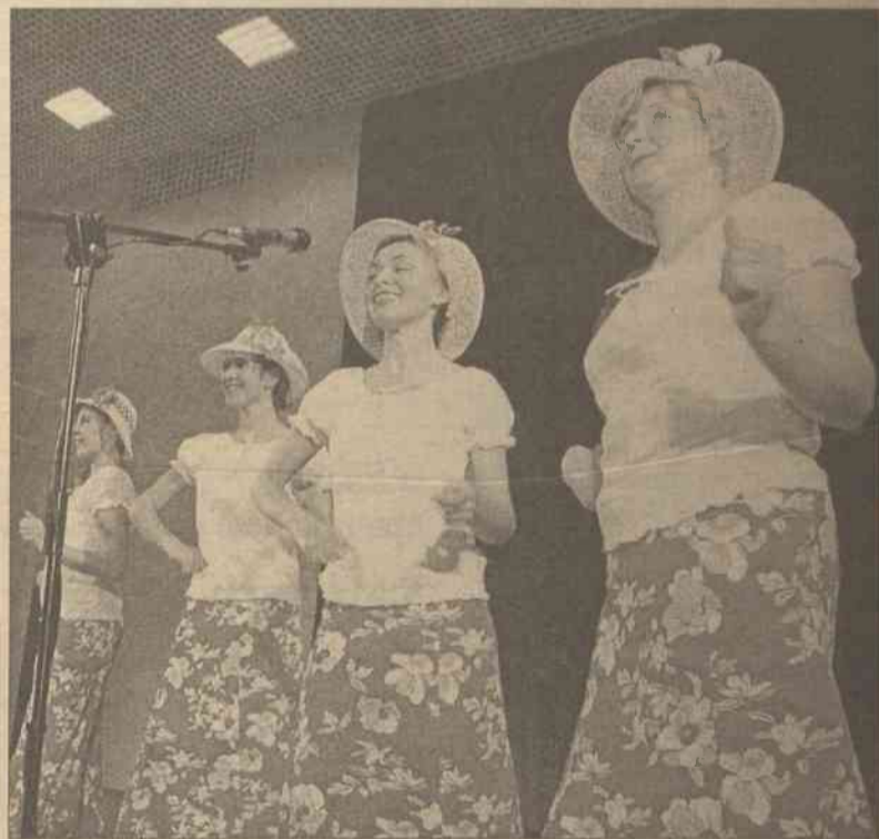
Serca zebranych swym pięknym, wesołym śpiewem rozgrzewały dziewczęta z zespołu „Melodia”

Za kilka lat na stołecznym placu Łukiskim powstanie Pomnik Wolności