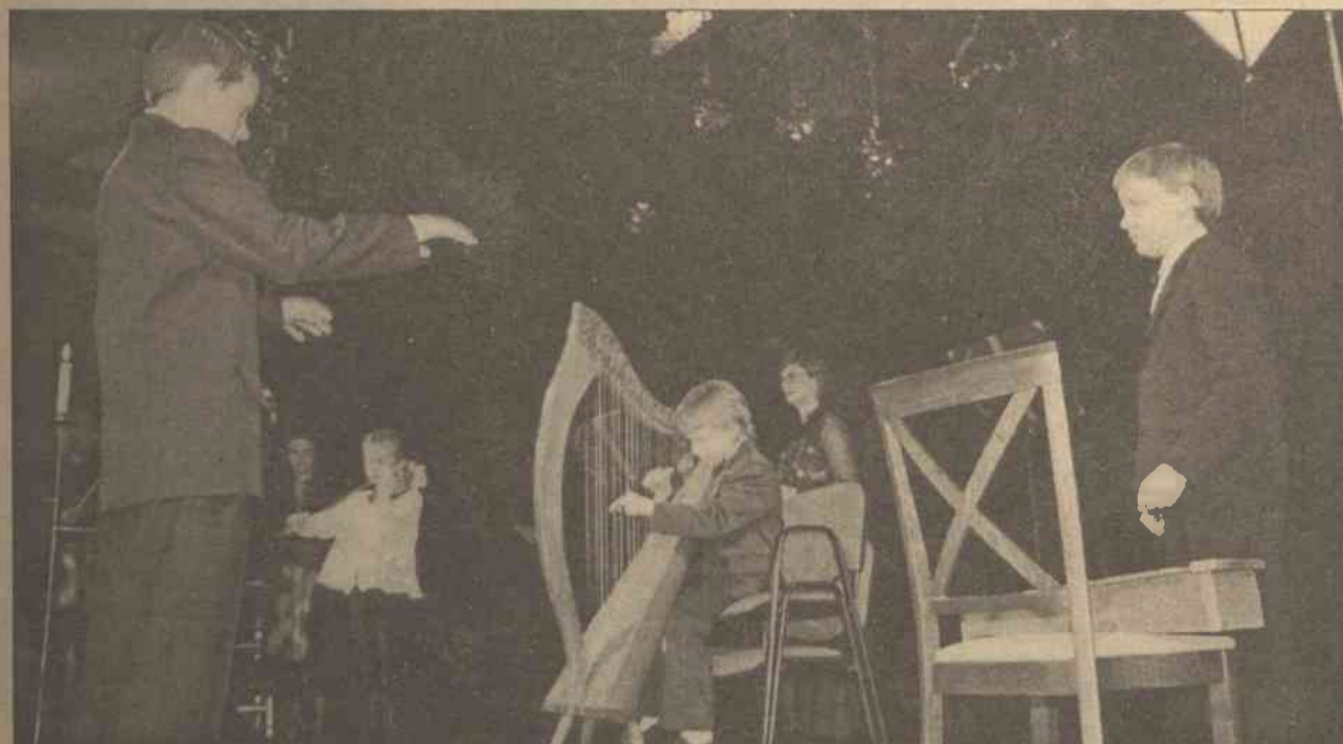
Razem ze stałym składem Wileńskiej Orkiestry Kameralnej wystąpili także małe polskie „gwiazdki”