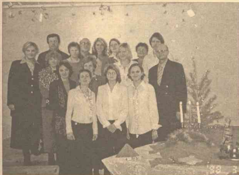
W murach uniwersyteckich odbył się wspólny opłatek dla kadry Wydziału Sławistycznego, wykładowców i studentów Polonistyki

Pierwsza część wieczoru była poświęcona pięknej tradycji śpiewania koled. Odświeżone tradycyjne i współczesne koledy dodały wieczorowi uroku i były początkiem świątecznych emocji.