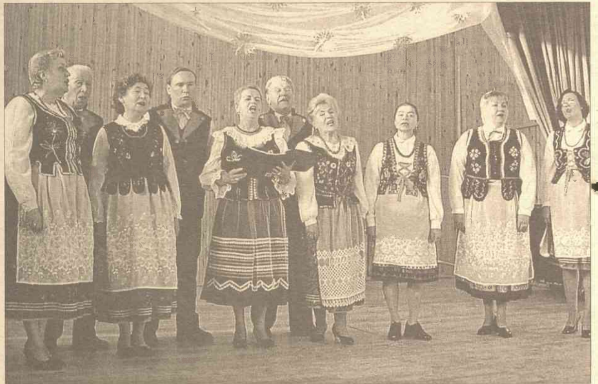
W pierwszej części zespół wykonał wiązankę najpiękniejszych kolęd polskich