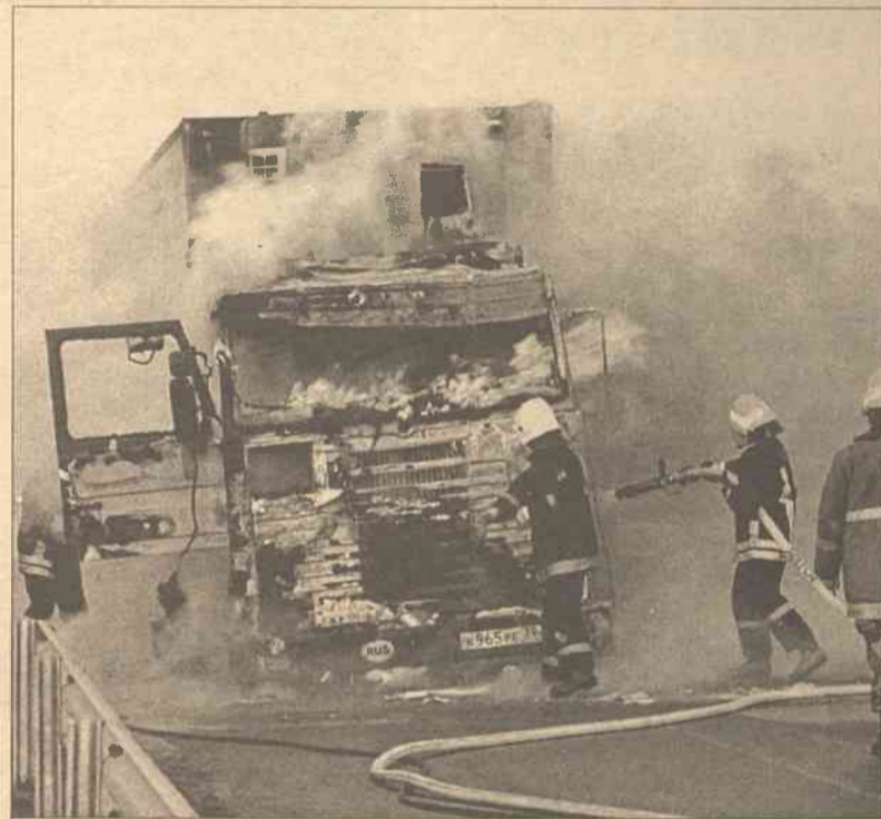
W sobotę przed południem na szosie Wilkomierskiej niedaleko Wilna spłonęła ciężarówka. Samochód wiozł ładunek pieczarek do obwodu kaliningradzkiego. Jak twierdzą funkcjonariusze, pożar mogła wywołać pęknięta opona. W wypadku kierowca złamał rękę, więc nie był w stanie zagasić iskiei, które szybko przerzuciły się na silnik samochodu, a następnie zapłonęła cała ciężarówka. Dopiero przybyłe na miejsce ekipy strażackie zagasiły ogień. Kierowca znalazł się w szpitalu.