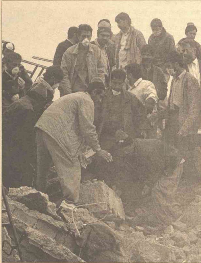
Spod gruzów wydobyto i pochowano już 25 tysięcy ciał ofiar

Wojska amerykańskie schwytały Saddama 13 grudnia koło Tikritu. Były dyktator ukrywał się w podziemnym schowku w jednym z gospodarstw wiejskich nad rzeką Tygrys. "Saddam podał nazwiska osób, którym powierzył pieniądze, podał też nazwiska ludzi znających miejsca ukrycia sprzętu i broni" — powiedział Alawi, członek kierownictwa Rady Zarządzającej. "Rada Zarządzająca