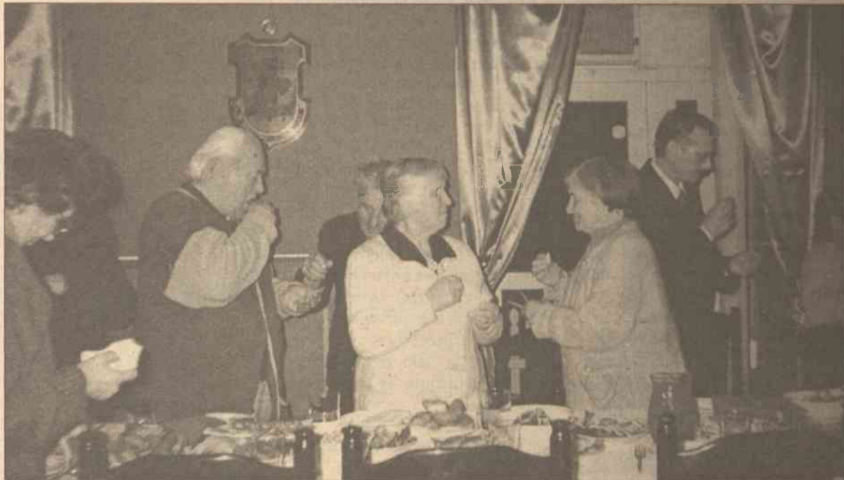
Łamanie się opłatkiem w kawiarni „Alina”