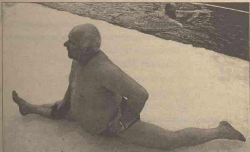
Ten nie pierwszej młodości mieszkaniec Moskwy przedtem niż zanurzyć się w lodowatej wodzie, gdzie już pływał jego przyjaciel, po rozgrzewce szybko i sprawnie wykonał szpagat

Michael Jackson został aresztowany 20 listopada pod zarzutem wykorzystywania seksualnego dzieci. Zwolniono go za kaucją w wysokości 3 mln dolarów. W połowie grudnia prokuratura formalnie oskarżyła go o molestowanie 12-letniego chłopca. (PAP)