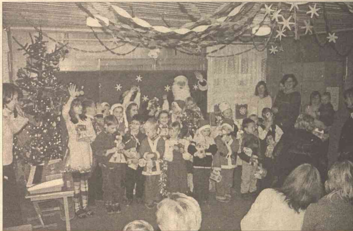
Każda klasa przygotowała swój świąteczny program, który wykonała z werwą i zapałem

Odwiedziliśmy szkołę 26 grudnia — za chwilę rozpoczyna się tu uroczystości bożonarodzeniowe. Podekscytowane maluchy poprawiają skromne stroje karnawałowe i z przejęciem słuchają ostatnich rad swych pań. Za chwilę zerówka — pięciu uroczych maluchów — rozpoczynają występy. Nie brakuje wesołych piosenek, tańców, wierszy. Każda klasa przygotowała swój świąteczny program. Przedstawienie szkolnego teatru kukielkowego o Zajączku Szaraczku szczególnie interesuje młodsze rodzeństwo dzisiejszych uczniów, które po kilku latach przyjdzie do