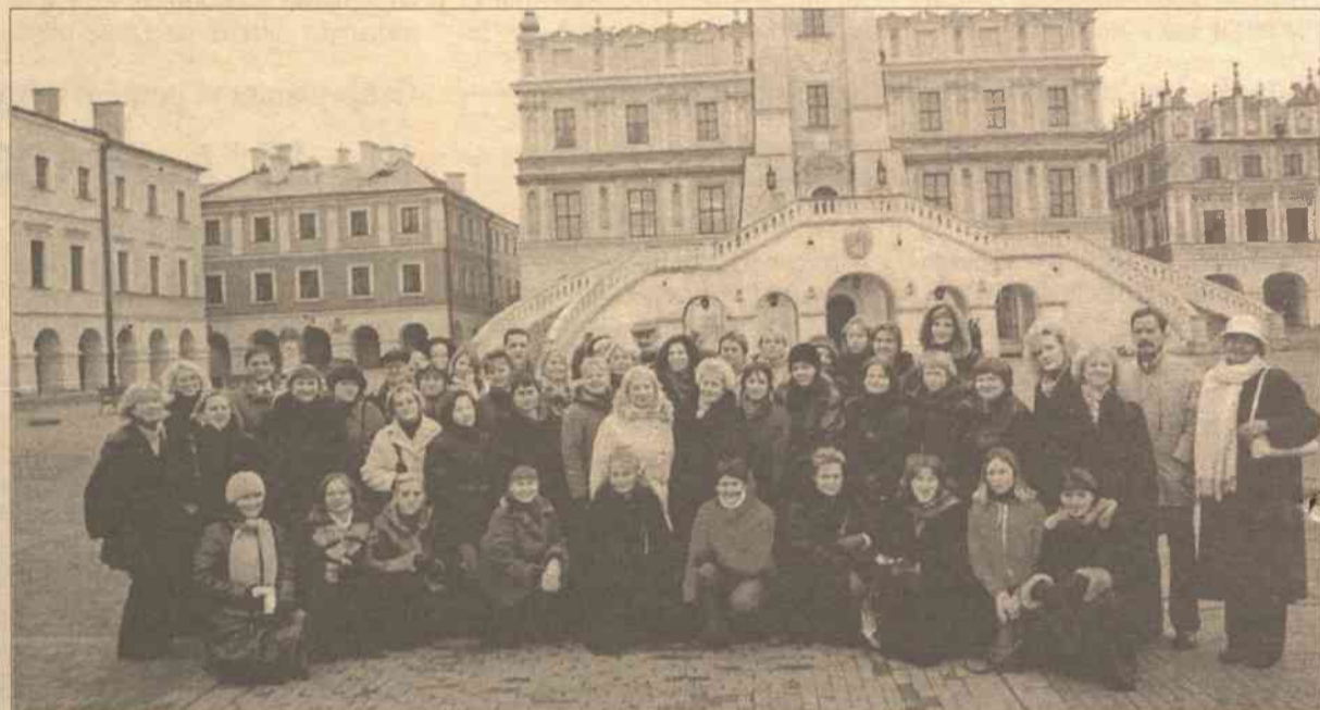
Grupa uczestników kursu w Zamościu

Osoby prowadzące szkolenia to bardzo kompetentni pedagodzy