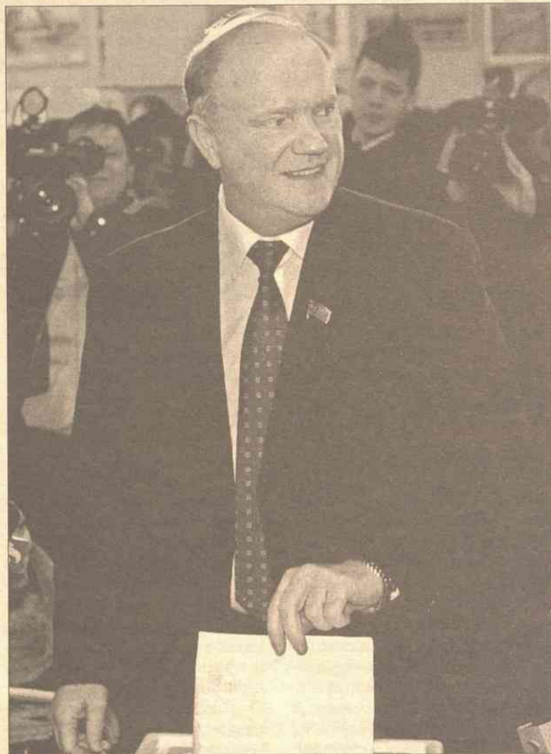
Według Ziuganowa, fałszerstwo ze strony władz polegało na dorzuceniu do urn w całym kraju 3,5 mln głosów oddanych na Jedną Rosję.

Rada Zarządzająca rozważa też możliwość utworzenia jednostki milicji antysaddamowskiej w sile 750-850 ludzi, której członkowie rekrutowaliby się głównie spośród szyitów i Kurdów.