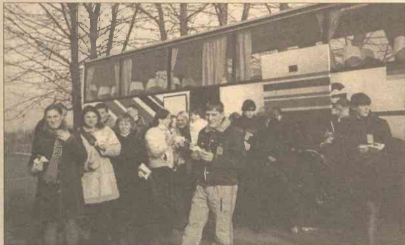
Projekt „Częstochowa-Soleczniki: nić partnerskich szkół” jest realizowany poprzez wizyty studyjne, szkolenia, wycieczki

W imieniu uczestników kursu pragnę podziękować kierownikowi