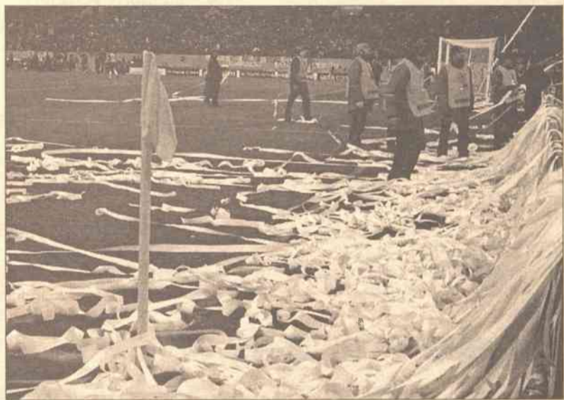
Besiktas Sztambuł przegrał z Chelsea Londyn 0:2. Na początku drugiej połowy tureccy fani zaprezentowali przeciwko przeniesieniu meczu do Niemiec zarzucając boisko serpentynami i konfetti