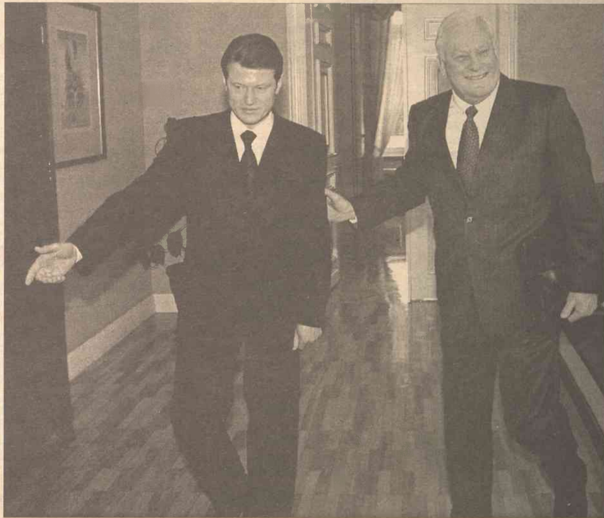
Wczorajsze spotkanie prezydenta Litwy Rolandas Paksasa z premierem rządu Algirdasem Brazauskasem nie przyniosło rozwiązania trwającego już drugi miesiąc ostrego kryzysu politycznego w naszym kraju

Autorzy projektu twierdzą, że każdy fakt rażąco złamania Konstytucji jest złamaniem prezydenc-