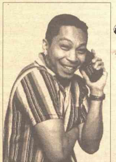
Kobiety patrzają na nowe technologie przez pryzmat ich funkcjonalności, mężczyźni mają do urządzeń elektronicznych bardziej emocjonalne podejście

W klasyfikacji "najbardziej optymistycznie nastawionych do 3G grup" pierwsze miejsca przypa-