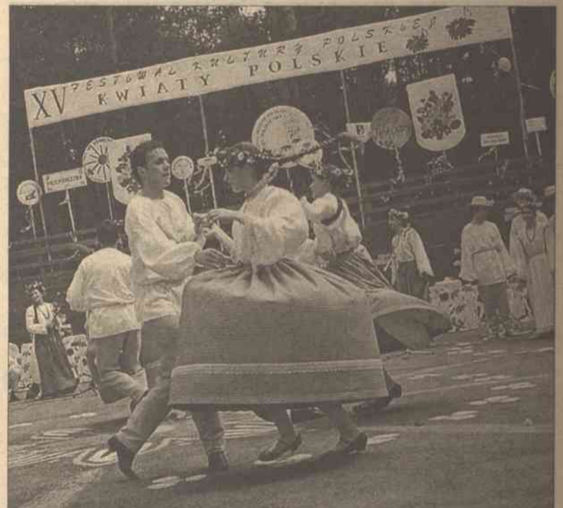
W maju 2004 r. odbędzie się XVI Międzynarodowy Festiwal Kultury Polskiej „Kwiaty Polskie”. Od 15 lat festiwal gromadzi najlepsze zespoły polskie i polonijne z całej Litwy, Polski oraz innych krajów (ostatnio nawet z Australii). Naturalnie, że tak masowa impreza wymaga jak najlepszego przygotowania. Dlatego też komitet organizacyjny zaprasza wszystkich zainteresowanych tą imprezą na zebranie organizacyjne, które się odbędzie w niedzielę, 14 grudnia, o godz. 12.00 w lokalu Szkoły im. J. Lelewela (ul. Antakalnio 33, pokój 49)

Na zwycięzców czekają książki o historii polskiego dziennika na Litwie — „Kronika na gorąco pisana”.