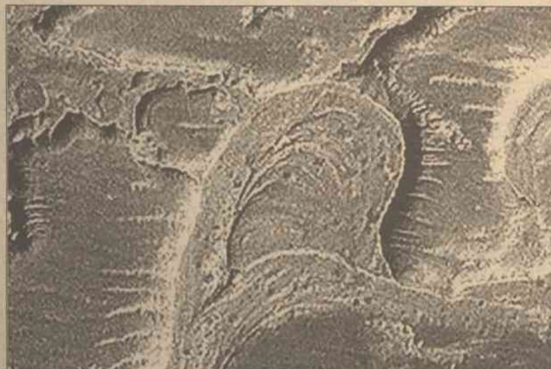
Na Marsie płynęły niegdyś prawdziwe rzeki. Pozostały po nich doliny z zakolami i starorzeczami. Wszystko to widać na zdjęciach przesłanych przez sondę Mars Global Surveyor (MGS), która od września 1997 roku dostarczała ich już 155 tys. Na tym u góry widoczny jest fragment powierzchni Marsa o rozmiarach 14 na 19 km. Fotografia przedstawia deltę dawnej rzeki, która miliardy lat temu wpadała do krateru Holden. Powstanie takich form wymaga czasu, i to długiego. Aby utworzyło się starorzecze, rzeka musi najpierw wciąć się w swoje podłoże, następnie stopniowo zwiększać zakola, a gdy ich początek i koniec zbliżą się do siebie, przerwać rozdzielającą je łacę. Zdjęcia sugerują istnienie na Marsie większych zbiorników wód stojących, być może — prawdziwych mórz

Rzecznik prasowy ADS Matthew Cossolotto testuje już promowaną przez firmę technologię VeriChip — ma on wszyty chip RFID. ADS prowadzi obecnie akcję promocyjną swego systemu. Pierwsze 100 tysięcy Amerykanów, którzy zgodzą się na wszycie chipa, zapłaci za operację o 50 dolarów mniej.