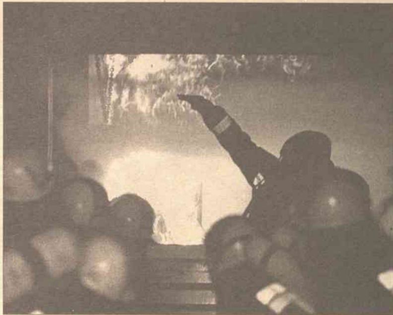
W ciągu roku strażacy mieli 180 wezwań, co kosztowało około 45 tys. Lt

O reorganizacji wiadano już zawczasu i strażacy zdobywają kwalifikacje kierowców. Kto nie może z jakiegoś powodu zrobić tego, odchodzi ze straży ogniowej. W ten sposób odnawia się skład osobowy, doskonalą się jego kwalifikację. Jednocześnie zmniejsza się liczebność składu. O ile poprzednio starszy strażak ekipy był zwol-