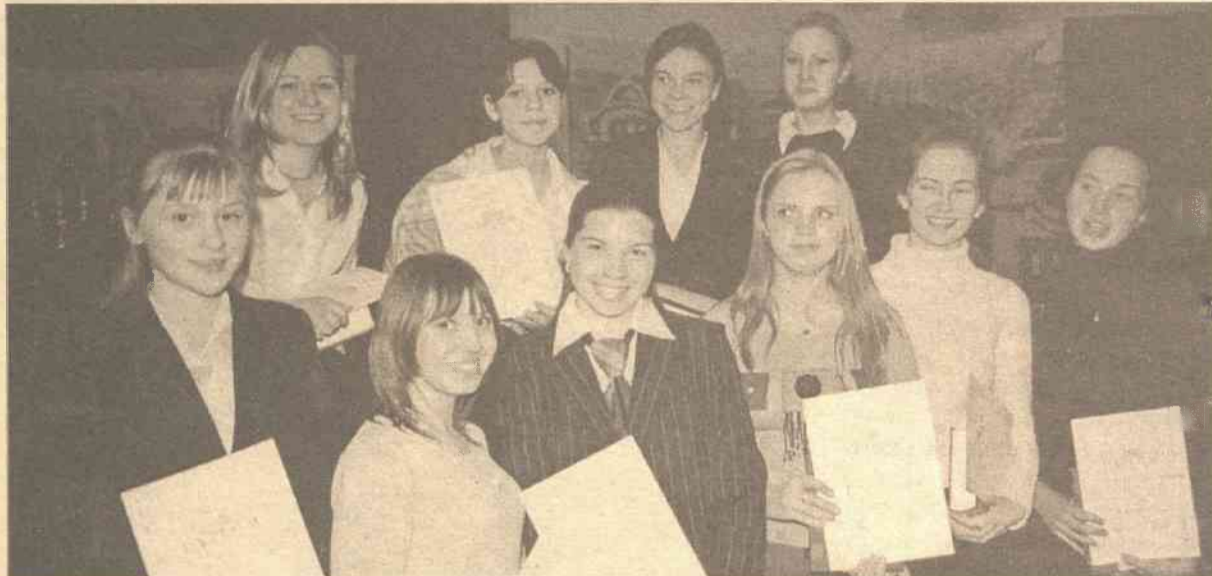
Gratulujemy wspaniałych sukcesów zwycięzcom