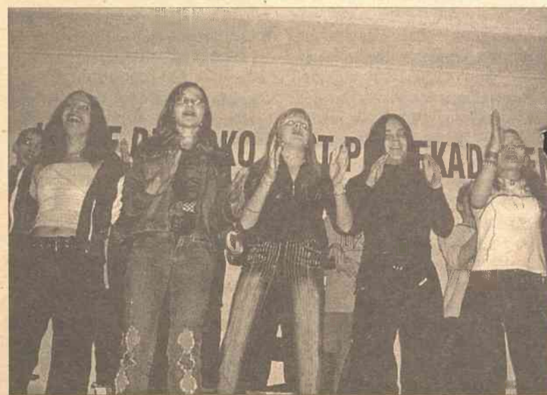
Zostały też zaprezentowane wcześniej przygotowane programy artystyczne