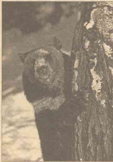
Amerykańskie czarne niedźwiedzie coraz częściej porzucają lasy przenosząc się w rejony zurbanizowane

Autorzy badań sugerują, iż — w miarę jak ludzie zajmują rejony dzikie, a niedźwiedzie wkraczają w rejony zurbanizowane — ludzie muszą się nauczyć minimalizować