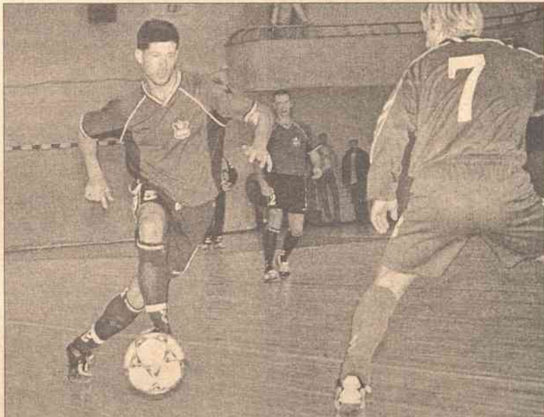
W niedzielę piłkarze „Bekentasu” swoim kibicom zaprezentowali futbolowy fajerwerk — strzelili aż 14 bramek

W Wilnie i Możejkach odbyła się druga kolejka krajowych mistrzostw w minifutbolu.