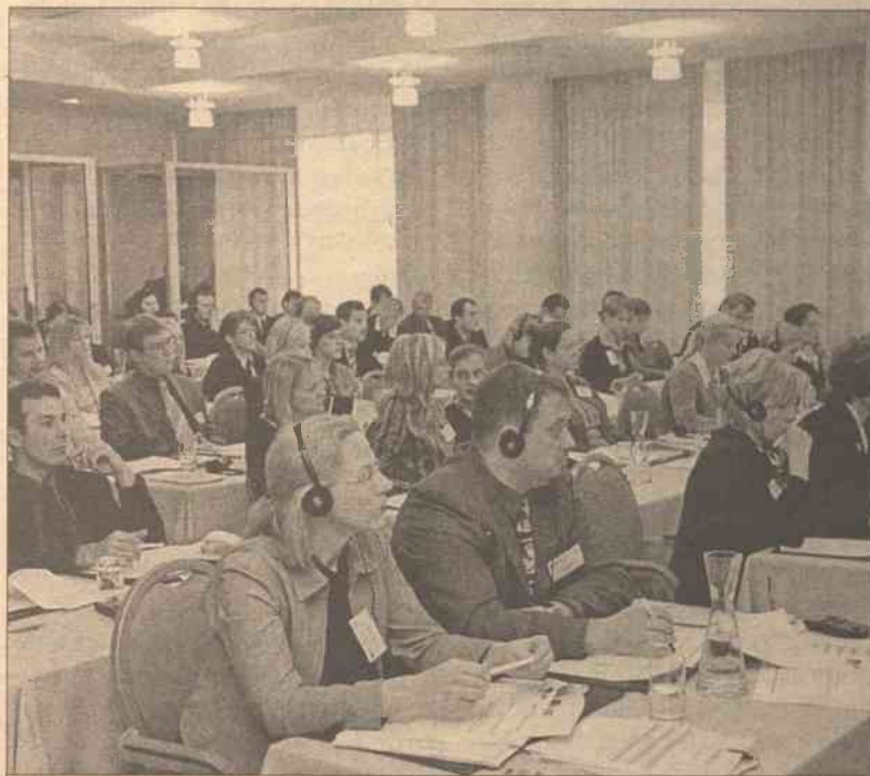
Wczoraj w Wilnie rozpoczęło się pierwsze seminarium służby dochodzeniowej ds. przestępstw finansowych i europejskiej służby do zwalczania korupcji, poświęcone walce z przestępstwami w sferze finansowej w krajach Unii Europejskiej. To jest pierwsze i największe z 20 seminariów, jakie będą zorganizowane przy pomocy programu PHARE dla urzędników państwowych z krajów bałtyckich. W dwudniowym wileńskim seminarium bierze udział ponad 100 urzędników z Litwy, Łotwy, Estonii i krajów UE.