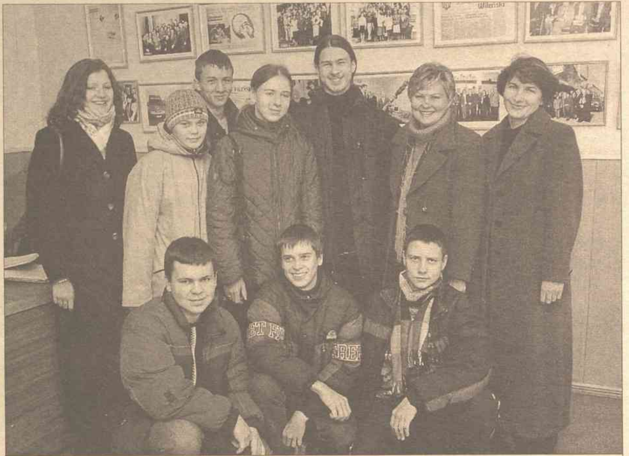
Codzienne życie redakcji „Kuriera Wileńskiego” interesuje wielu uczniów. I częstokroć przyjeżdżają do redakcji, aby naocznie przekonać się o pracy dziennikarzy.