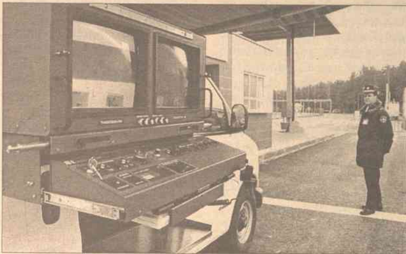
Na elektroniczny system tranzytu ze środków PHARE przeznaczono 3,7 mln. Lt.

Prócz tego, od 1 maja roku przyszłego zacznie działać elektroniczny system tranzytu, który