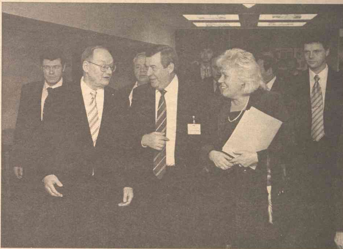
Stronę litewską interesuje, czy Litwie uda się powstrzymać plany rosyjskiego „Lukoilu” wydobywania ropy na Morzu Bałtyckim

Wątpliwe jednak, czy wileńskie spotkania Selezniowa załagodzą napięcie powstałe w wyniku rosyjskich planów wydobywania ropy naftowej w bezpośredniej bliskości z Mierzeja Kurońska, tzw. projektu pod kryptonimem D6 oraz spowodowane oporem Moskwy wobec podpisania na partnerskich zasadach projektu transportowego określanego kryptonimem K2. Tym bardziej tematem rozmów Selezniowa, przynajmniej oficjalnie, nie będzie sytuacja wokół losu rosyjskiego miliardera oraz kierowanej przez niego firmy „Yukos”. Już podczas okazjonalnych briefingów marszałek rosyjskiego parlamentu dał do zrozumienia, że nie zamierza rozwodzić się w Wilnie nad Iosem Chodorkowskiego. Powiedział tylko, że jest zbyt wcześnie, żeby podejmować jakieś wnioski albo robić wywody. Dodaje jednak, że po szerszej informacji, jakiej spodziewa się w toku śledztwa, można będzie wnioskować „kto za tym stoi”. Selezniow pośrednio zasugerował,