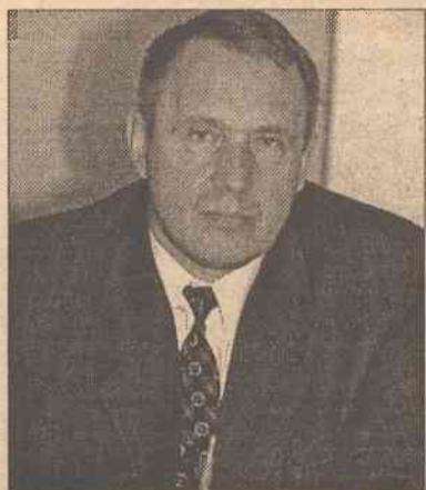
Liaudanskas zaznaczył, że nie ma do ministra pretensji w związku z taką decyzją

Znany z dwuznacznych oświadczeń politycznych Liaudanskas na stanowisko przewodniczącego Głównej Ko-