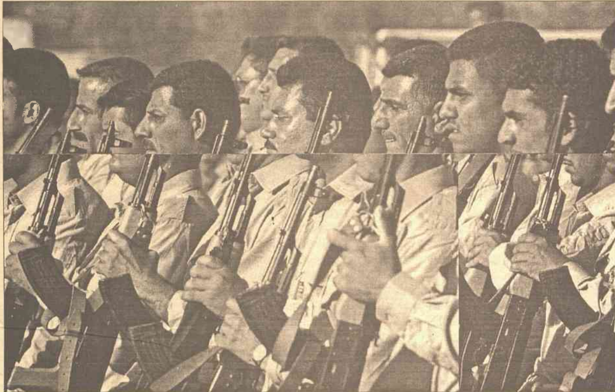
Policję irakijską stanowią miejscowi mieszkańcy. Demonstranci twierdzili, iż jeszcze w lipcu obiecano im pracę w policji, ale zobowiązania tego nie dotrzymano

„Pomimo że wszyscy znają jego silny i niezależny charakter, Wojtyła jest posłusznym pacjentem, który stosuje się do zaleceń lekarzy przynajmniej w tym, co dotyczy kuracji i lekarstw. Nie słucha nato-