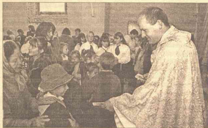
Dobry kontakt księży z dziećmi jest podstawą życia religijnego nie tylko parafii, ale i społeczeństwa

Cały czas zastanawiam się, jaki cel miał ten artykuł? Zachęcić dzieci do uczestnictwa w lekcjach etyki,