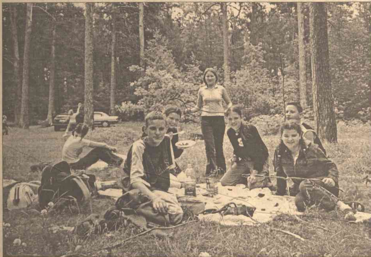
Na biwaku zawsze dobrze