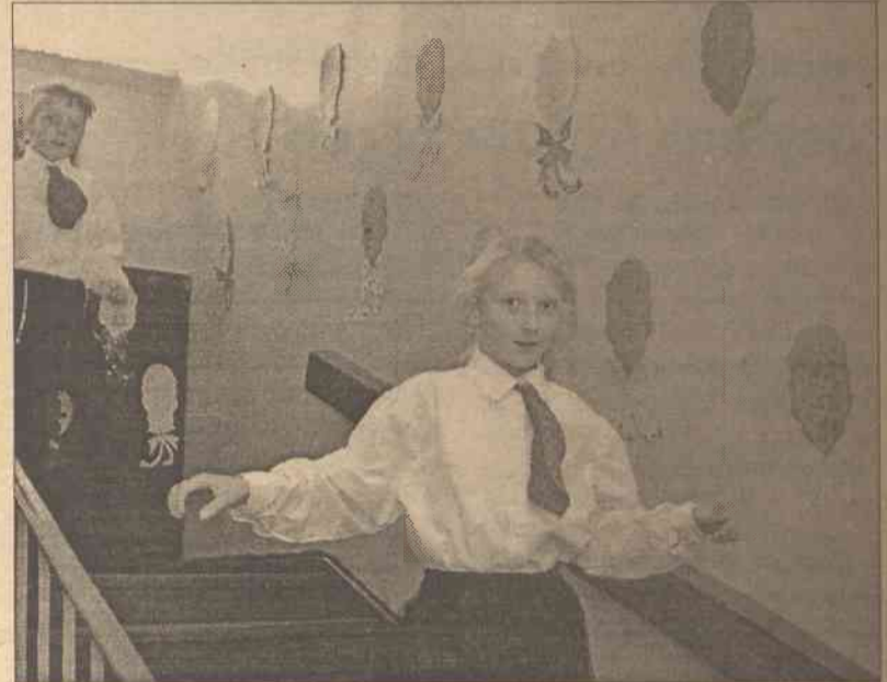
Korytarze tej szkolki są uwieszone marzeniami dzieci