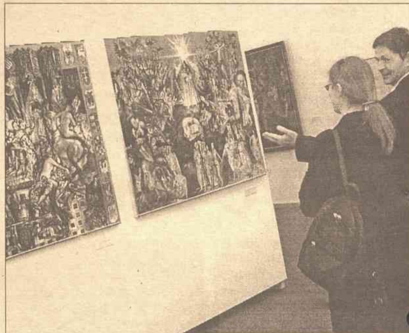
Historia inaczej, czyli szkice obrazu historycznego do obejrzenia w Muzeum Narodowym

Dlatego też każdy, kto obejrzy np. planszę władców, książąt, ludzi, którzy przyczynili się do historii kraju, będzie miał niezapomnianą lekcję historii. Przewija się tu sporo polskich nazwisk —