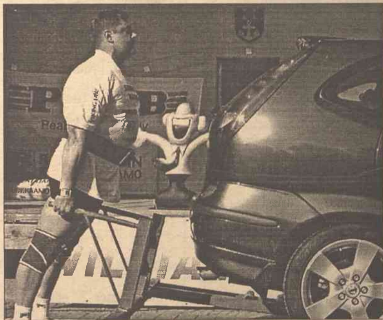
Wicemistrzem świata Savickas został po raz drugi z rzędu

Po drugie — zgromadził najwięcej punktów w historii. Dotychczas rekord należał do legendarnego Youko Aholi. Fin wygrał