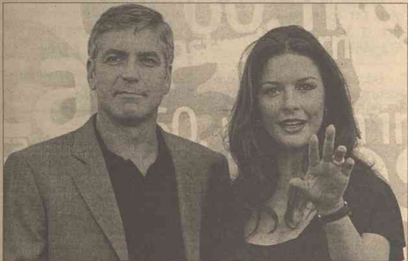
Clooney i Zeta-Jones podczas konferencji w Wenecji