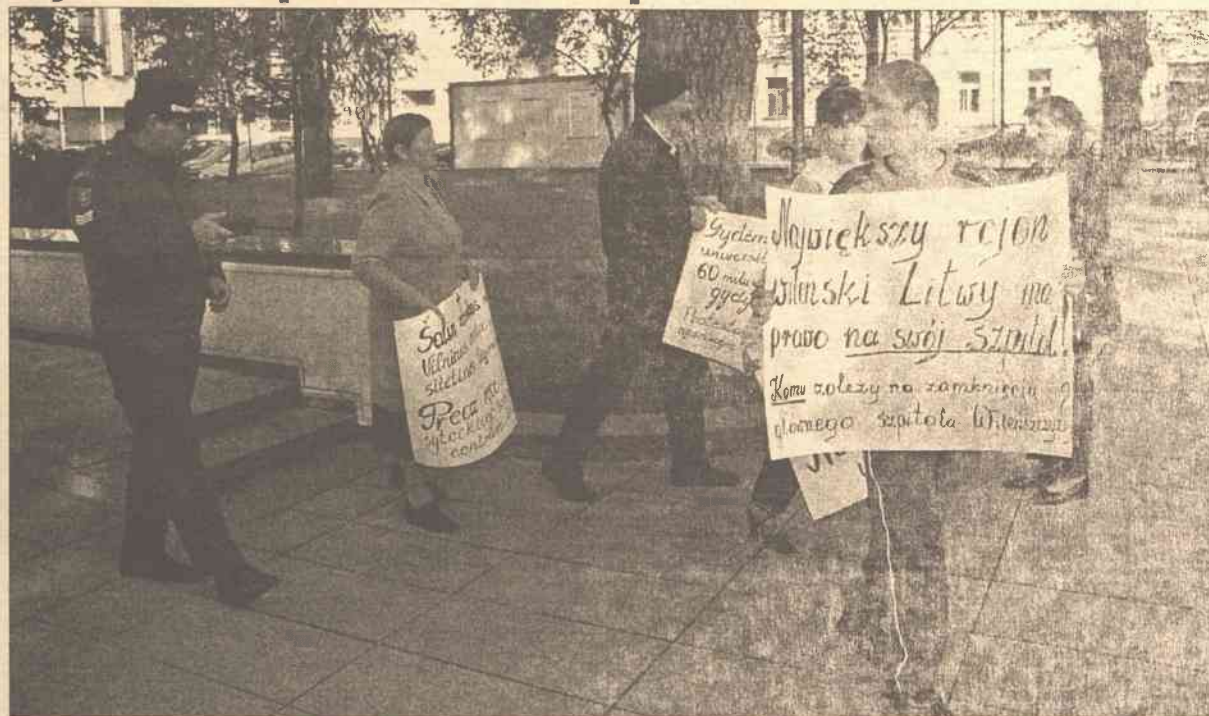
Policjant grzecznie, ale stanowczo „ustawił” protestujących na większą od rządu odległość.