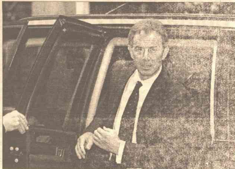
Blair odmówił odpowiedzi na pytania dziennikarzy o toczące się śledztwo

Na podstawie doniesień PAP stronę przygotował Paweł Kobak