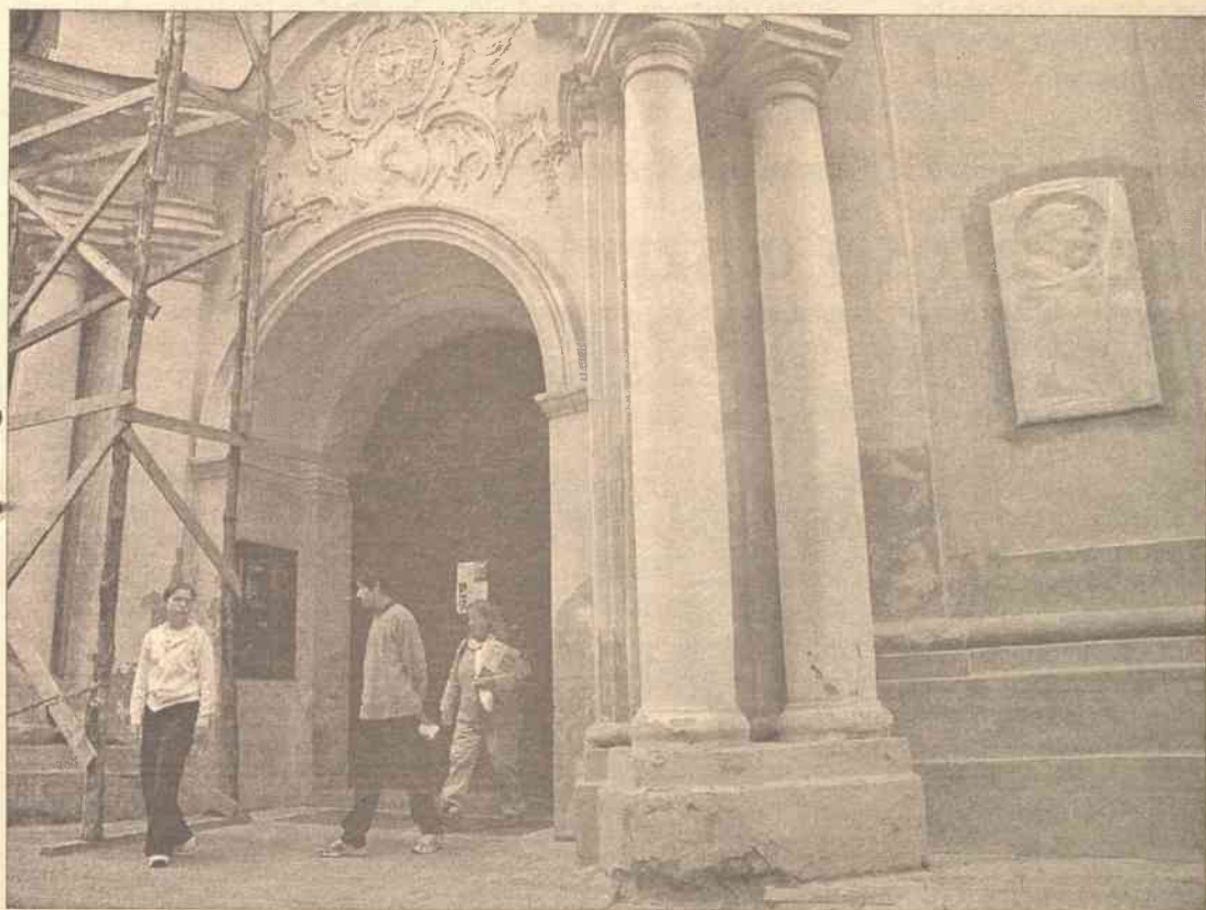
Dzisiaj zostanie odsłonięta i poświęcona pamiątkowa tablica na fasadzie wileńskiego kościoła pw. Ducha Świętego, w którym modlił się przed dziesięciu laty nasz wielki Rodak

Dzisiaj my, litewscy Polacy, jak to przed dziesięciu laty tak po raz pierwszy nazwał nas goszczący w Wilnie papież Jan Paweł II, mamy swoje małe święto. O godz. 14.00 zostanie odsłonięta i poświęcona pamiątkowa tablica na fasadzie wileńskiego kościoła pw. Ducha Świętego, w którym modlił się nasz wielki Rodak.