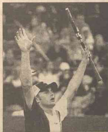
Przed przyjazdem do Nowego Jorku Andy Roddick triumfował w zawodach z cyklu Masters Series w Mont-realu i Cincinnati

14 września (niedziela) — mecz o trzecie miejsce (18.00) i finał (21.00).