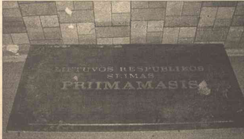
Sejmowy szyld, który był przymocowany przy wejściu do parlamentu od strony biblioteki narodowej im. M. Mażydasa, znaleziono w krzakach nieopodal punktu skupienia kolorowych przy ul. Żirnių w Wilnie

twą, którzy między innymi całodobowo strzegą gmachu parlamentu, natychmiast zawiadomili policję. Jak twierdzą funkcjonariusze policji kryminalnej, zapoznanie się z materiałem, jaki zarejestrowały kamery wideo obserwujące wszystkie wejścia do Sejmu, nie dało praktycznie żadnych wyników. Do akcji ruszyli pracownicy służb ope-