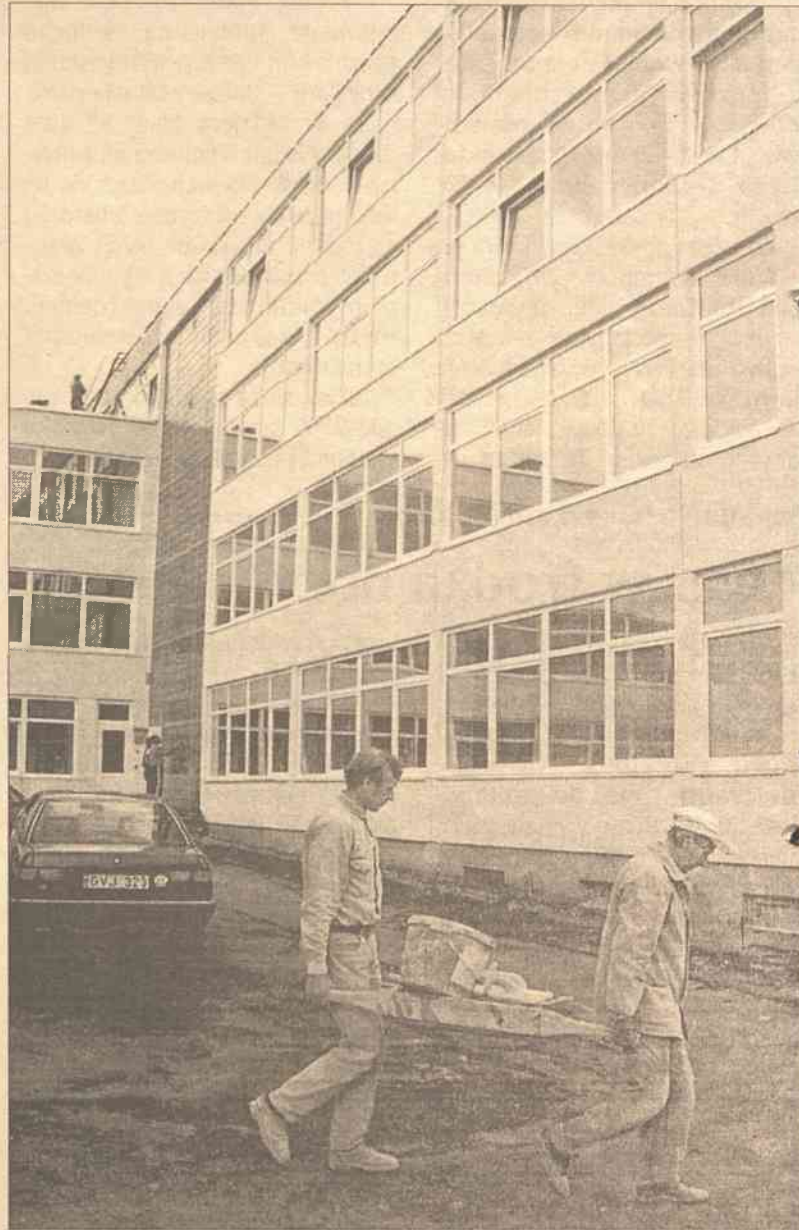
To już ostatnie prace remontowe przed początkiem roku szkolnego. Niestety, w tym roku prace te będą opóźnione

Niżej demograficzny na Litwie zauważany od kilku lat najpraw-