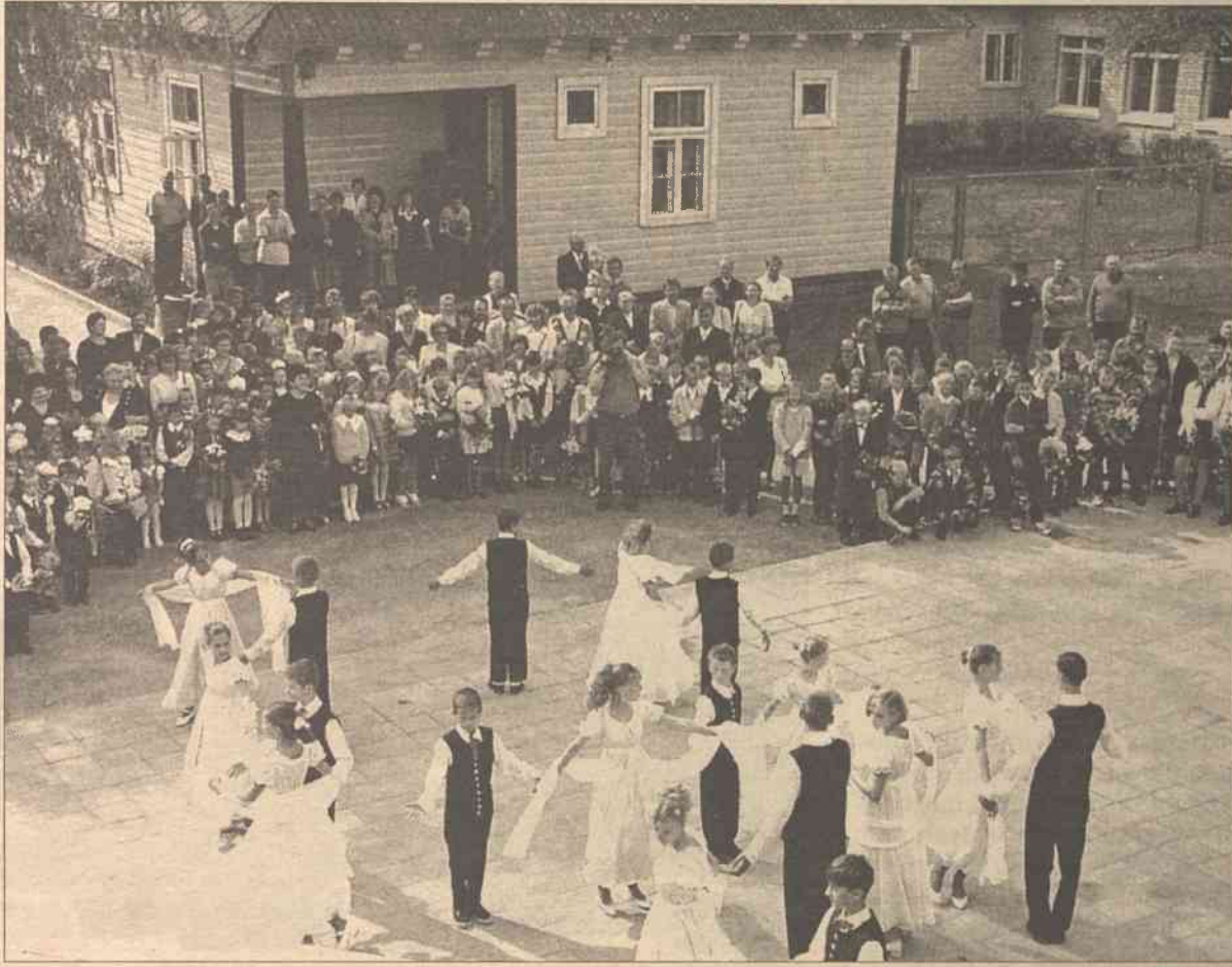
1 września jest świętem dla uczniów, ich rodziców oraz początkiem pracowitego roku dla nauczycieli. A gdy do użytku przekazuje się nową przybudówkę — jest to święto całej wsi, jak było przed laty w Ławaryszkach

żono u nas ten bolący problem. Na wysypisku w Karociszkach aż roi się od dzieciaków, które wyszukują coś do zjedzenia albo do sprzedania. Nie ukrywają, że muszą przecieć z czegoś żyć, a gigantyczny śmietnik jest dla nich jedynym