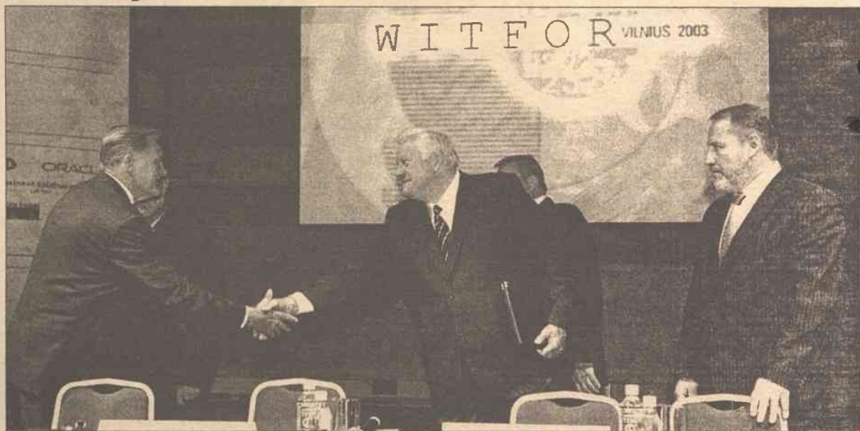
Forum WITFOR — Vilnius 2003 zorganizował rząd Litwy wspólnie z Międzynarodową Federacją Opracowania Informacji (IFIP)