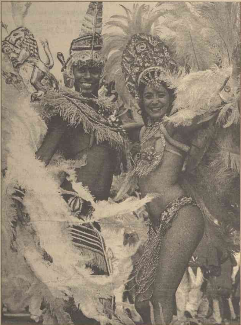
Tancerze ze szkoły tańca "Paraiso dos Orixas" w Rio de Janeiro biorą udział w kostiumowym festiwalu w ekskluzywniej londyńskiej dzielnicy Nothing Hill. Na 38 największy w Europie karnawał uliczny zjechało 1 milion widzów z całego świata.