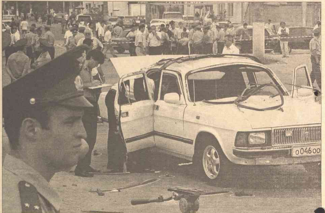
Samochód ministra eksplodował w czasie jazdy ulicami stolicy Dagestanu