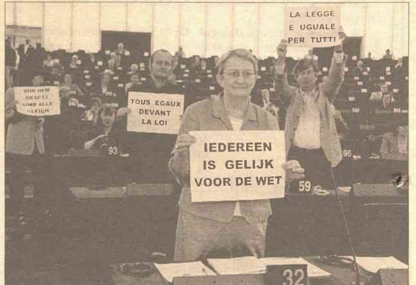
Niektórzy deputowani Europarlamentu otwarcie protestują przeciwko premierowi Włoch Silvio Berlusconi

Prasa poświęciła także wiele miejsca konfliktowi interesów Berlusconi, który jako premier Włoch jest równocześnie najbogatszym włoskim przedsiębiorcą, właścicielem sieci prywatnej telewizji (Mediaset) i dużego wydawnictwa (Mondadori), a także posiadaczem udziałów w wielu in-