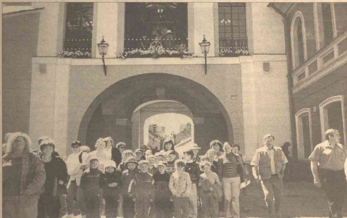
U stóp tej, co w Ostrej Bramie

Szkoła Średnia im. bł. Urszuli Ledóchowskiej wygrała projekt na letnie wakacje uczniowskie "W krainie czarów", sfinansowany przez samorząd rejonu wileńskiego.