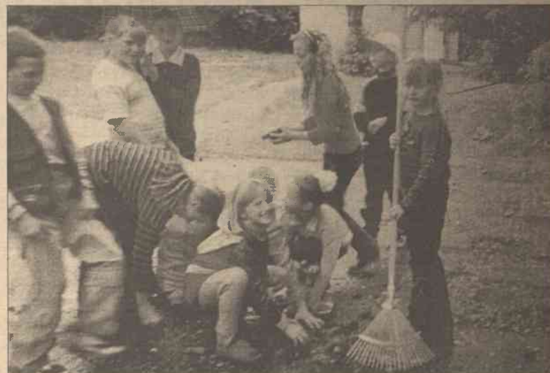
Na obozie sprzataliśmy też podwórko szkolne