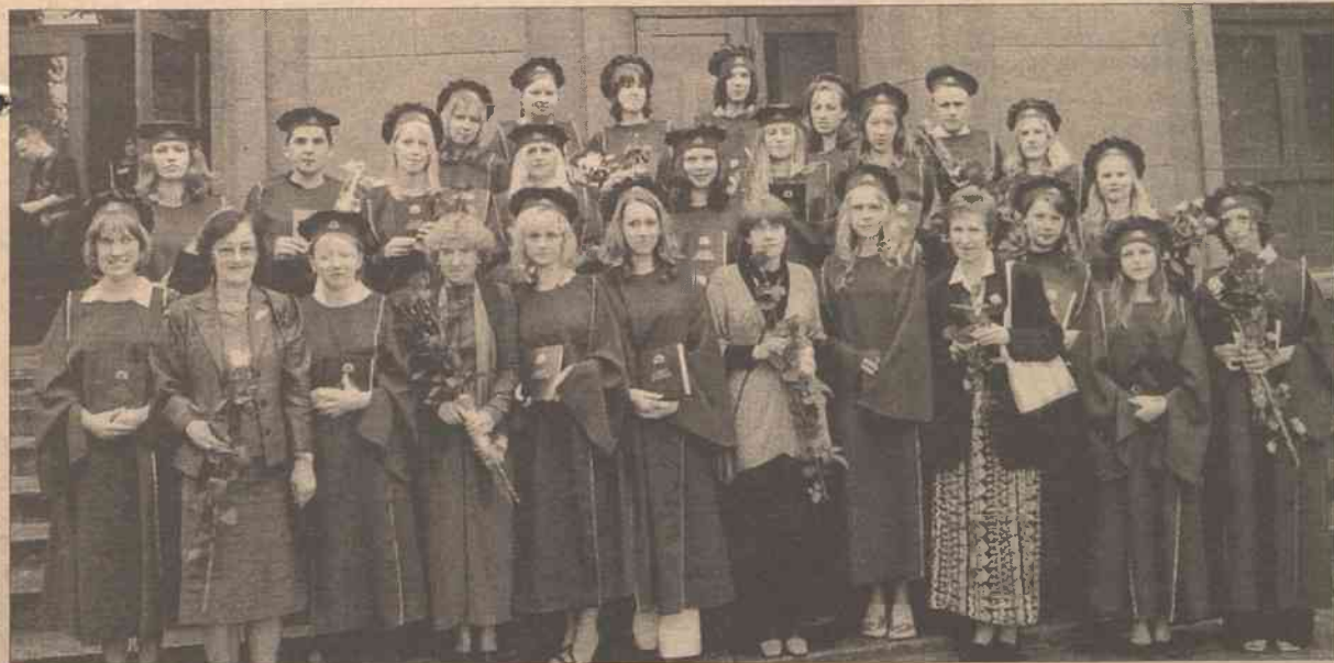
25 czerwca br. mury Uniwersytetu Pedagogicznego w Wilnie opuściła kolejna promocja polonistów: 24 bakałarzy (na zdjęciu) i 7 magistrów. Chciałoby się mieć pewność, że z odpowiednią erudycją i szacunkiem, z wiarą, nadzieją i miłością będą siać słowo polskie na Wileńszczyźnie i że będzie ono padało na podatny grunt.

Tel.: 2 67 26 47, 2 67 46 29, 2 67 01 39.