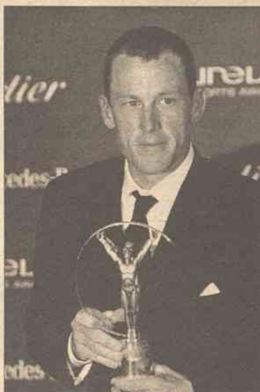
32-letni Amerykanin jest zdecydowanym faworytem prestiżowego wyścigu