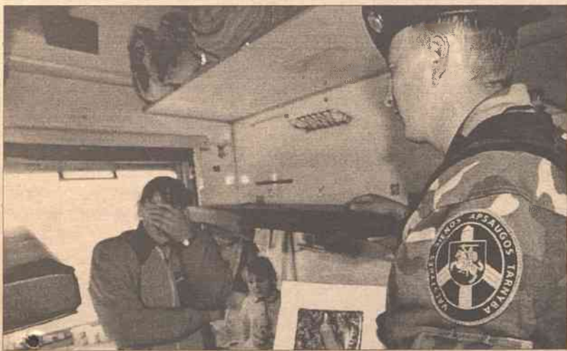
Litewska straż graniczna w nocy ze wtorku na środę z dwóch tranzytowych pociągów wysadziła 36 podróżnych.

W życie weszły nowe przepisy tranzytu rosyjskich obywateli przez terytorium Litwy do obwodów kaliningradzkiego. Dla części podróżujących sprawiło to spore kłopoty.