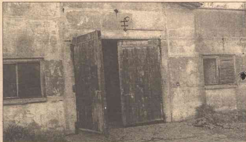
Stróż nie zgodził się wpuścić nas do środka, gdyż, jak powiedział, taki otrzymał rozkaz

nie, w temperaturze pokojowej reaguje z tlenem (Na 2 O), fluorowcami (NaX), wodą (NaOH), kwasami (sole), fluorowodorem (NaF), siarką (Na 2 S). Silnie ogrzany łączy się z wodorem (NaH), amoniakiem (NaNH 2 ) i węglem (Na 2 C 2 ). Do ważniejszych związków sodu należą ponadto: NaNO 3 , NaNO 2 , Na 2 SO 4 , Na 2 SO 3 , Na 2 CO 3 , NaHCO 3 , NaH 2 PO 4 , Na 2 HPO 4 , Na 3 PO 4 .