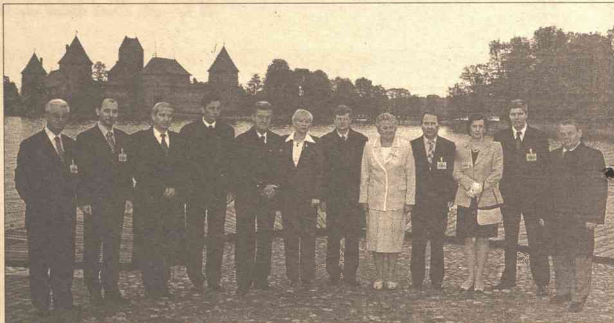
Przewodniczący Sejmu RL Artūras Paulauskas prognozuje, że Wileńska Dziesiątka będzie kontynuowała swą działalność do 2004 roku

Wzmocnienie strategicznego partnerstwa Europy i USA oraz kontynuowanie przez NATO polityki „otwartych drzwi” były podstawowymi tematami obrad przewodniczących parlamentów państw należących do Wileńskiej Dziesiątki. Obradowała ona wczoraj w Trokach.