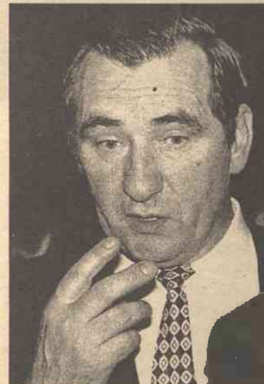
Kazys Pėdnyčia do pracy nie wróci, ale pieniądze otrzyma...

Pėdnyčia pracował jako prokurator generalny od 3 kwietnia 1997 r. i został zwolniony w połowie siedmioletniej kadencji. Zmiany w usta-