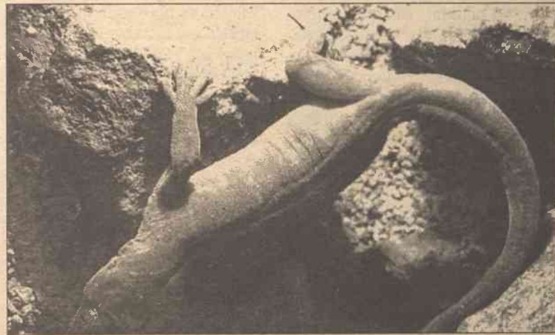
Dzięki mikroskopijnym włoskom gekon całym swoim ciężarem może zwiisać z sufitu zaledwie na jednym palcu

Nad materiałem, który właściwościami naśladowuje stopę gekona, pracuje kalifornijski naukowiec – informuje najnowszy „New Scientist”. Jego wykorzystanie zapewni oponom samochodowym niezwykle przyczepność w każdych warunkach.