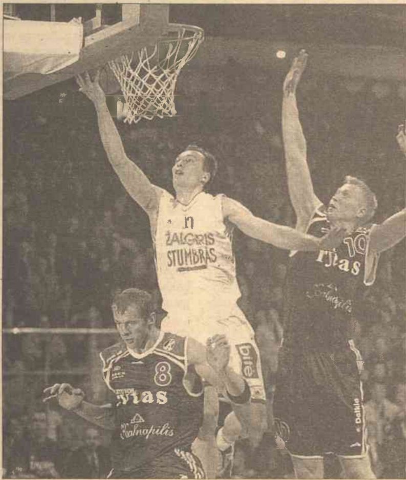
Decydujący przełom nastąpił w trzeciej kwarcie, gdy zawodnicy „Žalgirisu” złapali jakby drugi oddech, poczuli rytm gry i zaczęli wyraźnie brylować na parkiecie