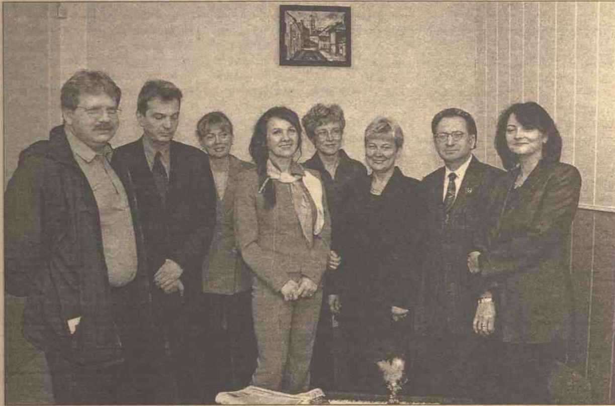
Delegacja oświatowców z Wrocławia wczoraj była gościem „Kuriera Wileńskiego”