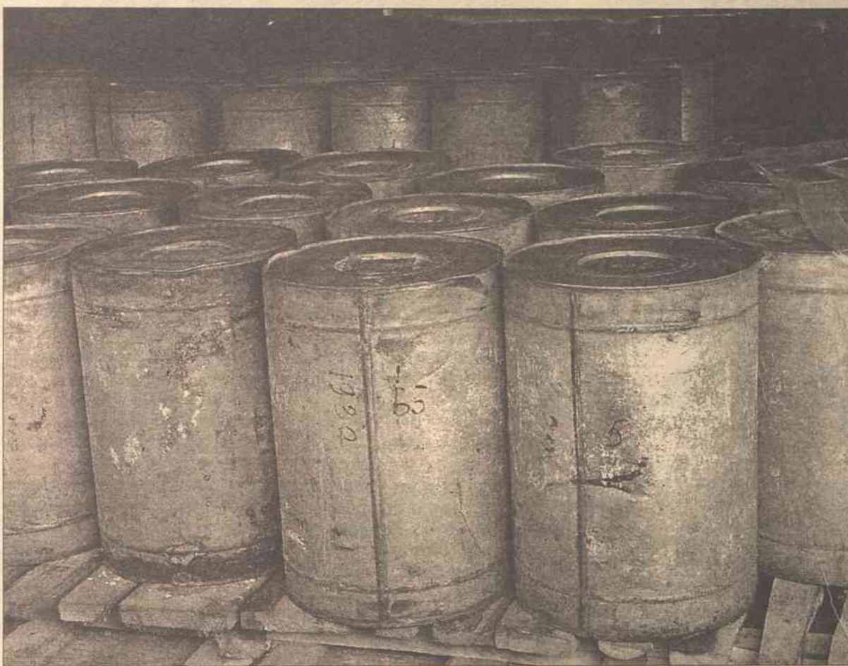
W ubiegłym tygodniu na fermie w Podkrzyżu znaleziono ponad 500 beczek z niezwykle aktywnym metalem – sodem

• A teraz pełni on tu wartę całodobową. „Nie wolno mi wpuścić nikogo. Przyjeżdżała telewizja LNK – nie puściłem, to chcieli przez okno