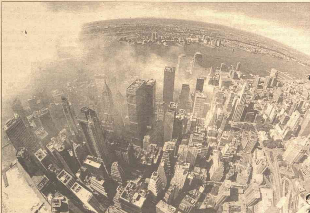
Po wydarzeniach 11 września w USA wyjątkowo poważnie traktują informacje o ewentualnych zamachach terrorystycznych

We wtorek FBI rozestało okólnik do stanowych i lokalnych organów ścigania w całych Stanach