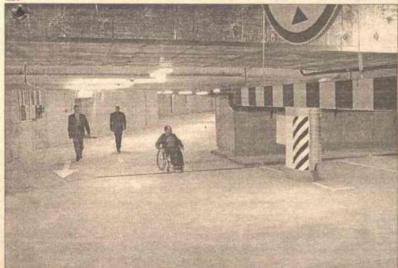
Prace pierwszy dla niepełnosprawnych są windy

Prace rozpoczęto niespełna rok przed rokiem, dokładnie 15 czer-