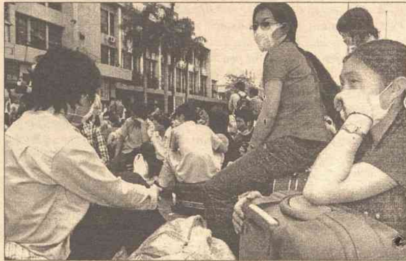
Tajwańskie władze zastryżły środki prewencyjne, w tym kontrole na lotniskach i w portach. Od niedzieli obowiązuje w miastach bezwzględny nakaz noszenia masek.

Tajwańskie władze zastryżły środki prewencyjne, w tym kontrole na lotniskach i w portach. Od niedzieli obowiązuje w miastach bezwzględny nakaz noszenia masek w środkach transportu publicz-