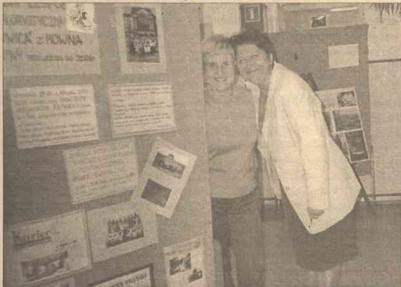
Przy okazji występów zorganizowano wystawę o historii zespołu

Osiem koncertów w ciągu 4 dni — tak wygląda statystyka. Natomiast za nią kryją się serdeczne spotkania z mieszkańcami Szczecina, uczniami i pedagogami szkół podstawowych nr nr: 51; 18; 35 oraz gimnazjum nr 27. Dowody sympatii, które zespół odbierał w czasie występów, są bodźcem do dalszej pracy, doskonalenia tego, co robimy. Najbardziej wzruszające były wypowiedzi dzieci, które koniecznie chciały otrzymać autografy wszystkich członków zespołu, stwierdzając, że to był najpiękniejszy koncert w ich życiu. Szkoła Podstawowa nr 51 zorganizowała także wystawę o zespole.