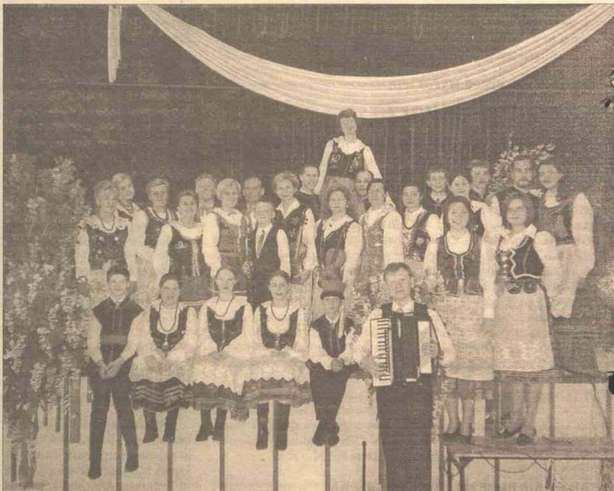
Zespół folklorystyczny „Kotwica” aktywnie koncertuje nie tylko w rodzinnym Kownie, ale i w różnych miastach Polski