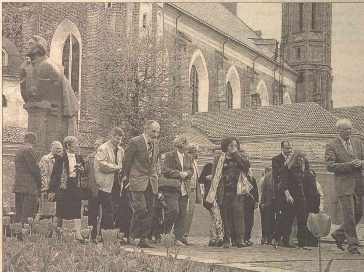
X Spotkania Poetyckie "Maj nad Wilią" zainaugurowano przy pomniku Mickiewicza, gdzie nieopodal, przy ul. Młynowej 2, mieszkał drugi Wieszczyk – Konstanty Ildefons Gałczyński. Jego imię często będzie do czwartku wspomniane.