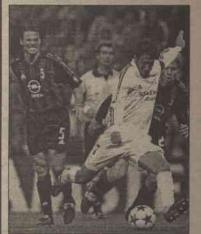
Real Madryt pokonał Manchester United 3:1