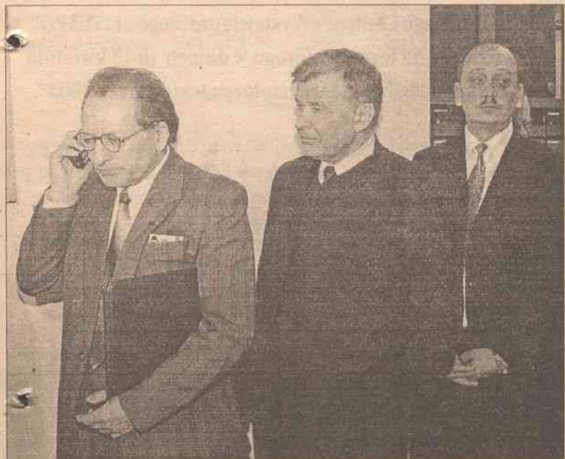
Radni z ramienia AWPL — w kolejce do głosowania

Nowy mer włada jęz. polskim, rosyjskim i angielskim.