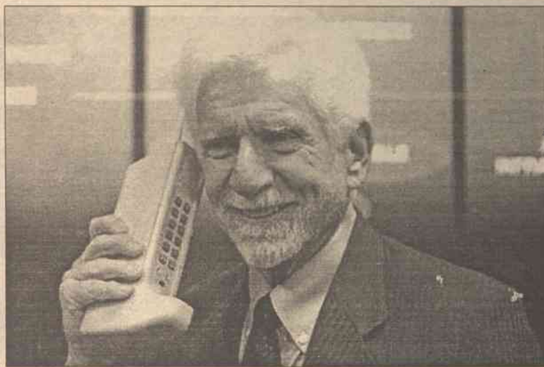
Cooper stwierdził, że ma wielu świadków gdy spacerował z „komóreczką” po ulicach Nowego Jorku

Po informacjach na temat dwudziestej rocznicy wprowadzenia na rynek telefonów komórkowych przez Motorolę jej twórca Martin Cooper, ówczesny pracownik Motoroli, a obecnie szef firmy Array-Com, stwierdził w programie telewizyjnym, że „komórkowy zegar” zaczął odliczanie 10 lat wcześniej.