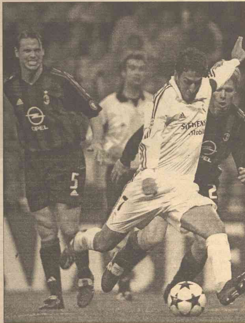
Dwie bramki Raula (biały strój) znacznie przybliżyły piłkarzom Realu awans do następnej rundy

Real Madryt pokonał Manchester United 3:1, a Ajax Amsterdam zremisował bezbramkowo z AC Milan w pierwszych ćwierćfinałowych meczach piłkarskiej Ligi Mistrzów.