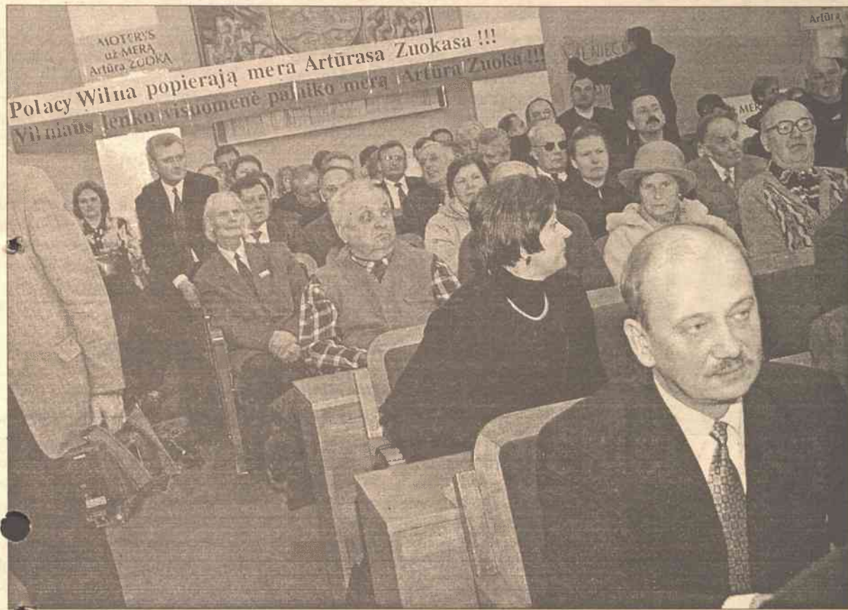
Na sali obrad wśród mnóstwa plakatów wyrażających poparcie dla Artūrasa Zuokasa rzucal się w oczy duży transparent w języku polskim