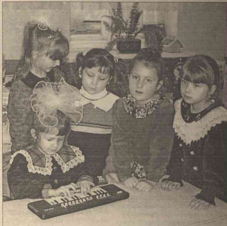
Dziewczynki są wychowywane w ten sposób, że pragną wypełnić chęci i zapotrzebowania innych, bardzo często zapominając o sobie

Wśród koleżanek, które w życiu nastolatki są bardzo ważne, każda dziewczyna czuje się pewna, że nie jest sama, wiele jej koleżanek przeżywa podobne rozterki czy kłopoty. Według metodyki, najlepiej, gdy grupy są prowadzone przez dwie dorosłe osoby.