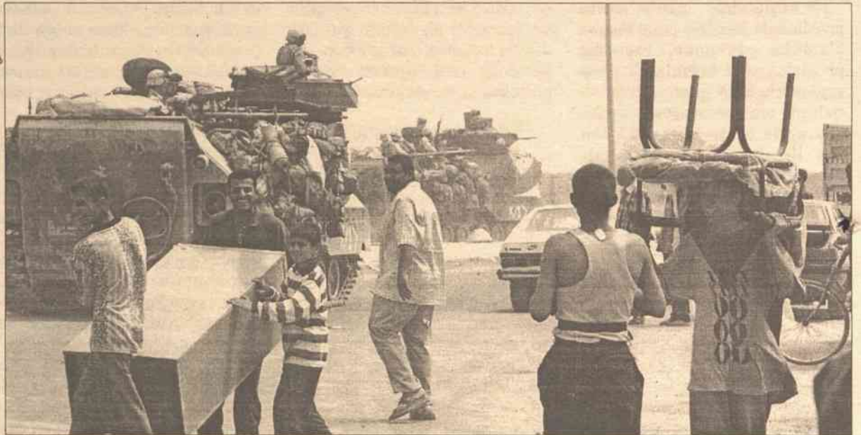
Irakijczycy masowo rabują obiekty publiczne w Bagdadzie

Iracki minister informacji Mohammad Said al-Sahaf oświadczył, że żołnierze amerykańscy, którzy wtargnęli do Bagdadu, „muszą się poddać albo zostaną spaleni w swoich czołgach”. Z kolei Amerykanie informowali o „niekonwencjonalnych” próbach powstrzymania ich przez Irakijczyków, którzy rozkładają na drogach drut kolczasty i przygotowują miny pułapki. Nie wszyscy – z Bagdadu uciekały setki cywilów. Wypelnione ludźmi samochody, cie-