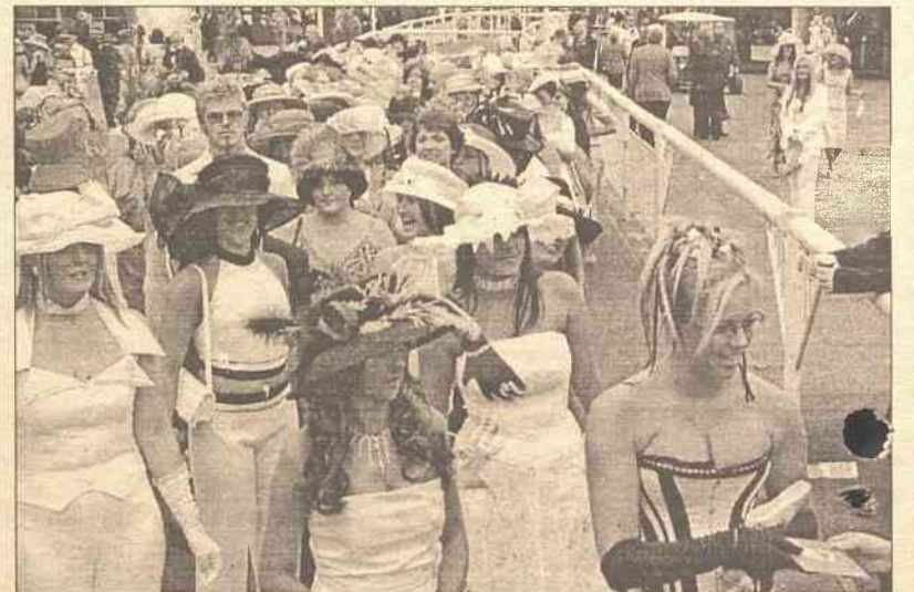
Podczas zawodów jeździeckich odbywających się w ubiegły weekend w Liverpoolu (Anglia) był zorganizowany również konkurs mody dla widzów. O tytuł najgustowniej ubranego widza ubiegały się zarówno panie, jak też panowie. Chętnych uczestniczenia w tym konkursie nie brakło, gdyż główną nagrodą był niezwykle modny, popularny, a jednocześnie drogi samochód "Jaguar".

Spisek został odkryty we wrześniu 2001 roku, gdyż członek ekipy prowadzącej zwrócił uwagę na głosne kaszlnięcia i wezwał policję. Wypłacenie nagrody zostało wstrzymane, zaś program nigdy nie został wyemitowany. (PAP)