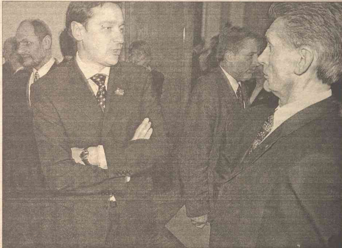
Rozmowa dwóch głównych „aktorów” wczorajszego „przedstawienia” w sali samorządu m. Wilna przed decydującą rozgrywką

Decyzję AWPL oceniam bardzo dwuznacznie. Jak by nie było całą kadencję pracowaliśmy ramieniem przy ramieniu. I ja, jako mer, szczególnie starałem się włączyć w problemy społeczności polskiej, rozwiązując wiele nurtujących problemów. Taka, wyłącznie pragmatyczna decyzja, jeżeli nie powiedzie się mocniej – sprzedać się za te lub inne korzyści polityczne, które jeszcze nie wiadomo czy będą zrealizowane, dla mnie po prostu jest niezrozumiała – powiedział "Kurjerowi" Zuokas. Były mer nie krył słów goryczy wobec byłych koalicjantów.