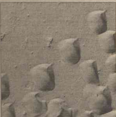
Zdjęcia płaskowych wydm na Marsie, przypominających ryby albo chmurki, zamieściło w Internecie amerykańskie Centrum Badań Kosmicznych (NASA). W Internecie w ubiegłym tygodniu znalazło się zaledwie kilka nowych zdjęć z ogólnej liczby sięgającej około 11 tysięcy odbitek.