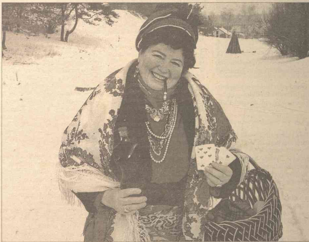
Kiedyś w dzień zapustny śpiewano, tańczono, jedzono kilkanaście razy. Obecnie święto nieco zapomniane, ale jeśli są chęci – na pewno można je odtworzyć!