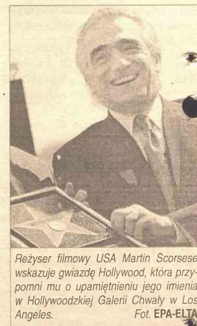
Reżyser filmowy USA Martin Scorsese wskazuje gwiazdę Hollywood, która przypomni mu o upamiętnieniu jego imienia w Hollywoodzkiej Galerii Chwały w Los Angeles.