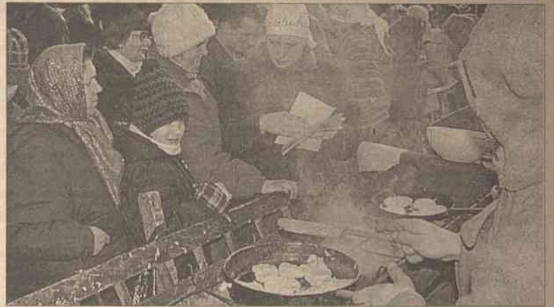
Taki właśnie prawdziwy raj blinów zapustowych szykuje dziś szereg placówek