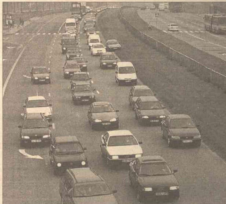
Już od 1 marca można sobie odpuścić i światełka zgasić