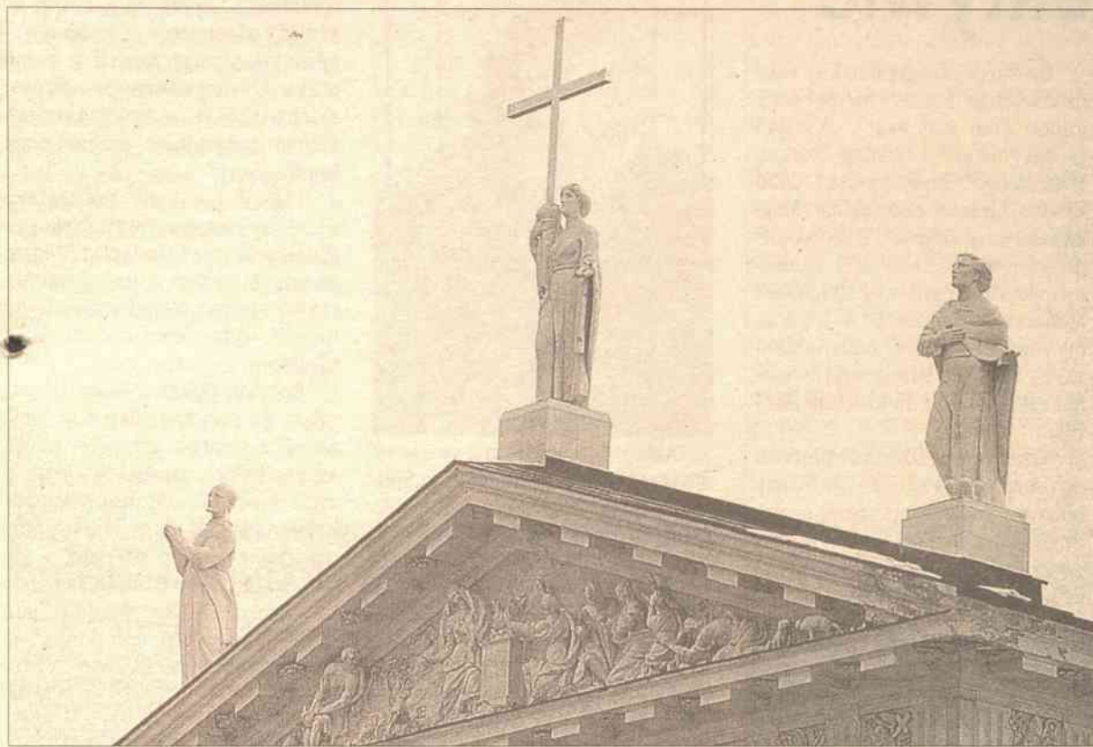
Fronton Archikatedry pod wezwaniem św. Stanisława biskupa w Wilnie. Od lewej: św. Stanisław, św. Helena i patron Litwy św. Kazimierz

Litwa, kraj wedle najnowszego spisu powszechnego w 79 proc. katolicki, już na przeciągu ponad 400 lat czci jako swego patrona świętego Kazimierza (notabene, jest to jedyny święty, jakim możemy się poszczycić). Od 1950 roku św. Kazimierz jest również patronem młodzieży Litwy. Wczoraj, w przeddzień święta patrona naszego kraju, postanowiliśmy sprawdzić, czy wilnianie mogą się popisać przynajmniej minimalną wiedzą na ten temat.