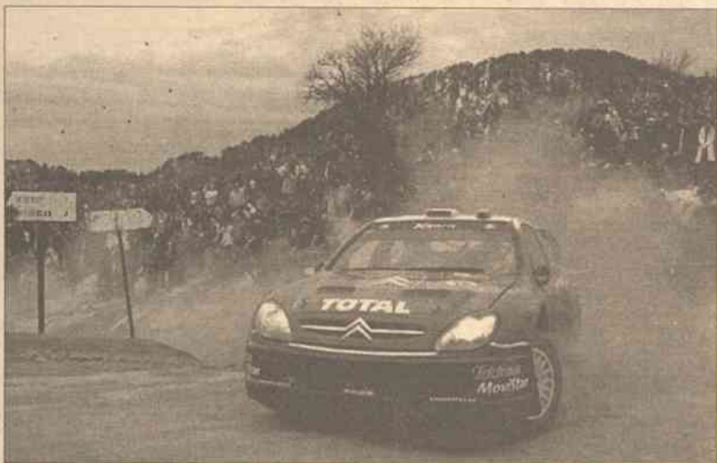
Dla Carlosa Sainza (Citroen Xsara) zwycięstwo w Rajdzie Turcji stało się 25. w karierze

Jadący Citroenem Xsarą Hiszpan Carlos Sainz wygrał Rajd Turcji, trzecią eliminację mistrzostw świata kierowców rajdowych. Jest to jego 25. zwycięstwo w karierze.