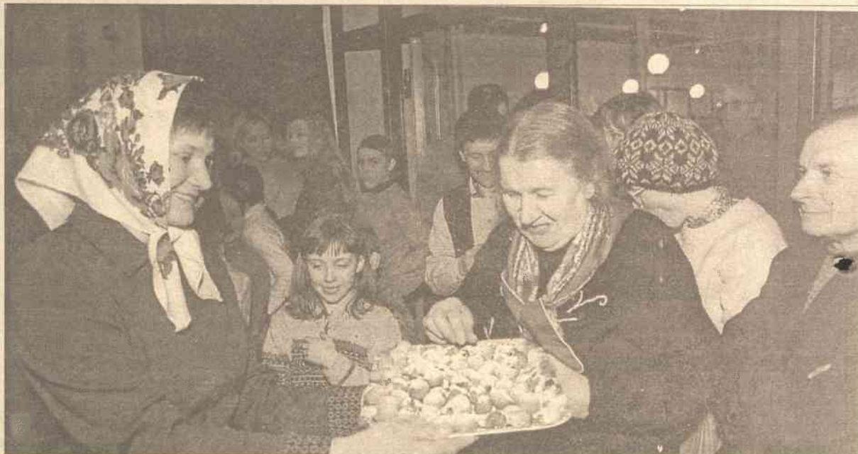
Jakież to polskie Zapusty bez pączków. Nie zabrakło ich również w Domu Kultury Polskiej