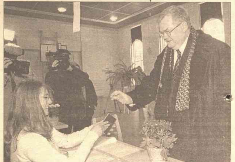
Edgar Savisaar (na zdjęciu) przyznał, że "Res Publica jest ostatecznie o wiele silniejsza, niż przewidywano"

W trwającej od 1998 roku wojnie domowej w DRK zginęło, w większości wskutek chorób i głodu, około dwóch milionów osób. W walki zaangażowane były bądź są wojska kilku sąsiednich państw.