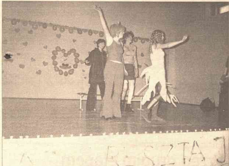
Amorek, diabełek oraz zakochana para z klasy 8h zabawiają widzów

Jest piękny kraj, cudowny kraj Miłością on się zowie