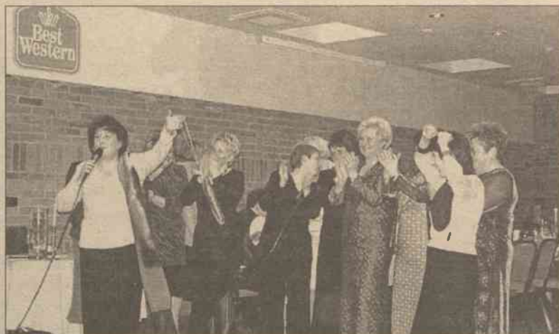
Co najmniej sto par wileńskich Polaków do przysłowiowego białego rana bawiło się na balu zapustowym w hotelu „Naujasis Vilnius”

Wydawca VS | „Vilniusis žodis”, Dyrektor spółki, Roman Baranowski (tel. 260 84 44), Adres: Birbūnių g. 4a 2030 Vilnius, Lietuvos Respublika. Indeks 0044 SL 322, ISSN 1392-0405, Druk UAB „KLION”