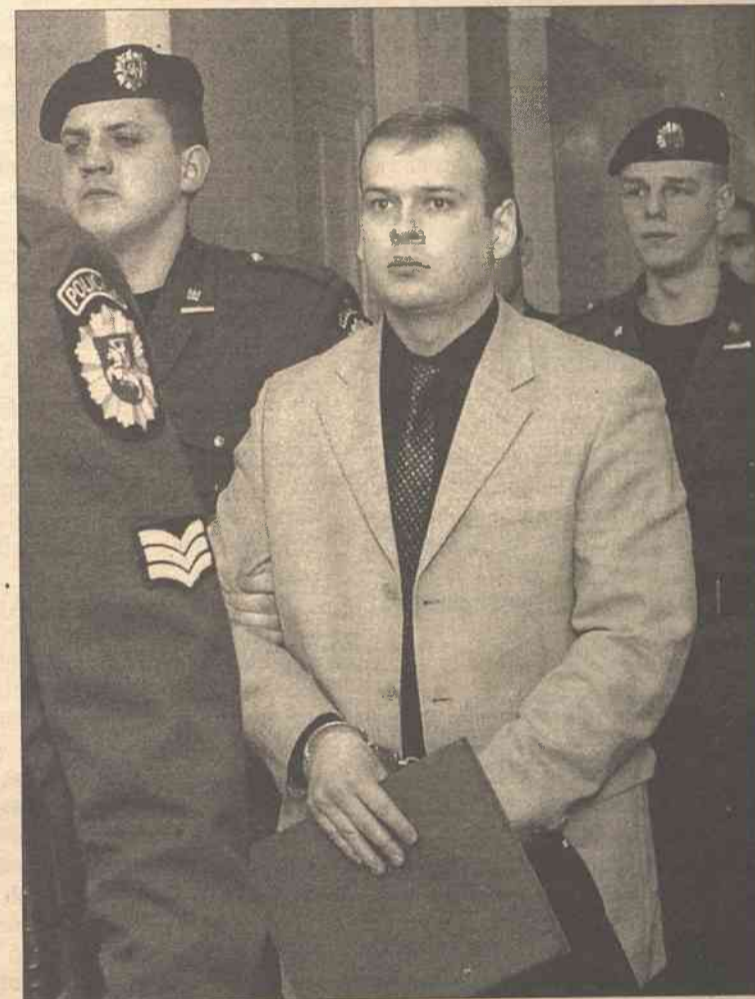
Syn, który dwa razy strzelił do ojca