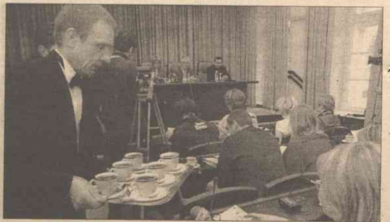
W prezydenturze po raz pierwszy częstowano dziennikarzy herbatą „Dilmah” z rumem – nie wlewany, oczywiście

– Każdy z myśliwców posiada silnik, jakich trzy mają znane samoloty Jak 42. Tak więc huk w Wilnie