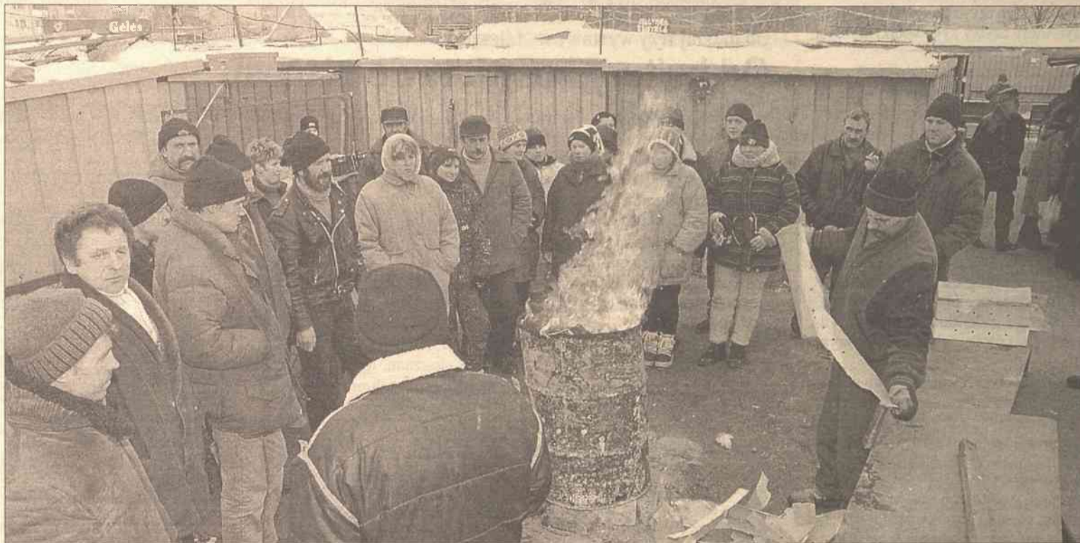
Rynek w Nowej Wilejce w oczekiwaniu na szturm