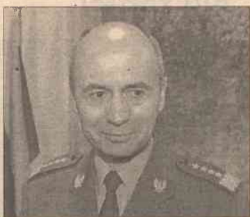
Będziemy razem postanawiać jak działać wobec różnych zagrożeń — powiedział generał Czesław Piątas

Czesław Piątas spotkał się w Wilnie z dowódcą Wojska Litewskiego generałem majorem Jonasem Kronkaitisem, ministrem ochrony kraju Linasem Linkevičiusem, z członkami sejmowego Komitetu Bezpieczeństwa i Obrony. Na cmentarzu Anto-