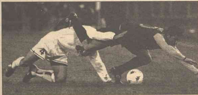
W pierwszej po przerwie klejce zawodnicy walczyli o każdą piłkę