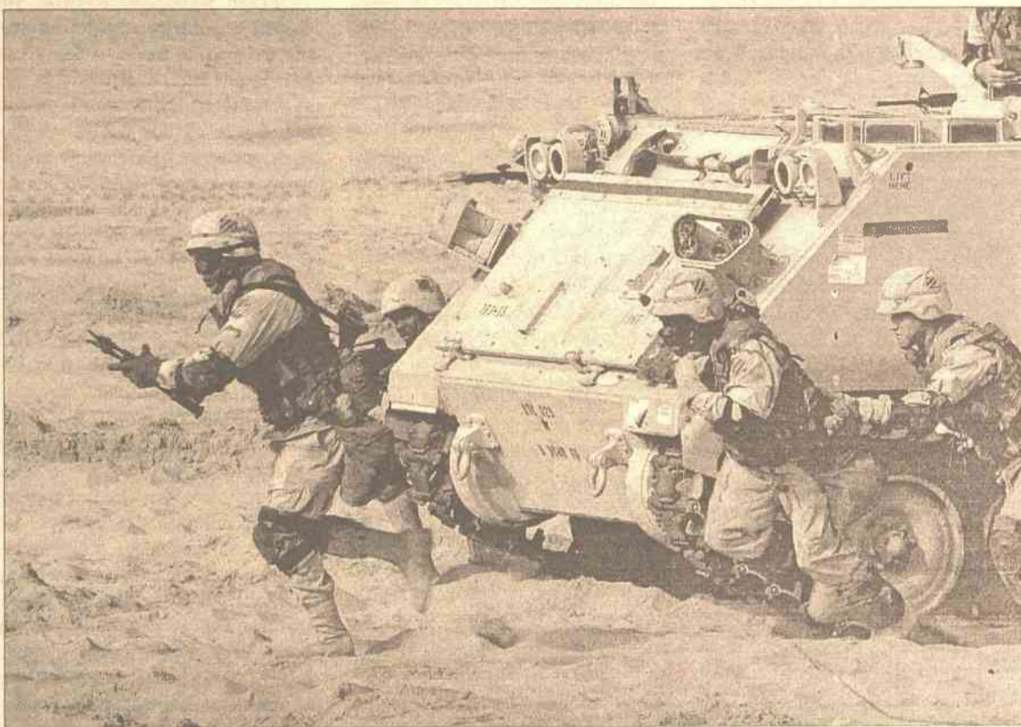
Bagdad może uniknąć wojny...

UE zażądała wczoraj, żeby Irak w pełni współpracował z inspektorami, jeśli chce uniknąć wojny. Po rozmowach z Blixem, szef unijnej dyplomacji Javier Solana powiedział, że Blix "przekazał mi swoje obawy, że współpraca z Saddamem