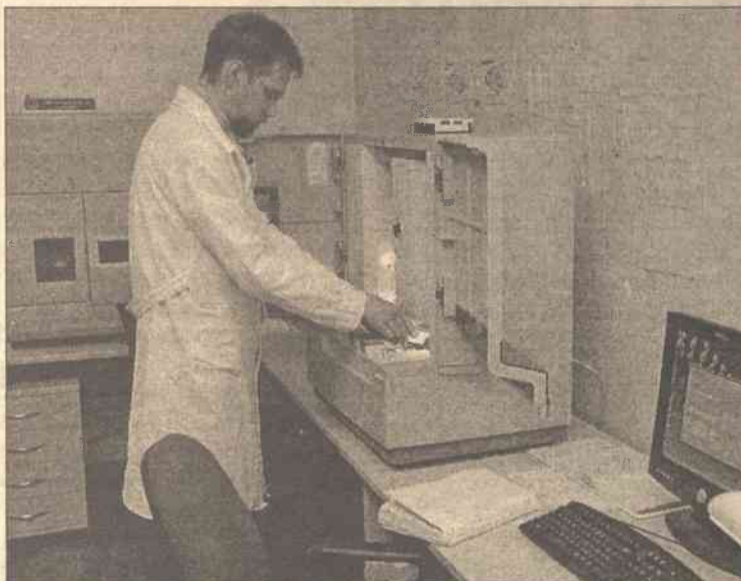
Kryminalistycy będą mogli zwiększyć wydajność pracy