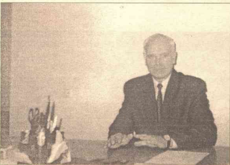
— W tym roku wszystkie placówki będą zmuszone do przejścia inicjatywy samodzielnego sprawdzania jakości i higieny — podsumował rozmowę kierownik służby

„Vilniaus degtinė” w ubiegłym roku udało się zwiększyć sprzedaż