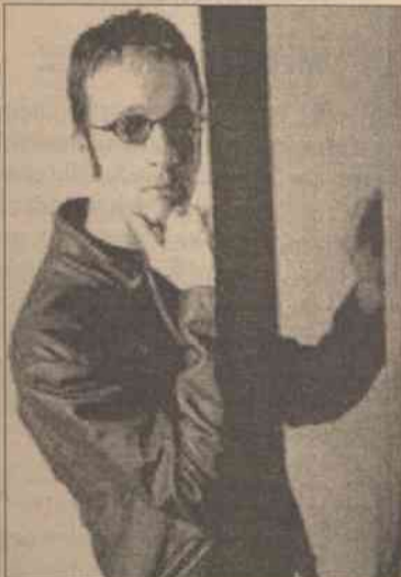
Wykonawca jednej z najbardziej komercyjnych grup muzycznych zmarł w niedzielę

W środę wieczorem odbyło się uroczyste pożegnanie ze zmarłym w niedzielę członkiem legendarnej w epoce disco grupy „Bee Gees” Maurice Gibbem. W ceremonii uczestniczyli tylko członkowie rodziny i najbliżsi przyjaciele. Zwłoki 53-letniego piosenkarza zostaną poddane kremacji.