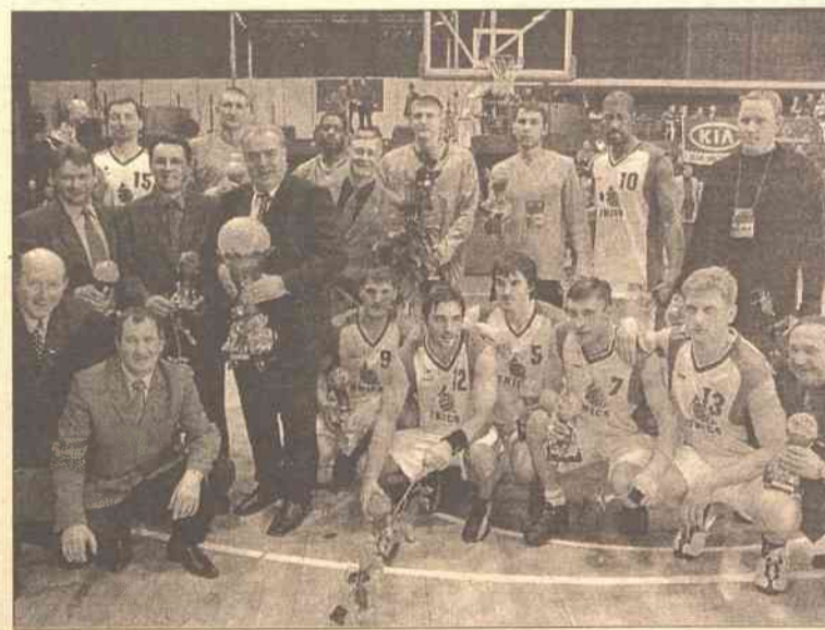
Zwycięzca finałowego turnieju, drużyna Unics Kazan

Ogółem rozgrywki Pucharu Europy FIBA najciekawsze okazały się właśnie w Konferencji Północnej, czego podsumowaniem były mecze finałowe w Wilnie. Co się tyczy fina-