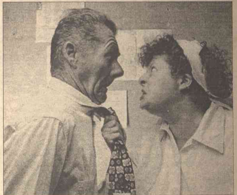
Dążąc do równouprawnienia pozbawiamy, być może nieświadomie, mężczyzn pewności, zdecydowania, powodując, że mają wiele kompleksów

Jak najszybciej skończ rozmowę. Możesz powiedzieć, że lepiej na dziś przerwać konwersację, bo może ona skończyć się poważnym nieporozumieniem. Nie tłumacz się jednak tym, że boli cię głowa albo