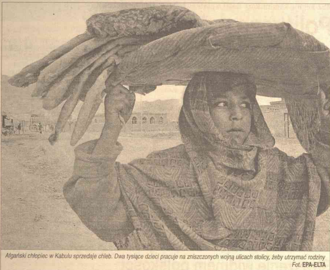
Afgański chłopiec w Kabulu sprzedaje chleb. Dwa tysiące dzieci pracuje na zniszczonych wojną ulicach stolicy, żeby utrzymać rodziny

Spanie z własnymi małymi dziećmi coraz częstsze