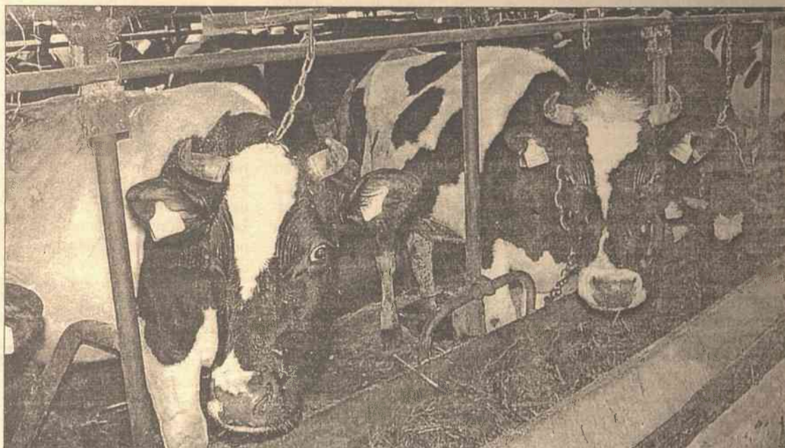
Bydło nie może znajdować się w jednym pomieszczeniu z trzodą, podłoga ma być betonowa, powinny być lodówki dla ochłodzenia mleka

— Badania mleka są konieczne i jeżeli została wykryta choroba, człowiek będzie zmuszony do likwidacji krowy. Państwo, dzięki funduszom wsparcia rolników, ma ustalony tryb rekompensaty w takich wypadkach. Służba troszczy się również i kontroluje pracę lekarzy weterynaryjnych, którzy pracują w rejonie, prowadzą działalność profilaktyczną i prewencyjną, co pewien okres dokonują badań, leczą i oznakowują bydło. Dba o zachowanie odpowiednich wymagań higieny w placówkach żywienia zbiorowego, przedsiębiorstwach przeróbki mięsa. Służba już od kilku lat opracowuje system wymagań, który będzie odpowiadał wymaganiom stawianym przez Unię Europejską. Z działających obecnie w rejonie