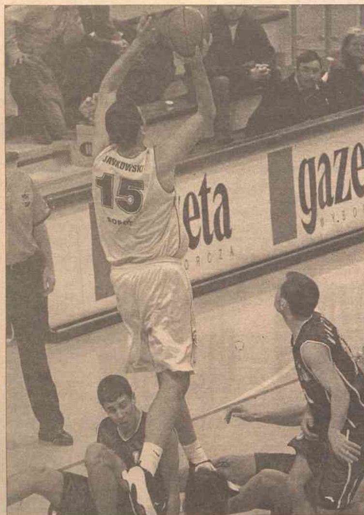
Koszykarze Prokomu Trefla Sopot (światło stroje) znacznie przewyższali pod względem umiejętności zawodników Ality Olita

– Prokom jest od nas lepszy o klasę. To było dziś widać. Na początku nieco lepiej zagraлиśmy w obronie, nie rozumiem jednak tego, dlaczego tak słabo moi zawodnicy wykonywali rzuty wolne. W porównaniu do ubiegłego sezonu, gdy m. in. zdobyliśmy brązowy medal mistrzostw Litwy, pozostało