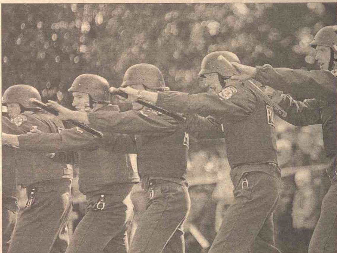
Policja w przyszłym roku będzie musiała nadstawiać helmu rozwydrzonej przestępczości

— Z powodu prowadzenia interesów „na czarno” w razie porwania kogoś z bliskich w celu okupu biznesmeni będzie się bał zwrócić do policji i przestępcy mogą dzia-