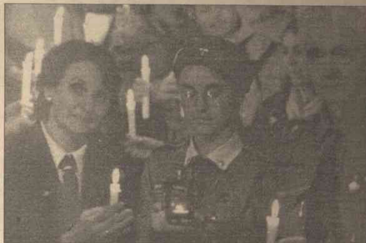
Blogosławieni, którzy wprowadzają pokój, albowiem oni będą nazwani synami Bożymi

Co roku skauci austriaccy przewożą z Betlejem do Wiednia ogień odpalony z Groty Narodzin Chrystusa. Przekazują go braciom i siostrom rozsianym po całej Europie.