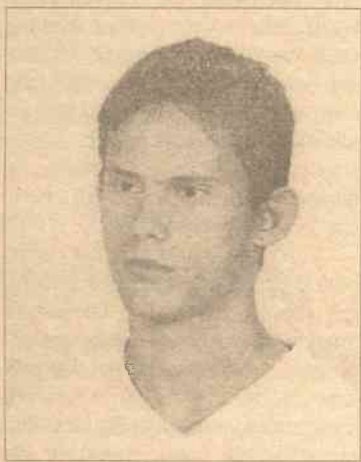
Drużynowy 9WDH „Szlak”

Sytuacja w organizacji jest po prostu krytyczna. Cały problem polega na tym, że nie mamy Naczelnika i wobec tego praca w drużynach