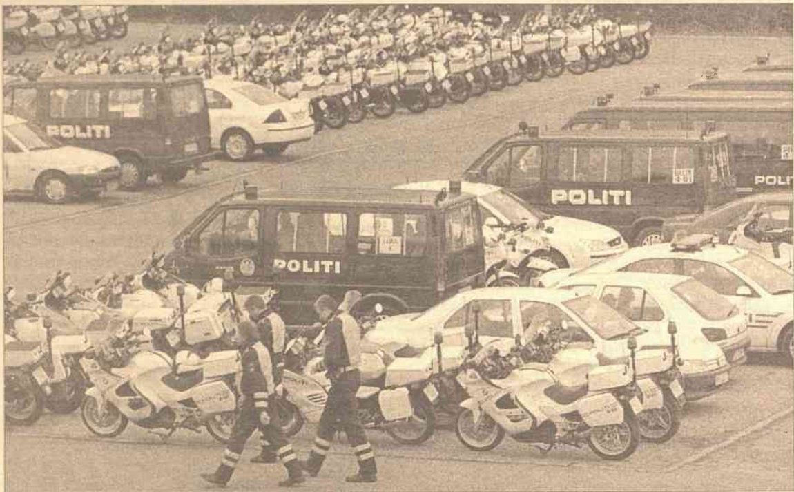
Blisko 5 tys. policjantów będzie czuwać nad bezpieczeństwem uczestników kopenhaskiego szczytu Unii Europejskiej

To przyniesie z kolei wymierne korzyści dzisiejszym członkom Unii w postaci mniejszego naporu nielegalnych imigrantów i mafii ze Wschodu, lepszej wykrywalności