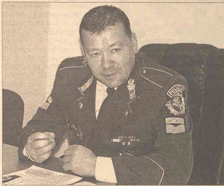
Grigaravičius zapowiedział rozbicie band kowieńskich

— Teraz wysiłek policji skierowany jest na rozbicie band kowieńskich i śmiem twierdzić, że nam się to uda — pochwalił się Grigaravičius. — W Biurze Policji Kryminalnej mamy nieliczne, ale doświadczony kadry pracowników, które po przejściu „stażu” praktycznego w Ponie-