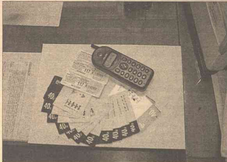
Tak naprawdę za wygraną nie trzeba wnosić żadnych opłat, tym bardziej kartami telefonicznymi

uprowadzono samochód VW LT 35, należący do G. K. Straty — 34 000 litów. We wsi Grioviai (gmina zųjųńska) uprowadzono traktor własnej produkcji. Później znaleziono go, już rozmontowany, w Krawczunach. Straty — 1 600 litów. We wsi Kloniai (gmina Niemież) uprowadzono samochód VAZ 2103, należący do V. G. Straty — 1000 litów.