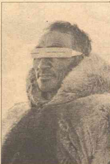
Grenlandia w 1985 roku zdecydowali się opuścić UE obawiając się, że Europejska Wspólnota Gospodarcza będzie decydować o ich rybołówstwie

Amerykańska baza lotnicza w Thule, zbudowana w 1951 roku,