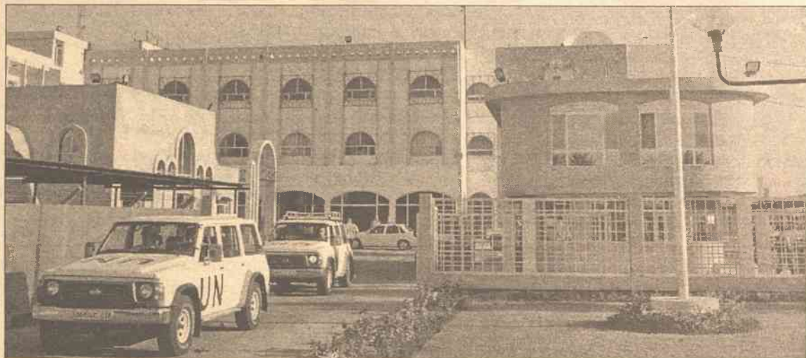
Inspekcje winny odbywać się z zaskoczenia, a Irakijczycy nie powinni być uprzedzeni o planach dziennych ekipy ONZ

Fleischer potwierdził, że prezydent George W. Bush jest sceptyczny