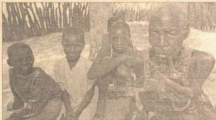
Według najnowszych danych ONZ, 42 mln ludzi są zarażone HIV lub mają AIDS, z czego pięć milionów zaraziło się wirusem w minionym roku. Najwięcej zakażonych HIV lub mających już AIDS – 30 mln ludzi – mieszka w południowej Afryce.

Z raportów rosyjskich i ONZ-owskich w sprawie szerzenia się AIDS, uzupełnionych w październi-