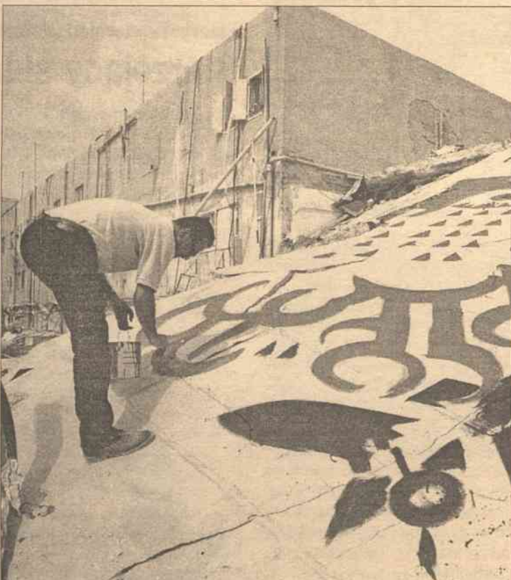
Palestyńczyk w zburzonej przez żydowskie wojsko siedzibie Yassera Arafata w Ramalii znalazł miejsce na rysunek Feniksa. Plastyk wierzy, że Palestyna powstanie z ruin niczym Feniks z popiołów. Arafat żąda, aby żołnierze żydowscy wycofali się z Ramalii.