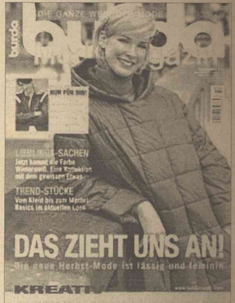
Burda zapewni elegancki strój przy skromnych wydatkach

Przygotowanie: paprykę opłucz i pokrój w paseczki. Sałatę opłucz i odsącz i porwij na małe kawałki.