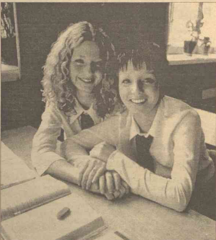
Pomimo ciągłych wyjazdów nastolatki znajdują czas na naukę

„Bardzo chcieliśmy przyjechać do Polski, ponieważ nie miałyśmy tu jeszcze koncertów. Ponieważ jest