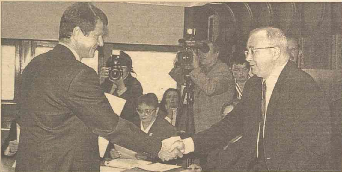
Rolandas Paksas w Komisji stawia się wraz z kolegami z klubu parlamentarnego