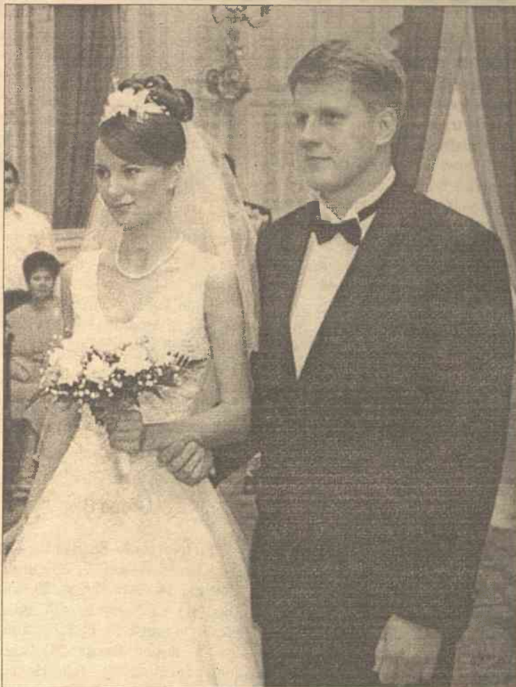
Instytucja małżeństwa na Litwie ostatnio nie cieszy się powodzeniem

Na Litwie na stu mężczyzn przypada 114 kobiet, jednak małżeństw zarejestrowano dwukrotnie mniej niż przed dziesięcioleciem. Dane te przytoczono w wydaniu „Kobiety i mężczyźni na Litwie w 2001 roku”.