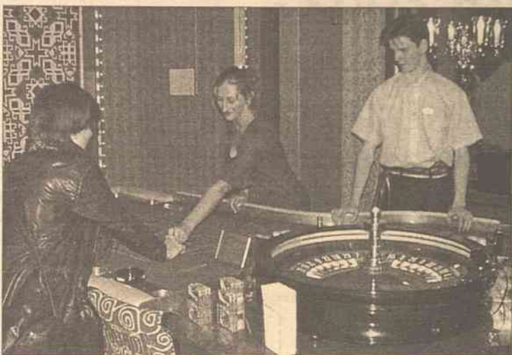
Stoły do gry jako pierwsi wypróbowali dziennikarze

Podobno tradycja gier hazardowych sięga setek lat p. n. e. Chińczycy, Grecy, Egipcjanie grali w kości, karty wynaleziono w krajach islam-