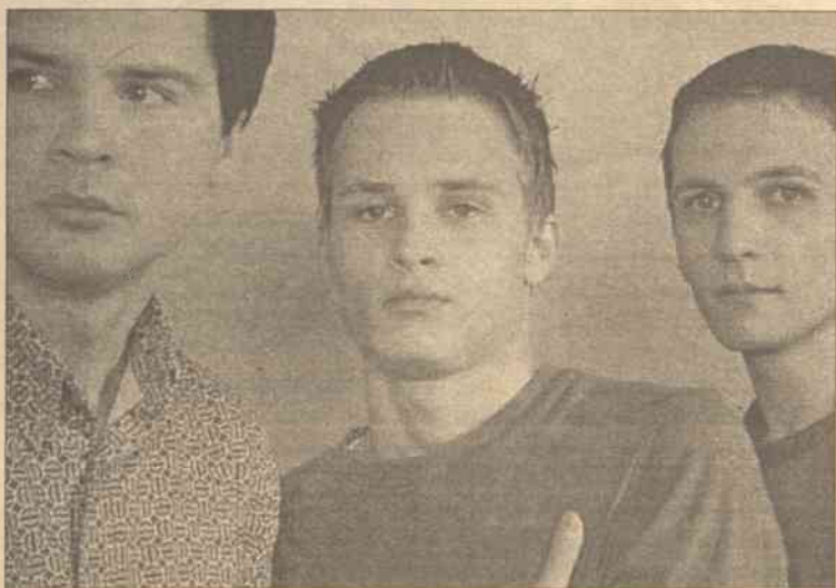
Brzmienie płyty winylowej „Jazzus Juice” jest tak samo oryginalne, jak nazwa formacji