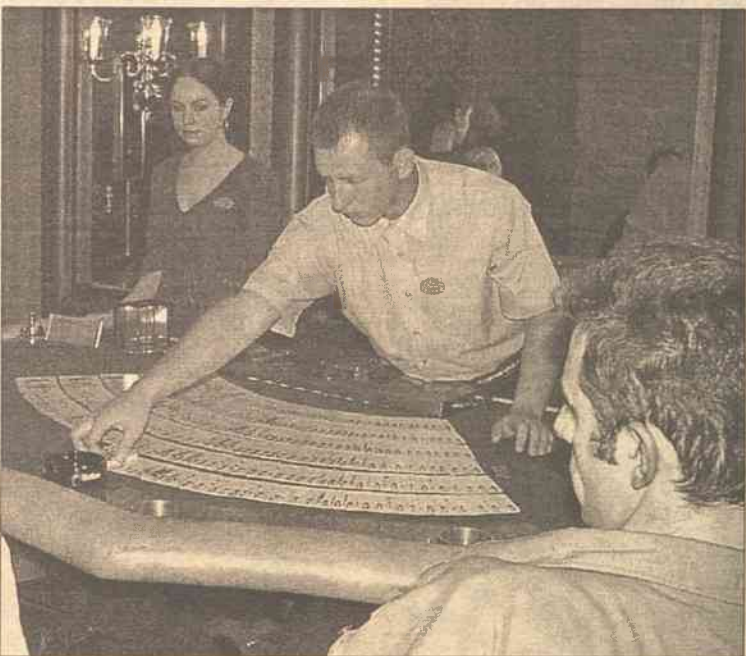
Kasyno zatrudniło 24 krupierów

skich, na Litwie hazard zrodził się porównywalnie późno – aż w XIII w.