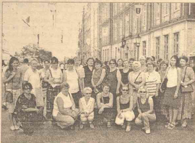
Grupa nauczycieli na wycieczce w Gdańsku

Tydzień treściwej i intensywnej pracy, wypełniony wycieczkami do Gdańska, Sopotu, minął bardzo