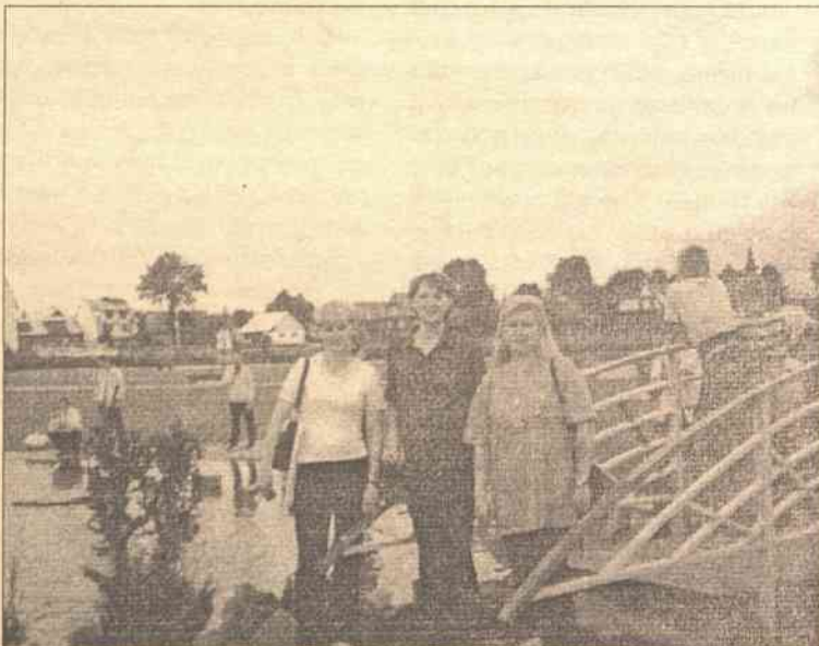
Ludźmierz, Ogród Maryjny