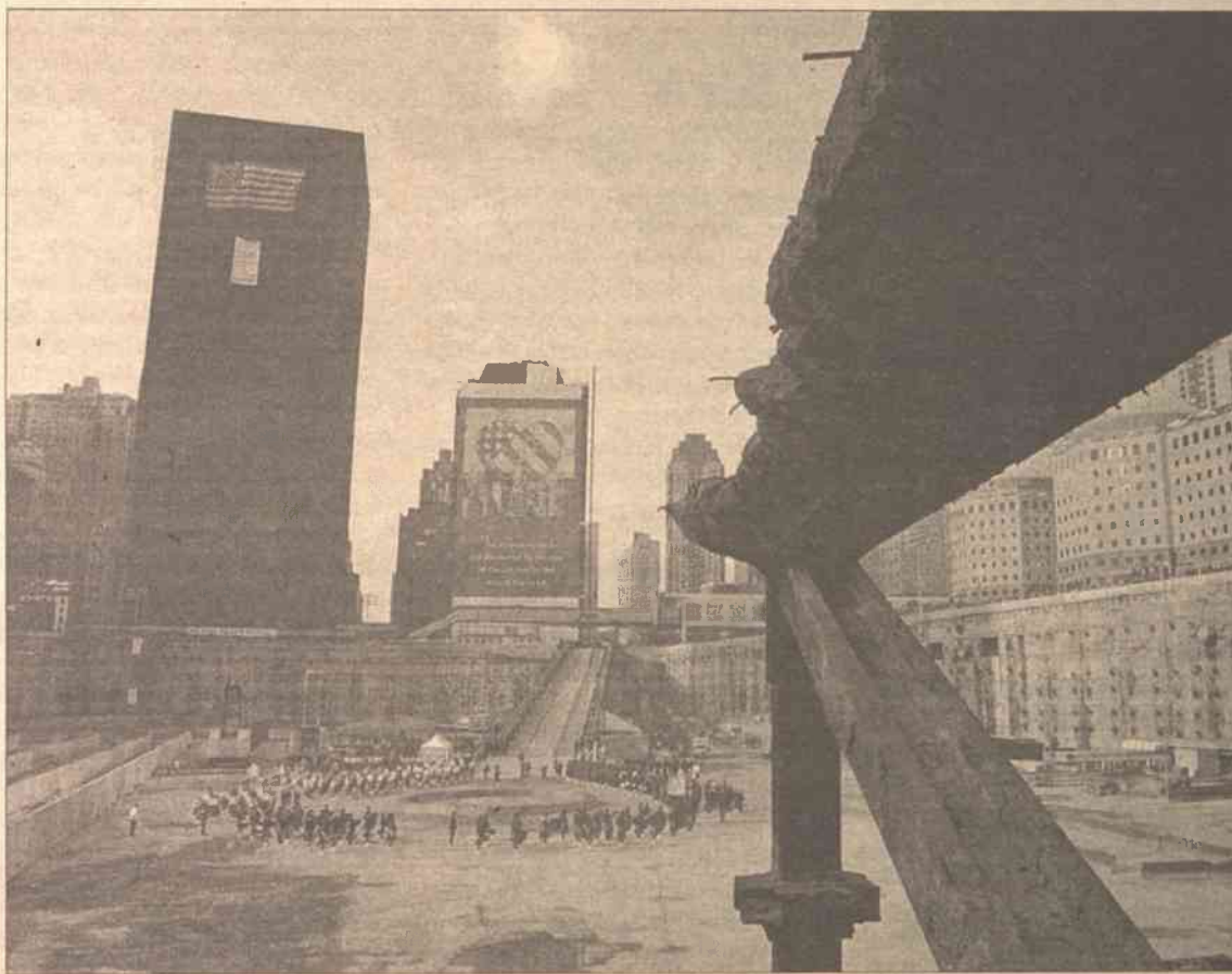
Rodziny zabitych zgromadziły się wokół „kręgu honoru” na miejscu, gdzie stały dawniej wieżowce

Punktualnie o godz. 8.46 – w chwili, kiedy równo rok temu