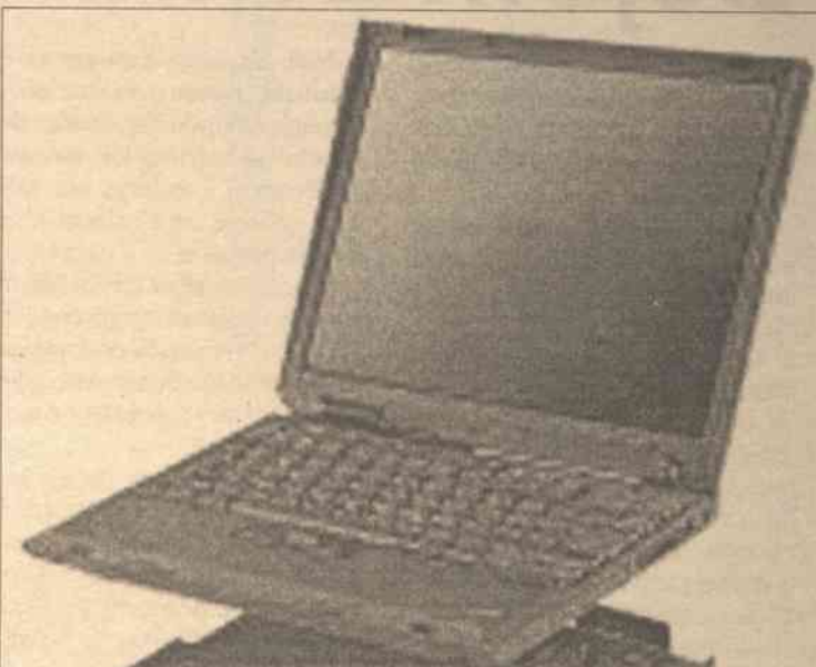
Notebook ThinkPad X30