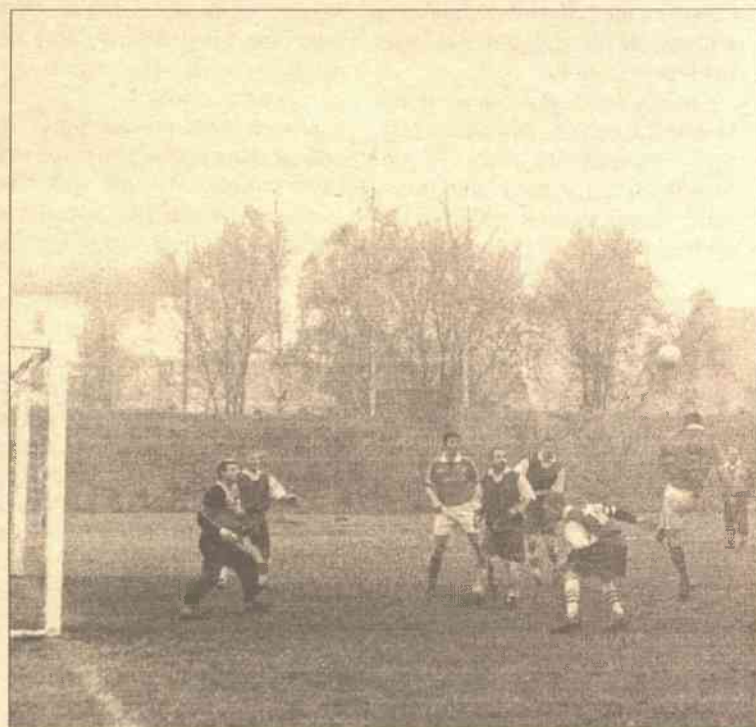
W meczach mistrzostw rejonu wileńskiego często dochodziło do akcji podbramkowych