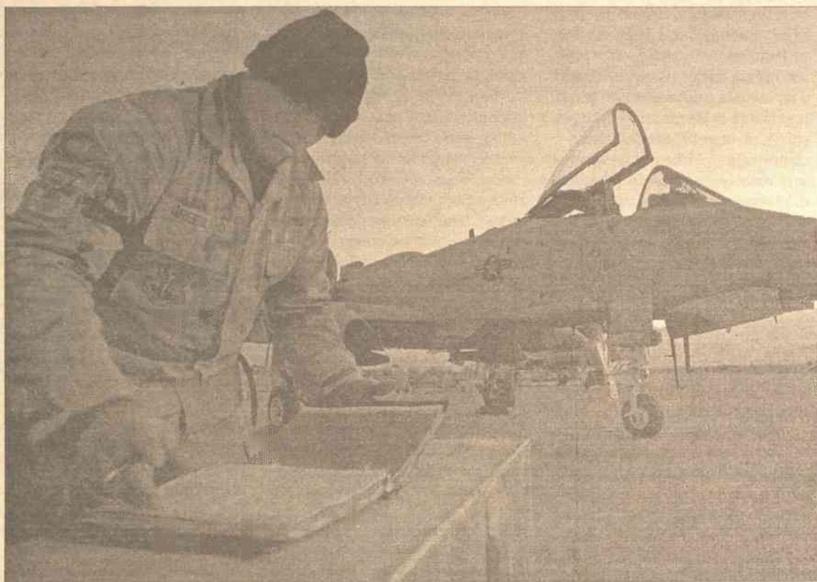
Ostrzał w Choście miał miejsce na kilka godzin przed obchodami w bazie rocznicy ataków terrorystycznych na Nowy Jork i Waszyngton

Po incydencie czasowo zamknięto główną drogę, biegnącą