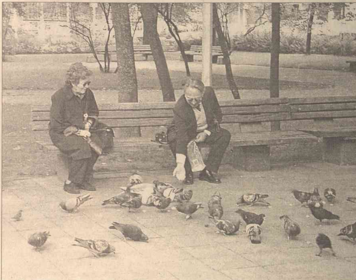
Na Litwie z każdym rokiem przybywa osób osamotnionych