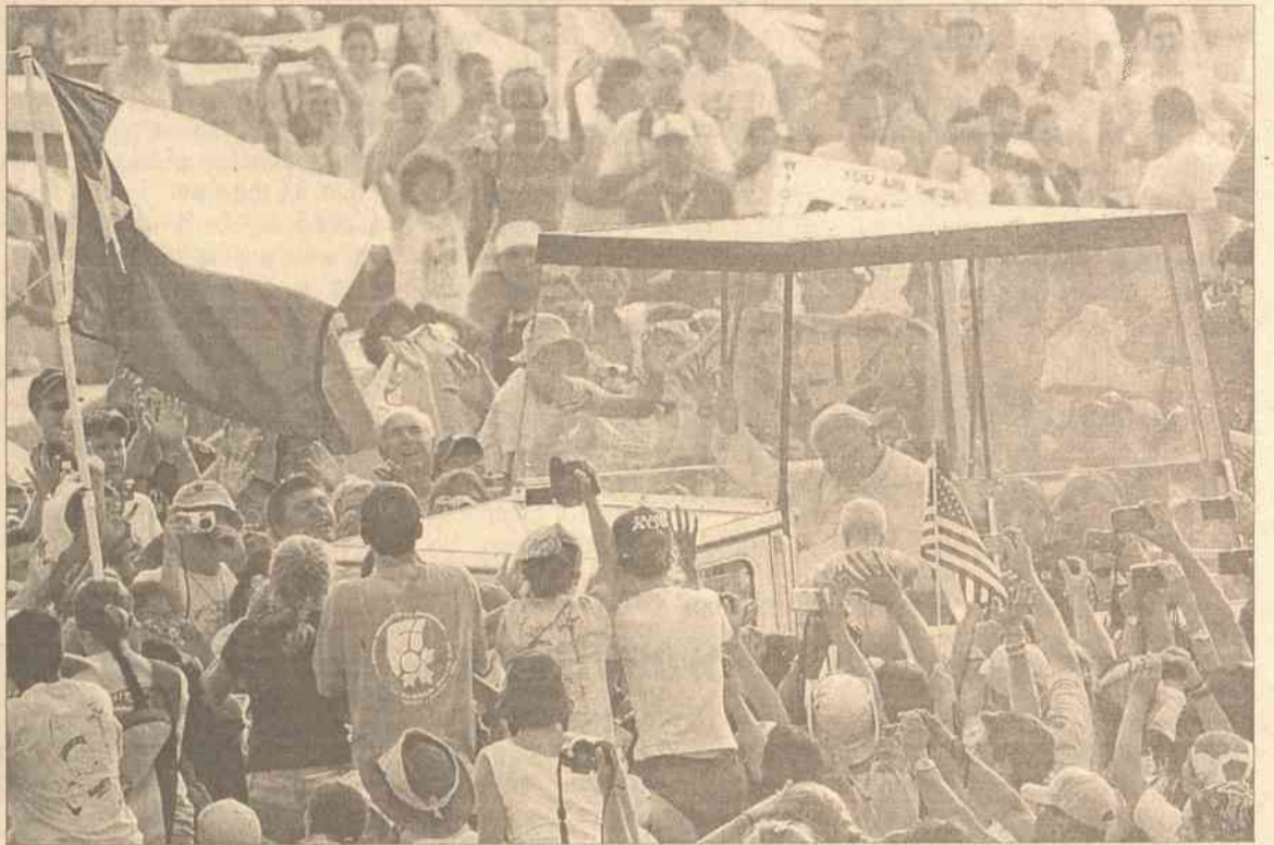
Ucieczek młodych pielgrzymów nie skomentowały władze w Hawanie, media kubańskie nawet nie wspomniały o tym incydencie