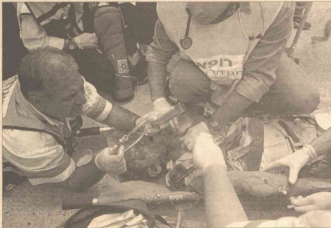
Palestyńczycy grożą, że w odwecie za każdego zlikwidowanego przez Izrael lidera palestyńskiego ugrupowania zabiją co najmniej stu Izraelczyków

Dla Hamasu zamach w Jerozolimie był odwetem za to, co stało się 22 lipca, kiedy w nalocie izraelskim na Gazę zginął założyciel i przywódca Izzedin al-Kassam, Salah Szehada. Poza nim pod gruzami zrównanych z ziemią domów zginęło czternaście osób, głównie dzieci. Po tej akcji Hamas zapowiedział serię od-