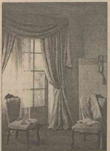
Tkaniny nadają wnętrzu styl, podkreślają jego indywidualność

Zdaniem naszego rozmówcy, mimo mających nieco biurowy charakter żaluzji i rolet, ciągle modne są romantyczne koronki, delikatne organdyny, zwiewne muśliny, przezroczyste i lekkie jak mgiełka woale. Przepuszczają światło, a jednocześnie chronią mieszkanie przed spojrzeciami ciekawskich sąsiadów. Miłośniczki solidnych i ciężkich zasłon z pewnością skuszą się na zasłony miękko układające się i uszyte z trzech warstw: pod-