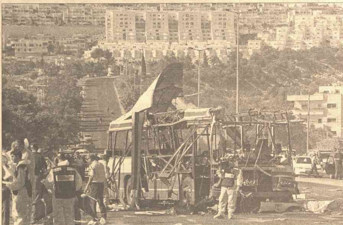
Potężny wybuch wyniósł w powietrze zarówno szczątki pojazdu jak i poszarpane szczątki ludzkie

Zamach został natychmiast potępiony przez władze Autonomii Palestyńskiej. Główny palestyński negocjator Saeb Erekat przypominał, że rząd Autonomii już wcześniej zapowiadał, że nie będzie tolerować akcji, wymierzonych przeciwko izraelskiej ludności cywilnej. "Nie możemy być oskarżani o tę akcję. Zdecydowanie odrzucamy wszelkie