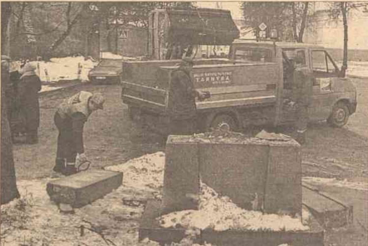
Tak wyglądał pomniczek na Zarzeczcu po staranowaniu go przez samochód rankiem 13 stycznia 2001 roku

W 1968 roku jeździłem odwiedzić swe rodzinne miasto. Chodząc po mieście, zwiędzając zabytki, przypomniało mi się to wydarzenie... Poszedłem poszukać tego