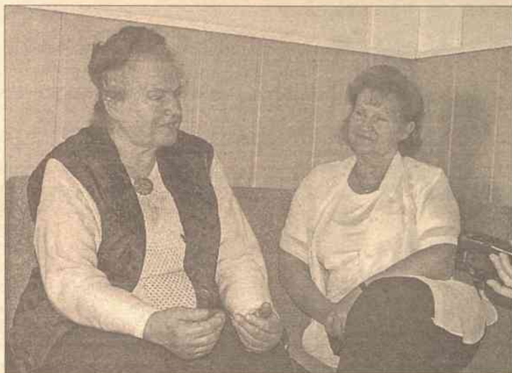
Przyjeżdżamy żeby poczuć swoją tożsamość

– Obecnie nasze stosunki na wszystkich szczeblach są bardzo dobre i takie pozostaną. Poza tym Europa unika przesuwania granic i nikt nie będzie rozważał takiej możliwo-