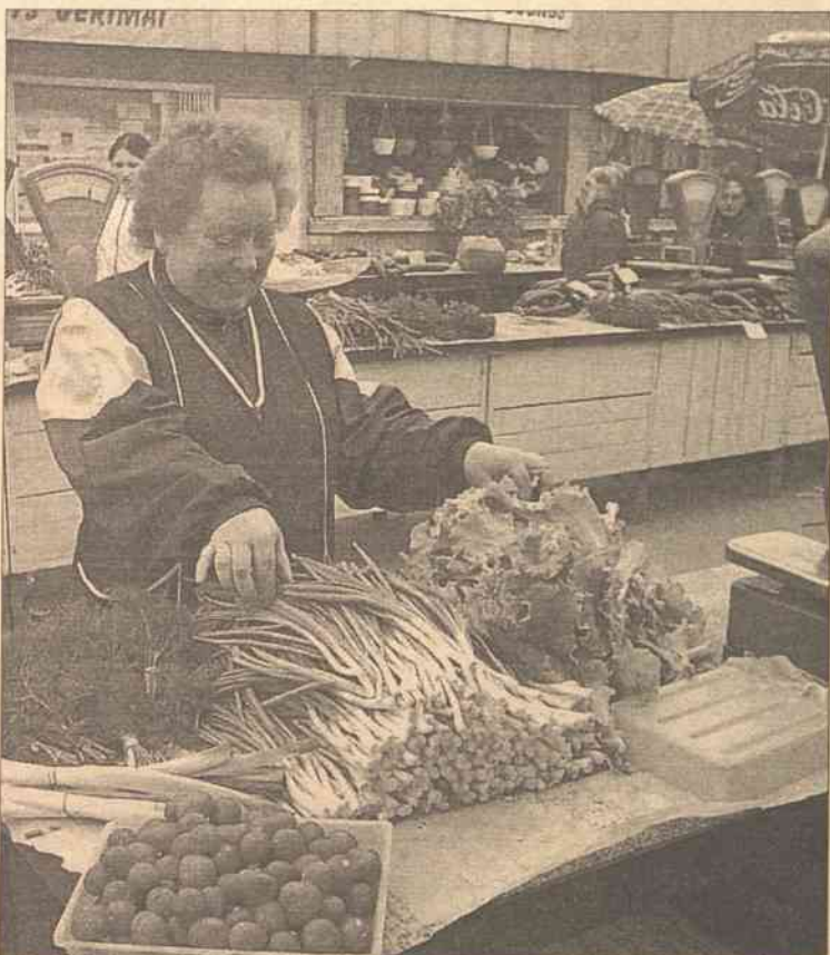
Zieleninę można już jeść garściami