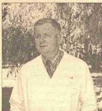
Często potrzebna jest pomoc chirurga dłoni

Pracując na oddziale mikrochirurgii Szpitala Czerwonego Krzyża nierzadko mam do czynienia z mieszkańcami naszego rejonu, którzy doznali różnych urazów. Najczęstsze bywają okaleczenia rąk piłą tarczową a także innymi mechanizmami rolniczymi. Okaleczenia bywają ciężkie, skomplikowane i wymagające pilnej operacji. Najczęściej naraz zostaje uszkodzonych kilka struktur, jak ścięgna, kości, nerwy, naczynia krwionośne. Operacje nie są łatwe. Nie każdy szpital potrafi je wykonać. Często potrzebna jest pomoc chirurga dłoni. Podczas operacji nerw czy naczynie krwionośne można zszyć tylko z pomocą mikroskopu, przy czym pole operacyjne zostaje powiększone 7-10-20 razy. Niekiedy ludzie mają nawet obcięte palce bądź większe części ręki. Przyszycie palców i innych części ręki (replantacja) jest operacją bardzo skomplikowaną i długą. Może ona