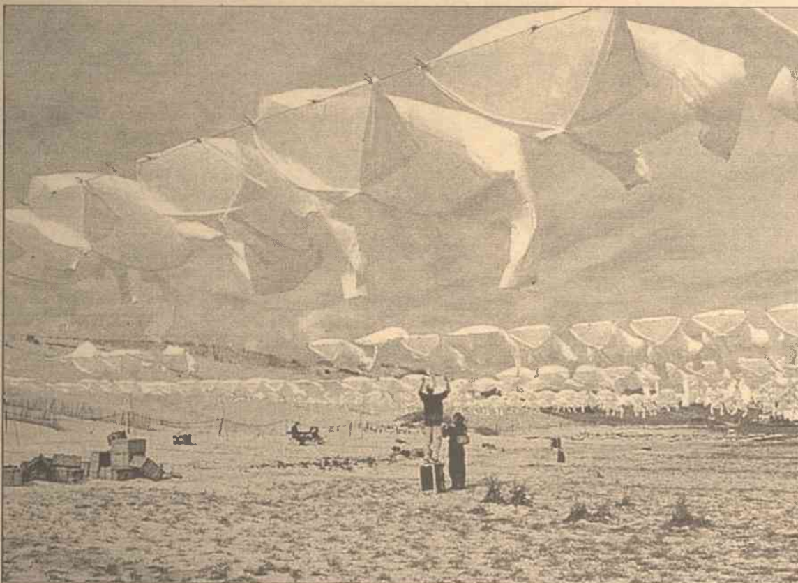
W Holandii członkowie „Styx Theatre”, z Serge Noyellem na czele, suszą białe koszule na plaży, przygotowując instalację do festiwalu sztuki, który potrwa 10 dni.