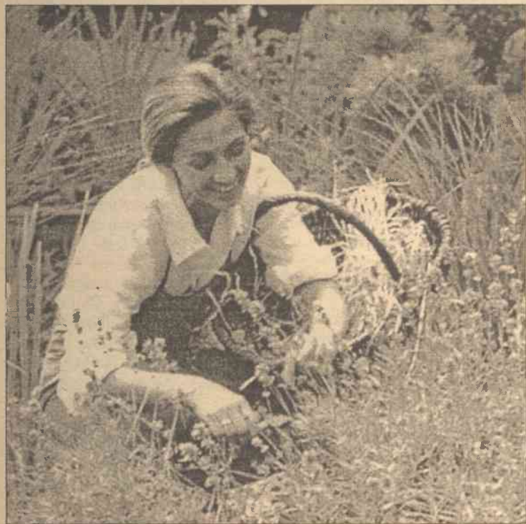
Bo rosną tuż-tuż...