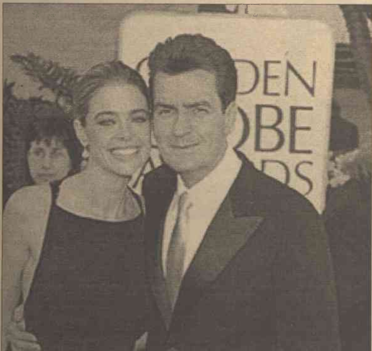
Znany aktor Charlie Sheen, ostatnio występujący w serialu telewizyjnym „Miasto chaosu” (Spin City) w sobotę wieczorem w Los Angeles poślubił aktorkę Denise Richards.

Policjanci skontrolowali także autobus. Okazało się, że pojazd miał m.in. niesprawny układ hamulcowy. (PAP)