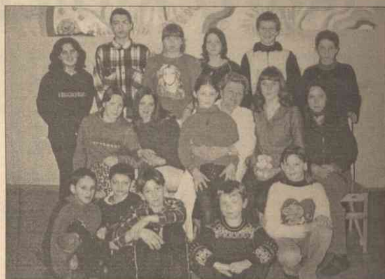
To cała nasza szkółka w szpitalu

Podobnie jak w każdej szkole odbywają się tu uroczystości związane z różnymi datami, np. „Nowy Rok”, „Dzień Niepodległości”, „Dzień Matki”. Podczas świąt dzieci