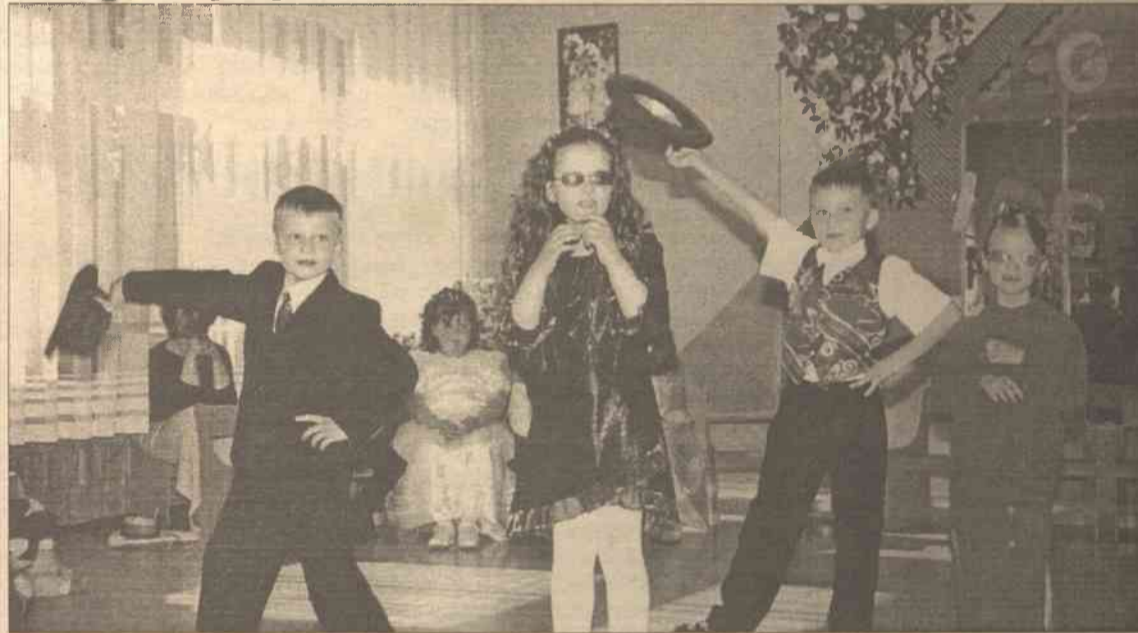
Dzieciaki wystąpiły z atrakcyjnym koncertem

Długo zastanawialiśmy się nad tym, jak inaczej niż zazwyczaj zorganizować w przedszkolu wieczorek pożegnalny. Wśród wielu propozycji zwyciężyła ta, że tego dnia sala naszego przedszkola ma się zamienić nie tylko w krainę bajek, ale też nauki.