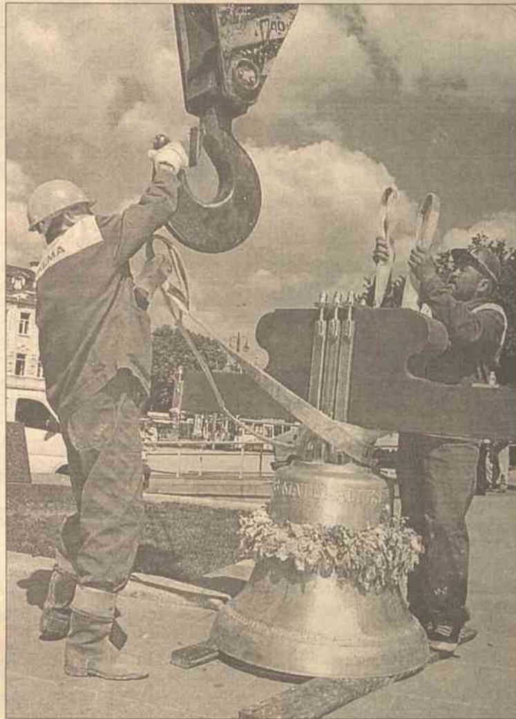
Moment decydujący – za chwilę na haku zawisnie dzwon