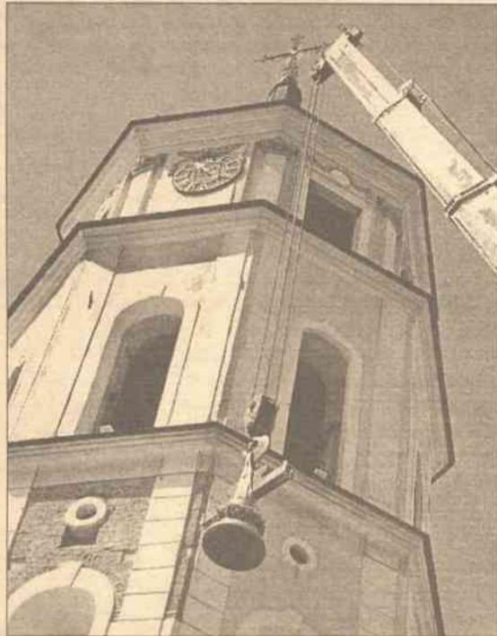
Z takiej wysokości i w objętościach takiego dźwigu każdy dzwon był maluchem