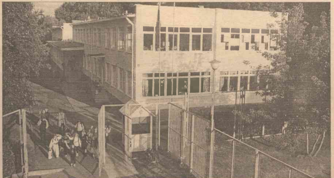
W szkole oprócz dzieci mogą się uczyć osoby dorosłe, po ukończeniu studiów

Uprzejmie zapraszają 31 maja 2002 r. o godz. 14.00 do Wileńskiego Domu Nauczyciela (ul. Vilniaus 39) na wystawę malarstwa dzieci ze szpitala przy ul. Marszałkowskiej w Warszawie „Ilustracje do wierszy Marii Konopnickiej”.