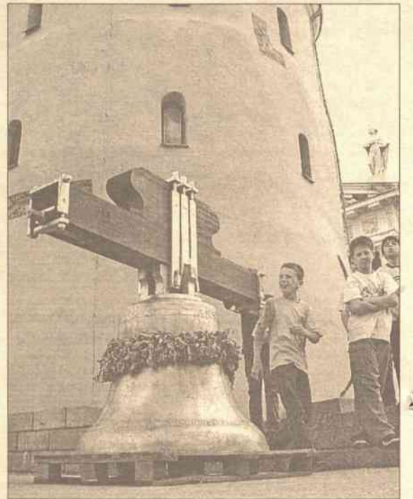
Wrz z rozpoczęciem wakacji – pierwsza atrakcja – zrobienie zdjęcia przy dzwonie