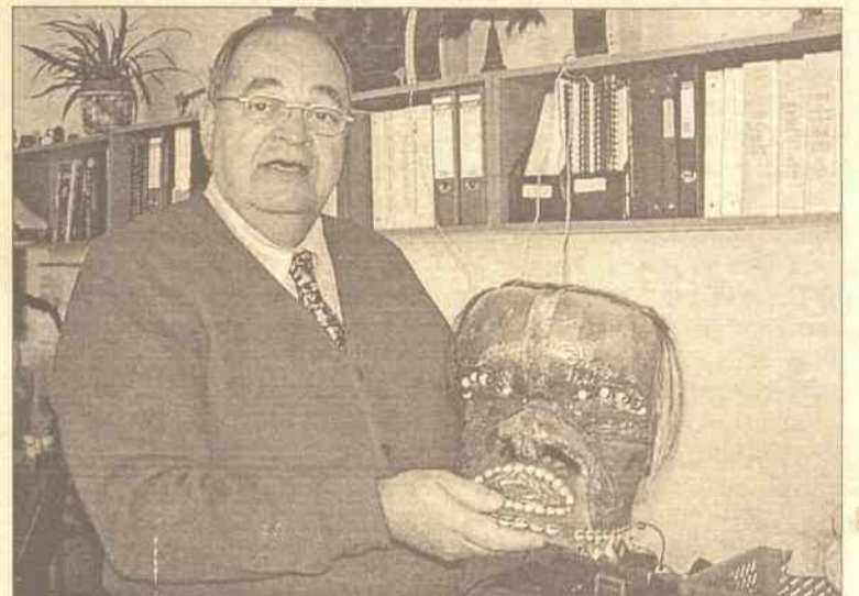
Jest zawziętym kolekcjonerem, jak sam określa, „staroci”

Ważnym organem w szkole jest Rada Szkoły, składająca się z rodziców, administracji szkoły i nauczycieli. W czasie obrad są przeprowadzane różne seminaria, wykłady na tematy zarządzania, współpracy, wyznaczania celów, odpowiedzialności wzajemnej, polityki szkoły i administrowania. Rodzice bardzo chętnie