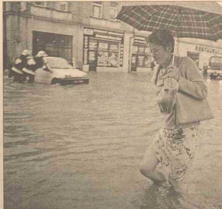
Nocne oberwanie chmury nad Skarżyskiem (Polska) spowodowało gwałtowne przybranie rzeki Kamiennej. Woda uszkodziła most na krajowej „siódemce” w Skarżysku-Kamiennej. Policjanci ewakuowali w nocy z wtorku na środę sześć rodzin w Mostkach i Wojtyniowie, gdyż zerwaniem groziła tama na pobliskim zbiorniku wodnym. W Kielcach całą noc usuwano skutki kilkugodzinnej ulewy, która we wtorek wieczorem zalala ulice miasta.

Julia Tymoszenko, była wicepremier w rządzie Juszczenki, uważa, że jeśli nie uda się odwołać Łytwyna, to należy wyprowadzić ludzi na ulice i zorganizować strajki.