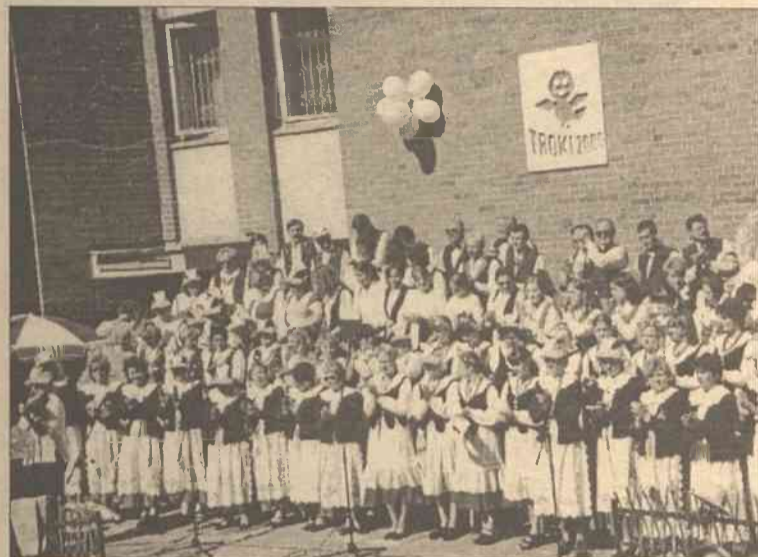
Ogrzani aurą wiosny bawimy na imprezach i festiwalach. Po rozkwitnięciu „Kwiatów Polskich” tradycyjnie daje o sobie znać jego młodszy brat – festyn „Dźwięcz, polska pieśń!”, który w roku bieżącym startuje po raz 12.

Organizatorzy – Związek Polaków na Litwie i zespół folklorystyczny „Stare Troki” – uprzejmie zapraszają wszystkich na XII Festyn Kultury Polskiej Ziemi Trockiej „Dźwięcz, polska pieśń!”, który w dniach 1-2 czerwca będzie miał miejsce na Placu Zamkowym w Starych Trokach.