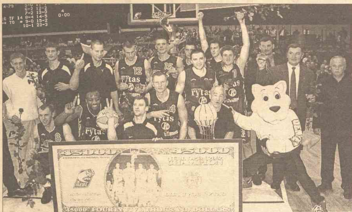
Koszykarze „Lietuvos rytas” po raz pierwszy w swej historii zostali zwycięzcami Północnoeuropejskiej Ligi Koszykówki NEBL

– Mecz z silnym rywalem był trudny. Cieszę się, że zostaliśmy mistrzami NEBL – powiedział po meczu trener „Lietuvos rytas” Jonas Kazlauskas, który został uznany za najlepszego trenera ligi NEBL w se-