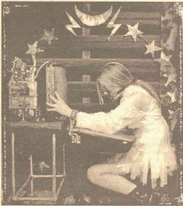
Kultura gotycka ma swych zwolenników

Specjalnymi nagrodami oraz dyplomami fundacji wyróżni się 36 uczniów, po 12 – za pierwsze, drugie i trzecie miejsce. Inni otrzymają nagrody ufundowane przez sponsorów konkursu. Na prośbę fundacji o wsparcie finansowe konkursu już odezwano się 11 spółek, które