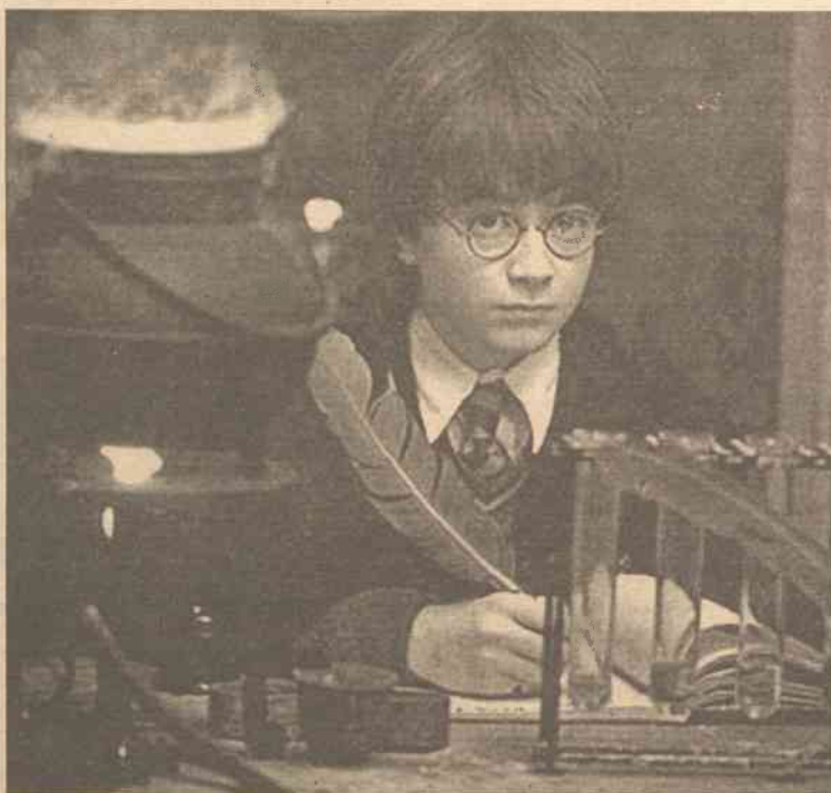
Może któraś z bajek okaże się nie tylko wartą opublikowania, ale popularnością dorówna „Harry'ego Pottera”?

Na podstawie inf. wł., ELTA i Bombonešis stronę przygotowała Ewelina Bondar