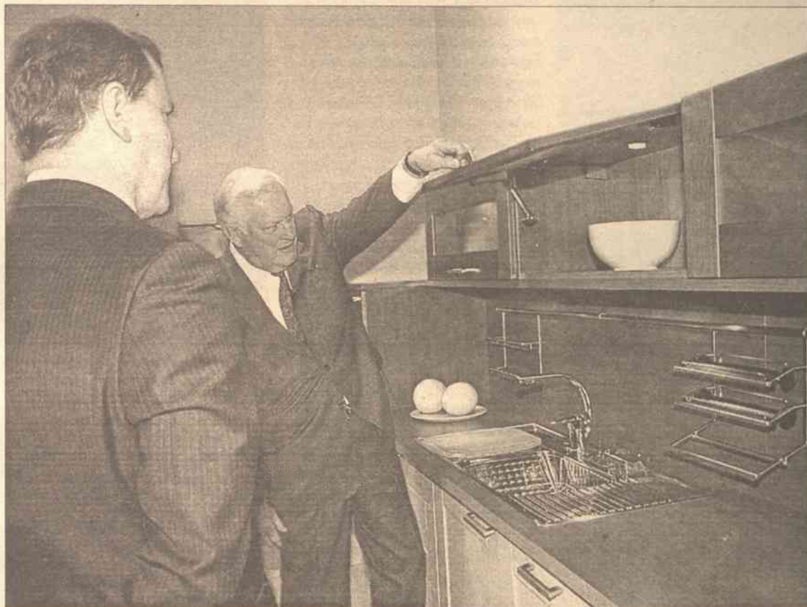
Kuchnia dla każdego, nawet premiera

Mówiąc o trendach panujących obecnie w meblowej modzie, moż-