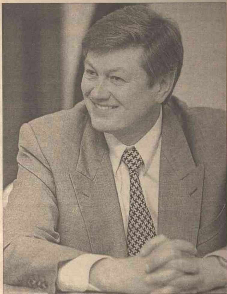
Znam problemy Wileńszczyzny i jej mieszkańców