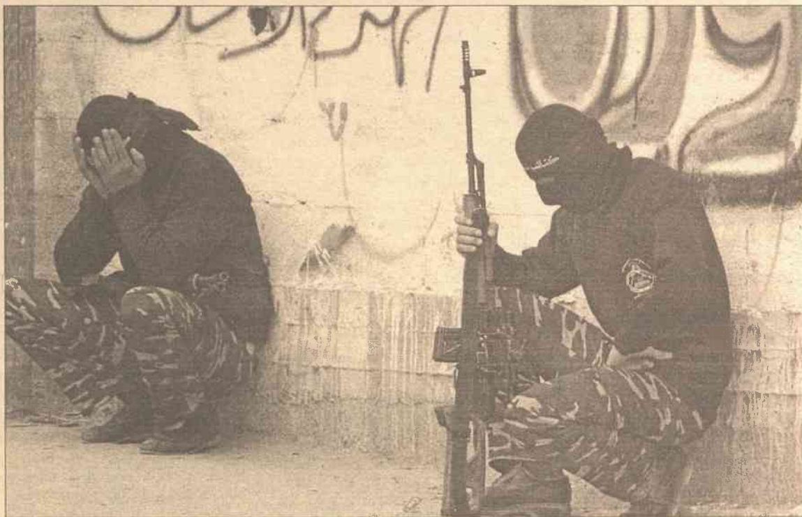
Wczoraj zginęli kolejni młodzi Palestyńczycy

Radykalna organizacja palestyńska Hamas, dotychczas wspierająca akcje antyizraelskie zama-