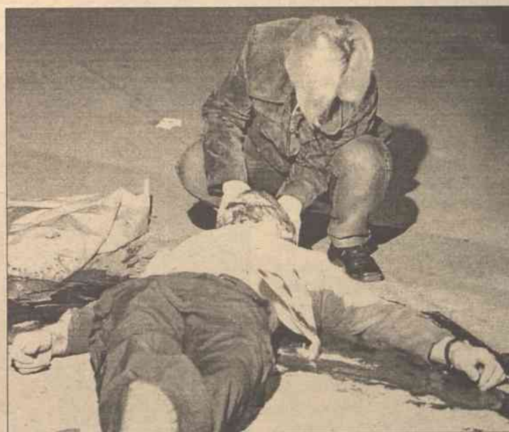
W głowie denata znaleziono dziewięć ran postrzałowych