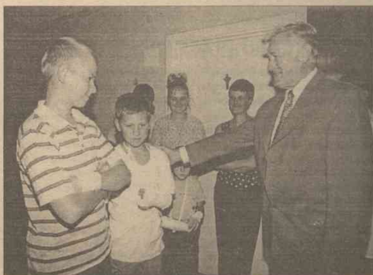
Ochrona praw dzieci staje się problemem narodowym, ponieważ w przypadku, gdy go się nie rozwiąże, grozi nam „wybuch społeczny”