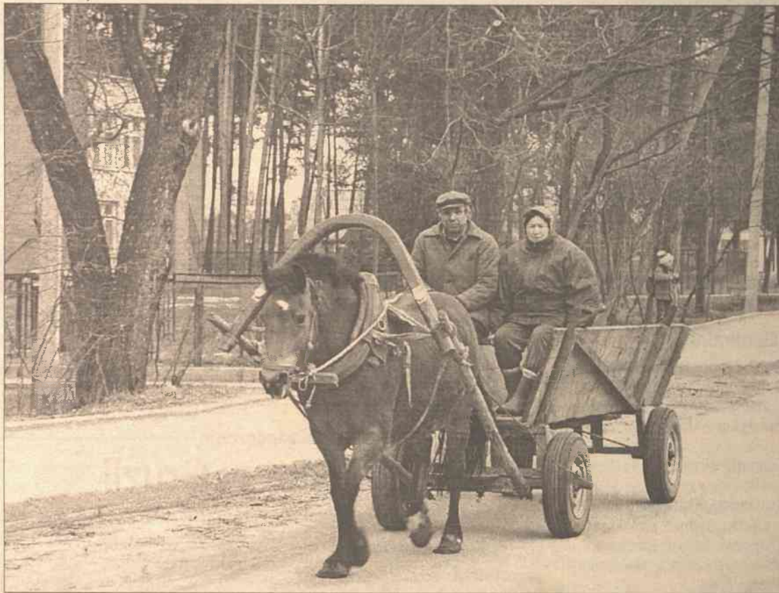
Rudziszki są ziemią zapomnianą. Starosta z trudem przypomina o jakichkolwiek inwestycjach w tym mieście.

— Nie mogę mówić o wszystkich, są rodziny, które dbają nie tylko o klatki schodowe czy własny skrawek ziemi pod balkonem, ale też dookoła domów. Są jednak też tacy, którzy wysypują śmieci akurat w tym miejscu, gdzie inni posprzątali. Mogę ukarać właściciela domu prywatnego, jeżeli na jego podwórku nie ma porządku. Ale kogo mam ukarać z dwunastomieszkaniowego domu? Powiniennem mieć dowód,