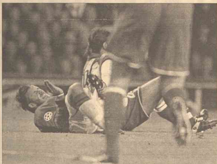
David Beckham urazu doznał na skutek brutalnego zagrania pomocnika Aldo Pedro Duschera. Wstępna diagnoza mówi o złamaniu jednej z kości lewej nogi i około dwóch miesiącach przymusowej przerwy. Jeżeli zostałaby ona potwierdzona, to występ Beckhama na mistrzostwach świata byłby wykluczony

Manchester United dwukrotnie pokonał Deportivo La Coruna i awansował do półfinałów piłkarskiej Ligi Mistrzów, gdzie jego rywalem będzie Bayer Leverkusen. Manchester United – Deportivo La Coruna 3:2 (Ole Gunnar Solskjaer 23, 56, Ryan Giggs 68 – Laurent Blanc 45-sam., Djalminha 90).