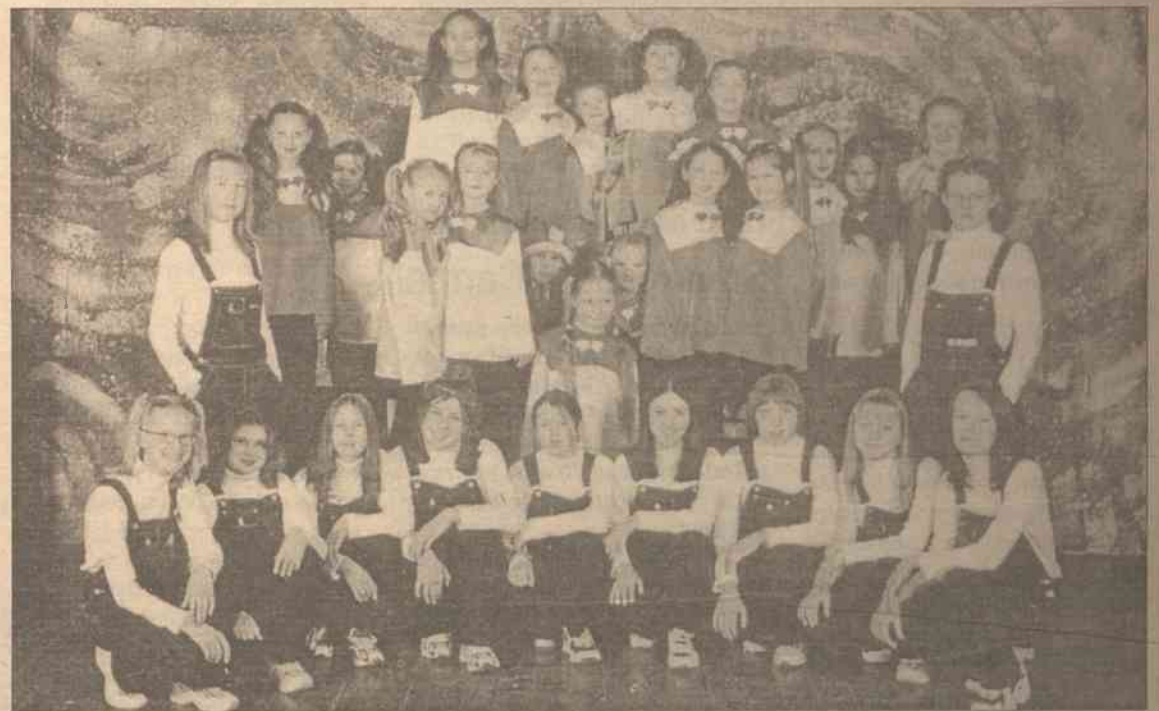
Obecnie do zespołu „Svajonéle” należy 18 dziewcząt w różnym wieku i różnych narodowości