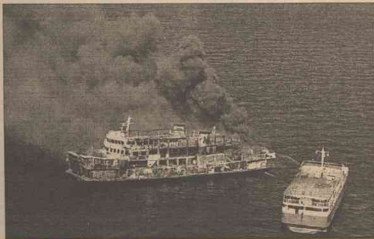
Wg straży przybrzeżnej, prom nie był przeladowany, co na Filipinach jest nagminną praktyką i częstą przyczyną katastrof morskich

Wg straży przybrzeżnej, prom nie był przeladowany, co na Filipinach jest nagminną praktyką i częstą przyczyną katastrof morskich. Zgodnie z dokumentami, MV Maria Carmela mogła zabrać na pokład 326 pasażerów.