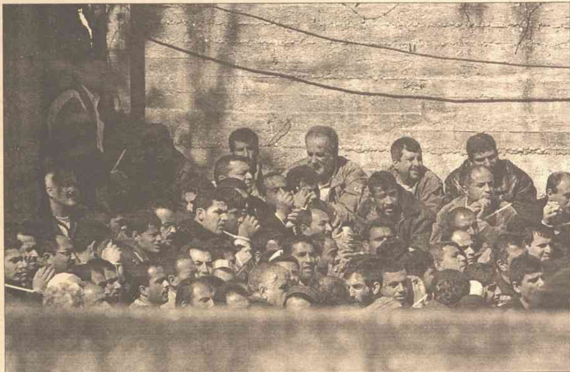
Sily izraelskie aresztowały od początku ofensywy na Zachodnim Brzegu Jordanu, od 29 marca, ponad cztery tysiące Palestyńczyków

Szef dyplomacji USA przybył wczoraj wieczorem do Izraela. Na konferencji prasowej z rosyjskim ministrem spraw zagranicznych Igiorem Iwanowem, Powell powiedział, że ma wyraźny mandat społeczności międzynarodowej dla